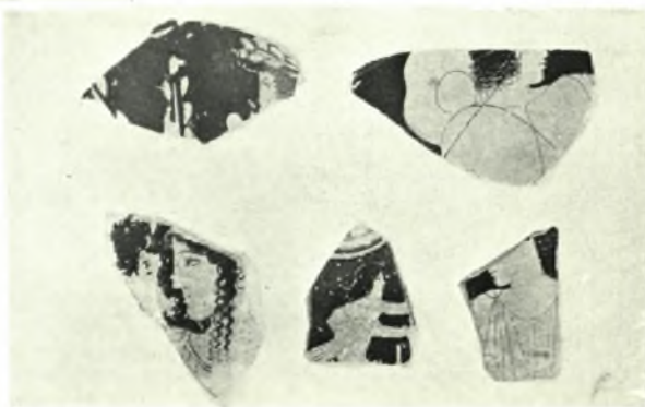
α. Τμήμα περιρραντηρίου ανατολιζούσης εποχής, β. Τμήμα αρχαϊκού άττικου άμφορέως, γ. Τμήμα αρχαϊκής άττικης όλπης με παράστασιν Διονύσου, δ. Τμήμα μελανομόρφου πάματος εικονίζοντος την θήραν του Καλυδωνίου κάπρου, ε. Έρυθρομ. όστρακα εκ του οικoπέδου Άγγελoπούλου Γ. ΔΟΝΤΑΣ