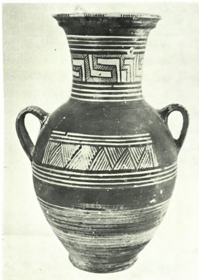
α. Κάλυμμα λεκάνης ρυθμού Keritch εκ του οικοπέδου Ζαχαράτου, β. Γεωμετρικός άμφορεύς του τάφου 5