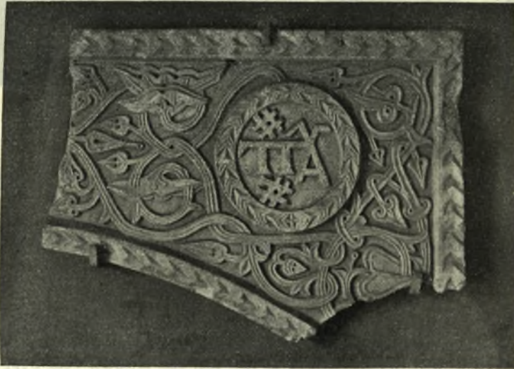
Είχ. 8. Μονόγραμμα Παλαιολόγων ἐπὶ ἐτέρου τόξου τοῦ αὐτοῦ κιβωρίου.

Ἡμισυ δεξιὸν τοῦ περιτόξου ἐνὸς κιβωρίου.