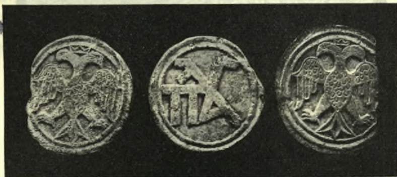
Εἰκ. 6. Μετάλλια ἐκ τῶν ὄψεων τοῦ κιονοκράνου τῶν εἰκ. 4 καὶ 5.

Ἐδῶ ἐπίσης τὸ ὄνομα τοῦ Αὐτοκράτορος, τὸ ὁποῖον θὰ ἀνεγράφετο ἐν τῷ ἀριστερῷ ἀντιστοίχῳ μεταλλίῳ, ἔλλειπει.