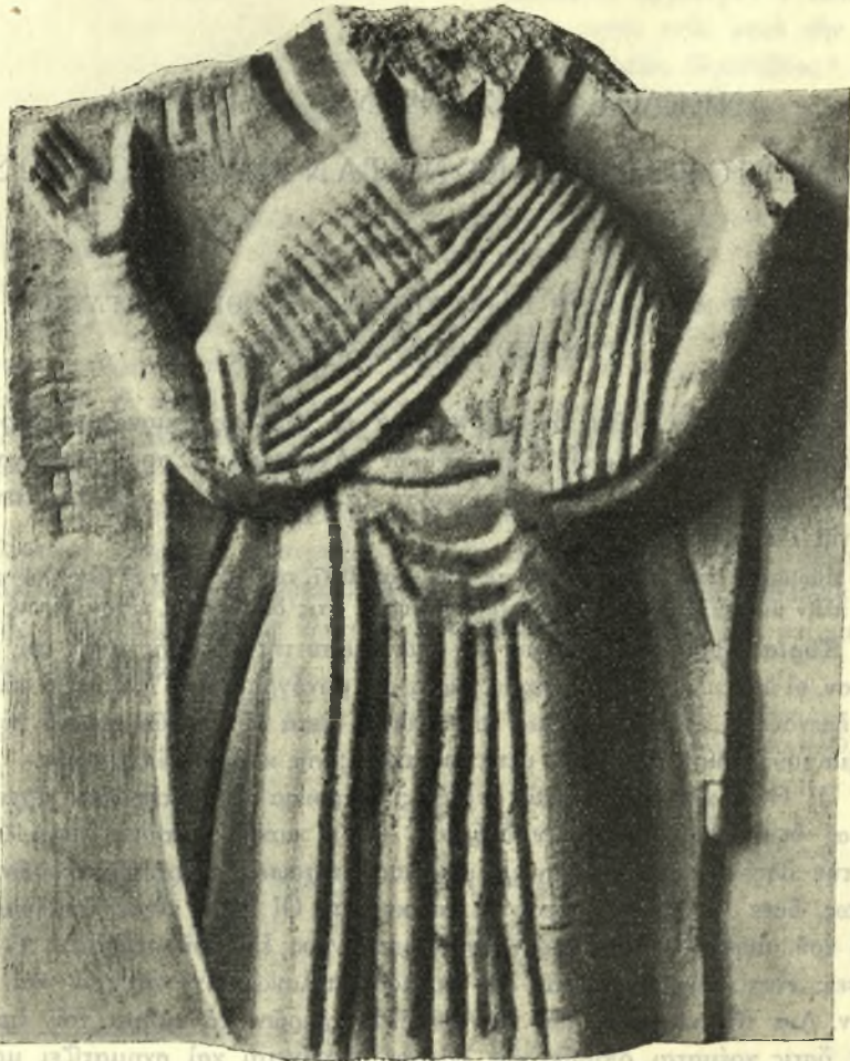
Εἰκ. 1. Προσθία ὄψις ἀναγλύφου Παναγίας δεομένης.

Ἡ πλάξ ἐπλαισιοῦτο ἐκ τῆς δεξιᾶς πλευρᾶς ὑπὸ γυμνοῦ προέχοντος περιζώματος, τοῦ ὁποίου διατηρεῖται ἐν τμῆμα. Ἐπὶ τῆς πλευρᾶς ταύτης ἀπεικονίζεται ὁμοίως ἢ ἰδίᾳ παράστασις, ἐν τῇ ἰδίᾳ στάσει, καὶ φέρουσα ὅμοιον ἔνδυμα. Ἡ μόνη παρατηρουμένη ἐξαιρέσις εἶναι, ὅτι ἡ ἀριστερὰ κνήμη, ἀνεπαισθήτως καμπτομένη, καὶ ἐλαφρῶς διαγραφομένη ὑπὸ τὸ ἔνδυμα, εἶναι διατετηρημένη ὑπὸ τεσσάρων μικρῶν ὀπῶν, εἰς τὸ ὕψος τοῦ γόνατος, ἔνθα προσηρόζετο μικρὸς μεταλλικὸς σταυρός. Αἱ ἴδιαι ὀπαὶ διακρίνονται εἰς τὸ ἄκρον τῆς ἀριστερᾶς περιχειρίδος καὶ ἔχουσι τὸν αὐτὸν σκοπόν.