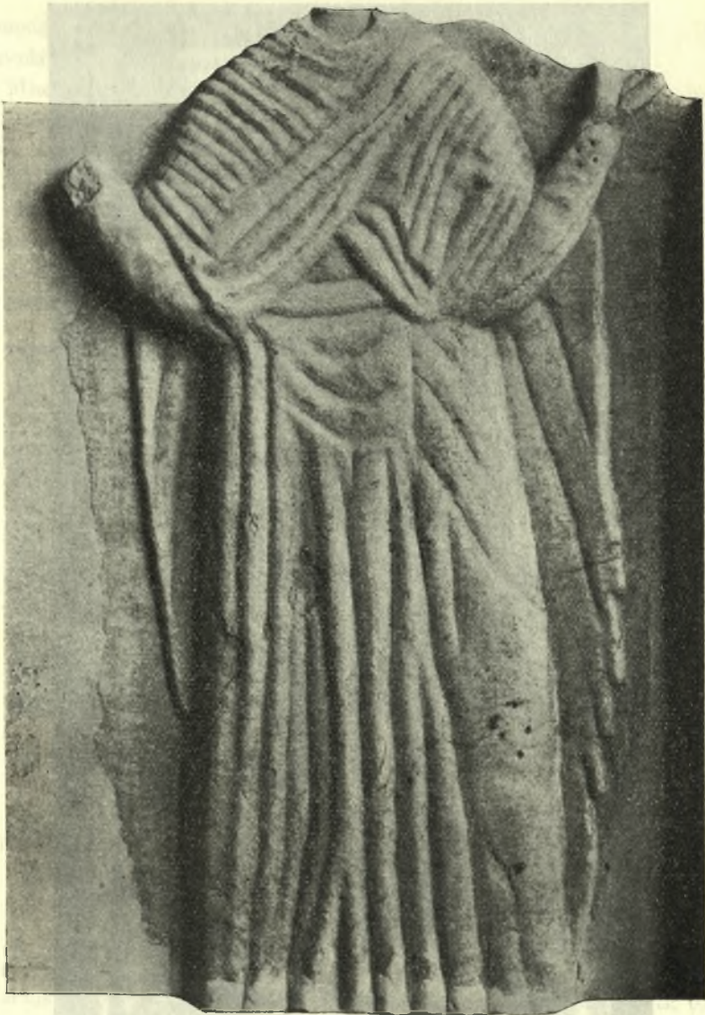
Εἰκ. 2. Ὅπισθία ὄψεις ἀναγλύφου Παναγίας δεομένης.

Τὸ ἀνάγλυφόν μας, συγκρινόμενον πρὸς τὰς πολυαριθμούς ἤδη γνωστὰς ἀναπαραστάσεις τῆς δεομένης Θεοτόκου 1 , δὲν παρουσιάζει ἀξιοσημειώτους