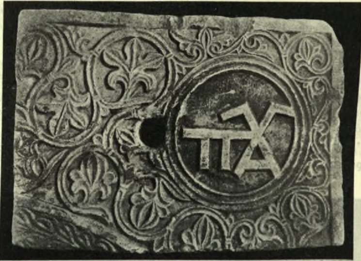
Είχ. 7. Μονόγραμμα Παλαιολόγων ἐπὶ τοῦ δεξιοῦ τόξου κιβωρίου.