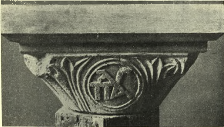
Εἰκ. 4. Μία τῶν ὄψεων κιονοκράνου μετὰ μονογράμματος τῶν Παλαιολόγων.

Τὸ ἐν λόγῳ ἀνάγλυφον θὰ ἔχη ἀναμφιβόλως ἀνευρεθῆ κατὰ τὰς ἀνασκαφὰς τὰς ὁποίας ἐξετέλεσε τὸ Σῶμα τῆς Γαλλικῆς Κατοχῆς εἰς τὴν περιοχὴν τοῦ Ἱερῶν τῶν Σουλτανικῶν Ἀνακτόρων, ἀκριβῶς εἰς τὴν θέσιν τοῦ Ἀνακτόρου Κωνσταντίνου τοῦ Μονομάχου, καὶ τῆς Μονῆς Ἁγίου Γεωργίου τῶν Μαγγάνων. Εἰς τὴν ἰδίαν θέσιν ἀνευρέθη καὶ τὸ μέγα μαρμάρινον ἀνάγλυ-