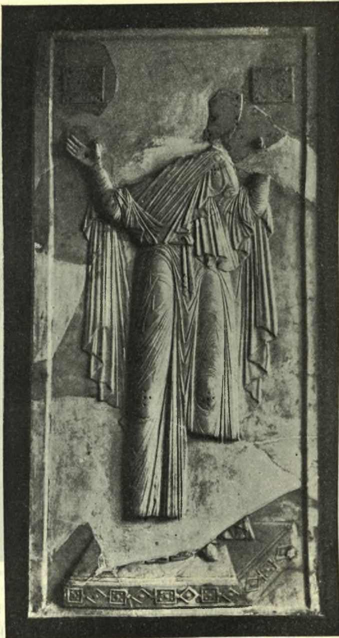
Εικ. 3. Ἀνάγλυφον Παναγίας δεομένης τοῦ Μουσείου Κωνσταντινουπόλεως.