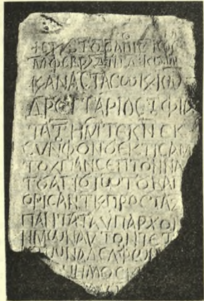
Εἰκ. 6. Ἡ κτιτορικὴ ἐπιγραφή τοῦ ἁγίου Ἰωάννου Μαγκούτη.

Ὁ συστηματικῶς μελετήσας τὴν διακοσμητικὴν γλυπτικὴν τῶν ἐν Ἑλλάδι παλαιοχριστιανικῶν καὶ βυζαντιανῶν μνημείων κ. Γεώργιος Σωτηρίου, κρίνων ἐπὶ τῇ βάσει τῶν χρονολογη-