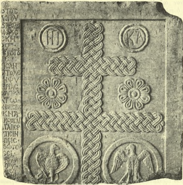
Εἰκ. 4. Δεύτερον θωράκιον.