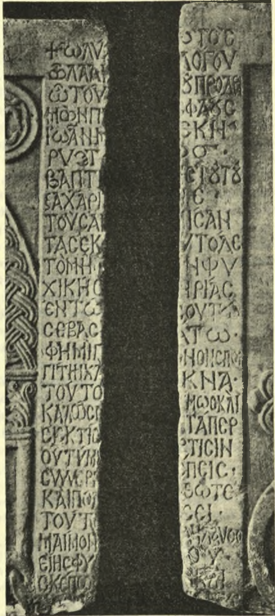
Εἰκ. 5. Ἡ ἐπιγραφή τῶν δύο θωρακίων.

Ἡ ἐπιγραφή αὕτη ἀποτελεῖται ἐξ ὀκτῶ στίχων τριμέτρων ἰαμβικῶν δωδεκασυλλάβων, ἔχουσα τὰ γράμματα μετὰ πολλῆς ἐπιμελείας κεχαραγμένα καὶ κανονικά. Ἡ παλαιογραφία τῶν γραμμάτων εἶναι, πλὴν ἔλαχιστων διαφορῶν, ἀνάλογος πρὸς τὴν παρατηρουμένην εἰς τὴν ἐπιγραφὴν τῶν θωρακίων τοῦ ἁγίου Ἰωάννου Μαγκούτη· φέρει