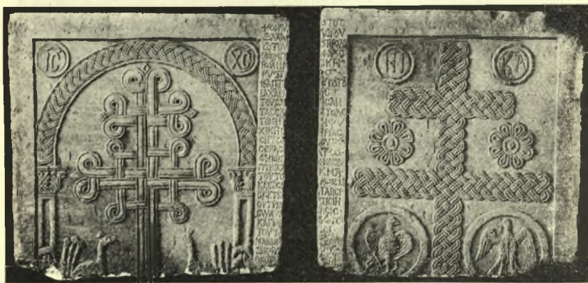
Εἰκ. 2. Τὰ δύο θωράκια τοῦ ναοῦ τοῦ ἁγ. Ἰωάννου Μαγούτης.

Εἰς τὴν ἐπιφάνειαν τὴν ἀποτελουμένην ἐκ τῶν δύο ἀντιστοίχων καθέτων πλευρῶν τῶν πλαισίων τῶν θωρακίων καὶ τοῦ κιονίσκου, εἶχεν ἐγχαραχθῆ ἐπιγραφή, ἣς νῦν, μετὰ τὴν ἐξαφάνισιν τοῦ κιονίσκου, ἀπομένουσι τὰ πρῶτα καὶ τελευταῖα γράμματα τῶν στίχων, καθισταμένης οὕτω ἀδυνάτου τῆς συμπληρώσεως καὶ ἀναγνώσεως αὐτῆς ὁλοκλήρου (Εἰκ. 2, 3 καὶ 4).