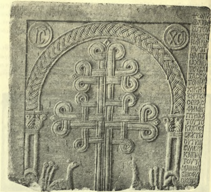
Εικ. 3. Πρώτον θωράκιον.

υπάρχουσι συνδεδεμένα κατά τρόπον περιέργον δύο ἢ τρία γράμματα ων, ὧν ὁμως δὲν εἶναι εὐκόλος ἡ ἀνάγνωσις. Πᾶσαι σχεδὸν αἱ λέξεις φέρουσι πνεύματα καὶ τόνους, ὡς παρατηρεῖται καὶ εἰς ἄλλας βυζαντιακὰς ἐπιγραφάς, ἰδίᾳ ἀπὸ τῆς δωδεκάτης ἑκατονταετηρίδος καὶ ἐντεῦθεν.