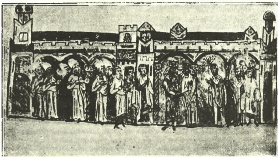
Εἰκ. 4. Ἡ ἐν τῷ ναῷ τελετὴ τοῦ στεφανώματος.