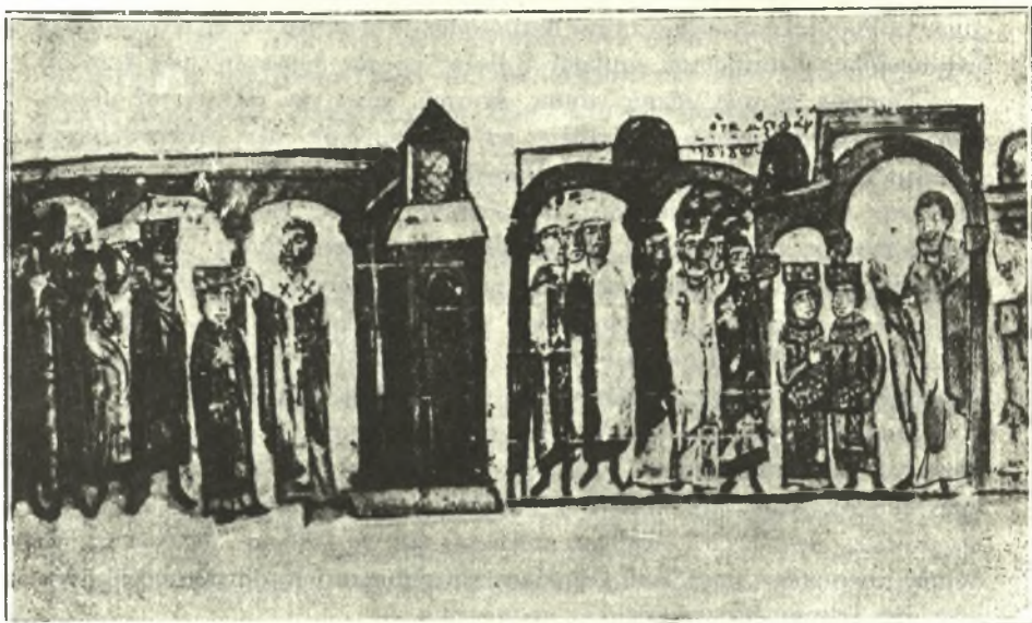
Εἰκ. 3. Ἡ στέψις καὶ τὸ στεφάνωμα βασιλέως.