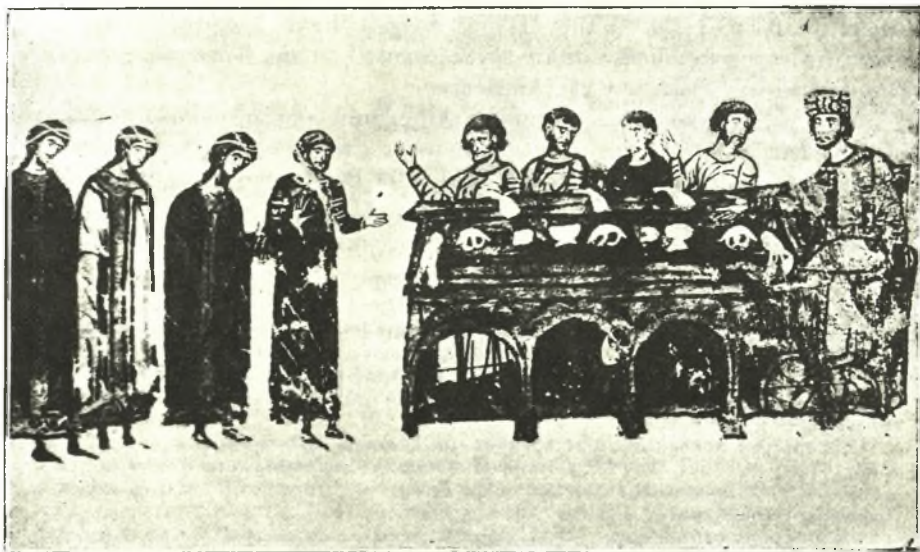
Εἰκ. 6. Τὸ γαμήλιον συμπόσιον.