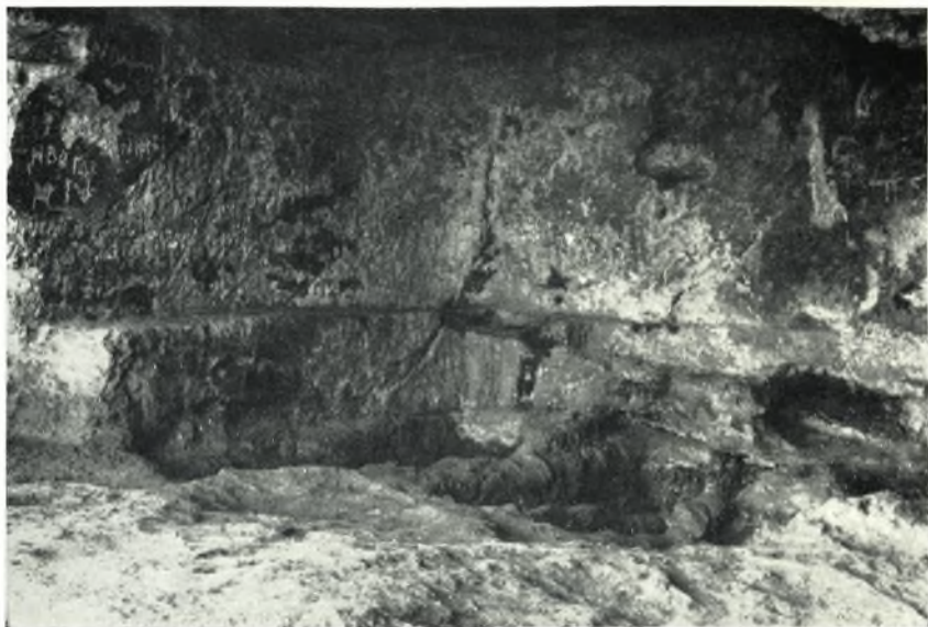
α. Ὑποψὶς τοῦ βάθους τῆς ἀνοικτῆς αἰθούσης.