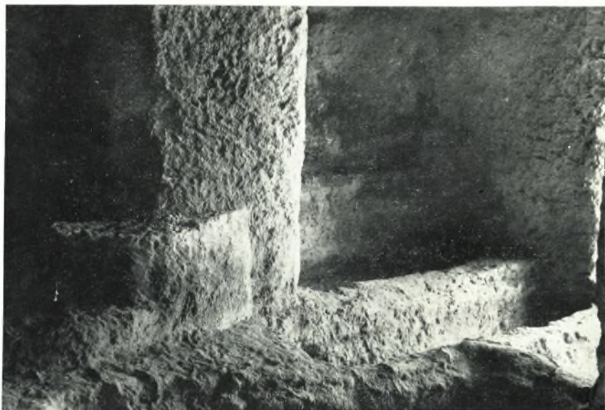
α. Τράπεζα νεκρικών προσφορών (ἀπὸ Ν.). Τὸ δεξιὸν αὐτῆς ἀρχοσόλιον εἶναι μεταγενέστερον.