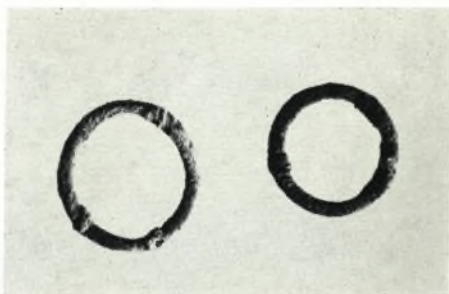
α. Χαλκαῖ πόρπαι.