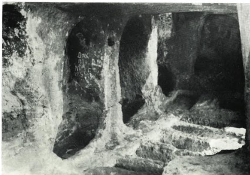
β. Ἀρχοσόλια ἀρχικοῦ νεκρικοῦ θαλάμου (ἀπὸ Ν.).