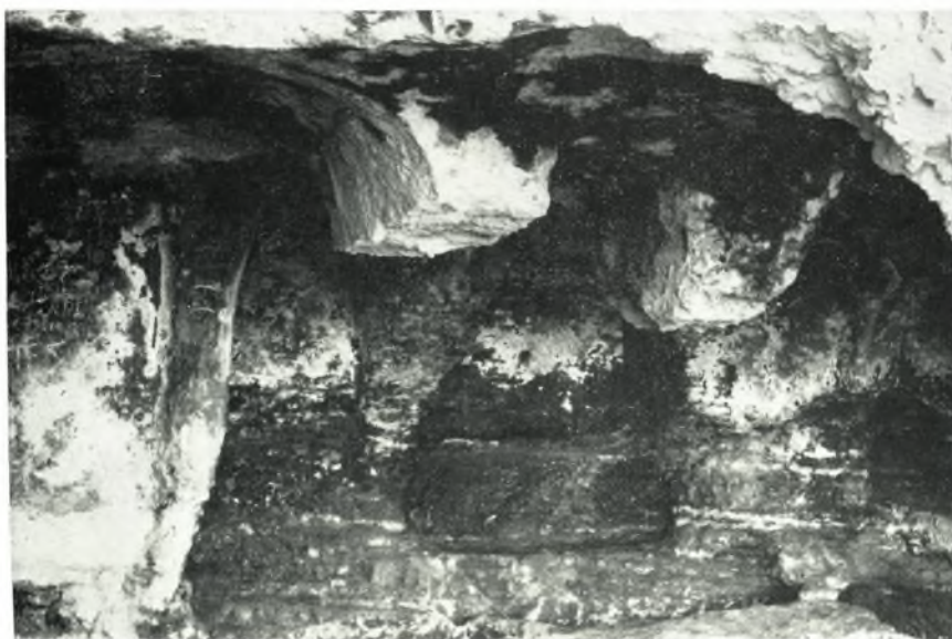
β. Ὑψὺ μέρος πεσίσκων συμφυοῦς κιβωρίου.