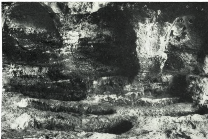
α. Ἐσωτερικὸν τοῦ μεγάλου νεκρικοῦ θαλάμου.