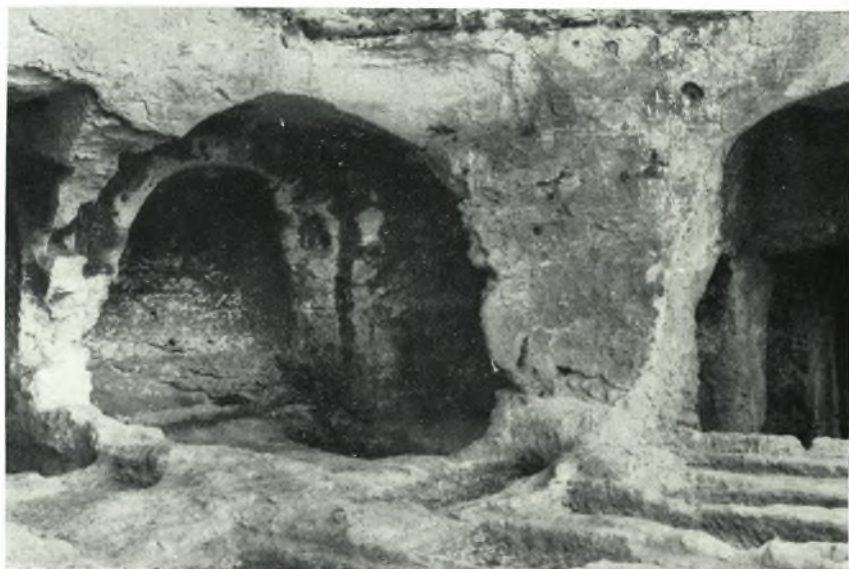
β. Ὑποψις τοῦ παρὰ τὸν διάδρομον μικροῦ νεκρικοῦ θαλάμου (εἰς τὸ μέσον) ἀπὸ Α.