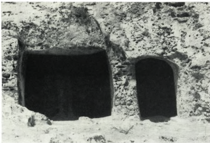
α. Αί εισοδοι τοῦ διαγραμματοειδοῦς διαδρόμου.