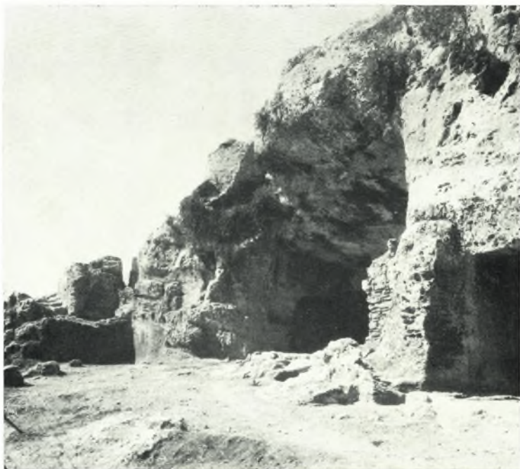
β. Ἀποψις τοῦ πρὸ τοῦ διασκάφου κοιμητηρίου ἀνδρήρου ἀπὸ ΒΑ. (μετὰ τὴν ἀνασκαφὴν).