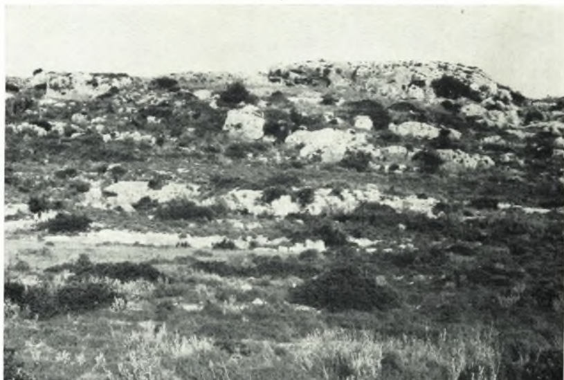
α. Ἀποψις τῆς περιοχῆς τοῦ Ἁγίου Ὀνουφρίου ἐκ τῆς ἀπὸ Μεθώνης εἰς Πύλον Δημοσίᾳς Ὁδοῦ.