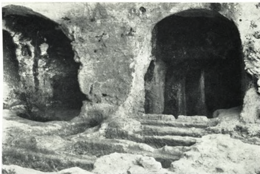
α. Ἐποψις τοῦ πρὸς Ν., πρὸς τὸ μέρος τοῦ σπηλαιώδους κοιτώματος, πέρατος τοῦ διαδρόμου (δεξιά).