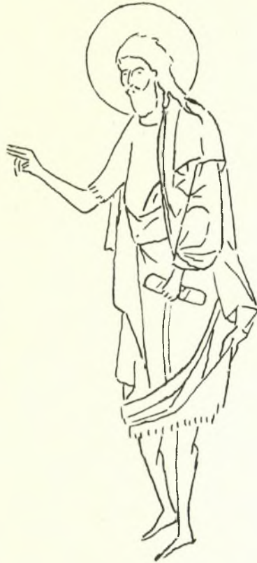
Εἰκ. 4. Ὁ Πρόδρομος ἐν τῇ σκηνῇ τῆς Ἀναστάσεως εἰς τὴν τοιχογραφίαν τοῦ Πέτς.

τὰ δύο τρόπους. Ἡ εἶναι δηλαδή ἀπλῶς ἐγγάρακτοι (Δαβίδ), ἢ δηλοῦνται ἐνιαχοῦ, ὅπως εἰς τὸ ἱμάτιον τοῦ Προδρόμου, διὰ τῶν γωνιῶν τὰς ὁποίας σχηματίζουσι τὰ ἐπαλλήλως καὶ κλιμακῆδόν διατεταγμένα τμήματα τοῦ μεταξὺ τῶν πτυχῶν ἐνδύματος. Ἡ τοιαύτη σχηματικὴ καὶ σχεδὸν συνθηματικὴ δὴλωσις τοῦ ὄγκου μακρὰν βεβαίως ἀπέχει ἀπὸ τὰ ὥραϊα πλαστικὰ ἀνάγλυφα τοῦ 13ου καὶ 14ου αἰῶνος, ὅπως τὰ ἐν τῇ Μονῇ Βλαχερνῶν παρὰ τὴν Ἄρταν καὶ τὰ τῆς Μονῆς τῆς Χώρας (Καχοριὲ Τζαμι) ἐν Κων/πόλει, ἐπὶ τῇ βάσει τῶν ὁποίων γίνεται κυρίως λόγος περὶ ἀναγεννήσεως τῆς πλαστικότητος ἐν τῇ γλυπτικῇ κατὰ τοὺς χρόνους τῶν Παλαιολόγων 1 . Ἐν τούτοις ὁρισμένας λεπτομερείας τῆς τεχνικῆς τοῦ ἀναγλύφου τῆς Βεροίας ἰὰς εὐρίσκομεν καὶ εἰς τὰ καλλίτερα γλυπτικὰ ἔργα τῶν χρόνων τῶν Παλαιολόγων. Ἡ αὐστηρῶς γραμμικὴ ἀπόδοσις τῶν πτυχῶν, ἐπὶ παραδείγματι, ἀνευρίσκειται εἰς τὸν Ἀρχάγγελον Μιχαὴλ τοῦ ἐνὸς τῶν τόξων τῶν ἀποτελούντων ἄλλοτε τὸ Κιβώριον τοῦ Μιχαὴλ Τορνίκη εἰς τὴν Μ. τῆς Χώρας 2 . Βεβαίως τὴν ἐντύπωσιν τῆς σκληρᾶς γραμμικότητος καθιστῶσιν εἰς τὸ τόξον τῆς Μ. τῆς Χώρας ὀλιγώτερον αἰσθητὴν ἢ κομψότης καὶ τὸ ἀκριβὲς σχέδιον, τὰ ὁποῖα δὲν ὑπάρχουν εἰς τὸ ἀνάγλυφον τῆς Βεροίας ὅπου ἡ ἔλλειψις ἀκριβῶς τῶν στοιχείων τούτων καθιστᾷ φανερὰν τὴν ἀδυναμίαν τοῦ ἐκτελέσαντος αὐτὸ τεχνίτου.