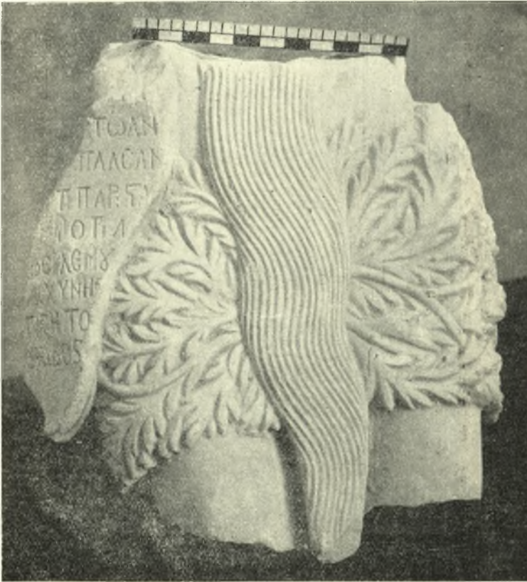
Εἰκ. 8. Κορμὸς ἀγάλματος τοῦ Ἁγ. Ὀνουφρίου ἐν τῷ Μουσείῳ Ἡρακλείου Κρήτης.

τεμαχίου μαρμάρου. (Εἰκ. 6, 7). Ἰδέαν σαφεστάτην τῆς ἀρχικῆς μορφῆς τοῦ ἀγάλματος παρέχει εὐτυχῶς εἰς ἡμᾶς μία εἰκὼν τοῦ Ἁγ. Ὀνουφρίου εὐρισκομένη εἰς τὸ Μουσεῖον Δ. Λοβέρδου. (Εἰκ. 8). Συμφώνως πρὸς ταύτην, ὁ Ἅγιος παρίστατο ὄρθιος μὲ γυμνὸν τὸ σῶμα, φέρων μόνον κλάδους περὶ τὴν ὀσφύν, καὶ μὲ μακρότατον γένειον φθάνον ὀλίγον κάτω τῶν γο-