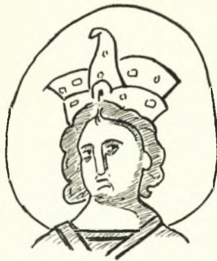
Εἰκ. 3. Ψηφιδωτὴ παράστασις τοῦ Σολομῶντος ἐν τῇ Μονῇ τῆς Χώρας.

ἀπεικόνισις τοῦ Βαπτιστοῦ εἰς τὴν σκηνὴν τῆς εἰς τὸν Ἄδην καθόδου παρουσιάζει πολλὰς ἀνὰ τοὺς αἰῶνας μεταλλαγὰς. Κατὰ τὸν 11ον αἰῶνα, ὅτε τὸ πρῶτον, ὡς εἶδομεν, ἐμφανίζεται εἰς τὴν σκηνὴν ταύτην, ὁ Προδρόμος φέρει ἔσωτερικὸν χιτῶνα πολὺπτυχον, ἡ δεξιὰ δὲ αὐτοῦ χεὶρ ἐξέρεχεται τοῦ ἱματίου, τὸ ὁποῖον ἀφήνει ἀνοικτὸν σχεδὸν ὀλόκλη-