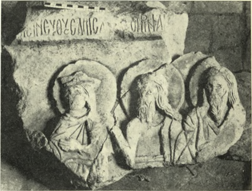
Εἰκ. 1. Τμήμα ἀναγλύφου τῆς εἰς τὸν Ἄδην καθόδου τοῦ Ἰησοῦ εὐρεθὲν ἐν Βερροία.

Ἀντιθέτως πρὸς τὰ ἐλεφάντινα καὶ τὰ ἐκ στεατίτου, τὰ μαρμάρινα εἰκονογραφικὰ γλυπτὰ, τὰ παριστάνοντα σκηνὰς ἐκ τῆς Παλαιᾶς καὶ Και-