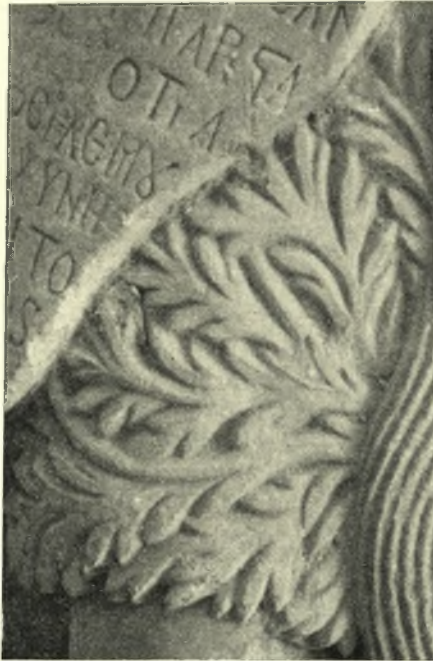
Εἰκ. 11. Κορμὸς τοῦ Ἁγ. Ὀνουφρίου: Λεπτομέρεια τοῦ φυλλώματος.

Ἡ σχεδὸν πλήρης ὁμοιότης τοῦ ἀπασχολοῦντος ἡμᾶς ἀγάλματος