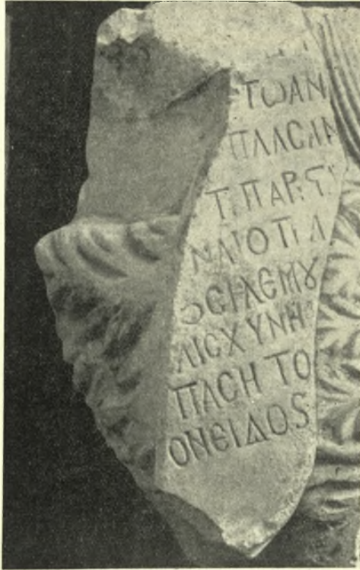
Εἰκ. 6. Κορμὸς τοῦ Ἁγ. Ὀνουφρίου : Τὸ εἰλητάριον.

τίαν ἔγκοπήν, περὶ ἧς ἀνωτέρω ἐγένετο λόγος. Φαίνεται, δηλαδή ὅτι ἡ δεξιὰ χεὶρ τοῦ ἀγάλματος ἦτο ἐκ χωριστοῦ τεμαχίου λίθου, τὸ ὁποῖον θὰ προσηρομόζετο ἐντὸς τῆς ἔγκοπῆς ταύτης.