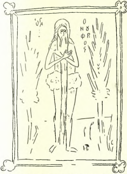
Εἰκ. 9. Ὁ Ἅγ. Ὀνούφριος. Μικρο- γραφαφία τοῦ κώδ. 16 τῆς Ἐθν. Βιβλιοθήκης Ἀθηνῶν.

Ἀπὸ τὴν βραχεῖαν αὐτὴν ἐπισκόπησιν τῶν διαφόρων παραλλαγῶν τῆς παραστάσεως τοῦ Ἁγ. Ὀνούφριου ἐξάγεται τὸ συμπέρασμα ὅτι ὁ τύπος τὸν ὁποῖον ἀντιπροσωπεύουσι τὸ ἐνταῦθα ἐξεταζόμενον ἄγαλμα