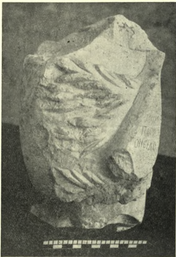
Εἰκ. 7. Κορμὸς τοῦ Ἁγ. Ὀνουφρίου. Πλαγία ὄψις.

Εἰς μίαν τοιχογραφίαν τῆς Καππαδοκίας 1 ἀπροσδιορίστου ἐποχῆς,