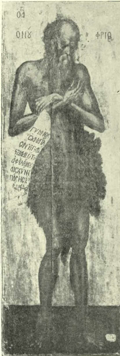
Εἰκ. 8. Ὁ Ἅγ. Ὀνούφριος. Εἰκὼν ἐν τῇ Μουσείῳ Δ. Λοβέρδου.

προβάτ τῆς Μολδαβίας 1 , ὁ Ἅγιος παρίσταται ἔχων τὰς χεῖρας πρὸ τοῦ στήθους μὲ τὰς παλάμιας πρὸς τὰ ἔξω. Παραδόξως ὁ ζωγράφος τῆς Καππαδοκίας παρέλιπε τὸ ἐκ φύλλων περιζώμα τοῦ Ἁγίου καὶ ἐβράχυνε κατὰ πολὺ τὸ μακρὸν γένειον, τὸ κυριώτερον δηλαδὴ χαρακτηριστικὸν αὐτοῦ. Τὰς ἰδιορρυθμίας ὅμως αὐτὰς δὲν βλέπομεν εἰς τὰς τοιχογραφίας τῆς Νόρβα Πιούλιτσα καὶ τῆς Μ. Ντομπροβάτ.