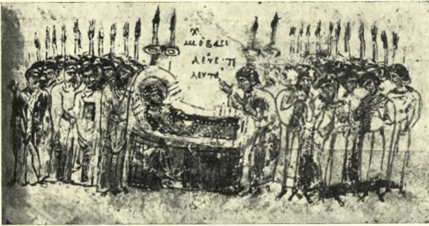
Εἰκ. 4. Ἡ πρόθεσις Μιχαὴλ τοῦ Β'.

Κατὰ τὸν Ψευδευσέβιον, περὶ τὸ σκίνωμα τοῦ ἐν τῇ αἰθούσῃ τῶν ιθ'. ἀκκουβίτων τοποθετηθέντος Μ. Κωνσταντίνου ἦναπτον φῶτα ἐπὶ χρυσοῦν σκευῶν θαυμαστὸν παρέχοντα θέαμα 4 , κατ' ἄλλας δὲ μαρτυρίας περὶ τὴν νεκρικὴν βασιλικὴν κλίνην ἐγένετο πάννουχος δαδουχία, ἦτοι πάννουχον ἄναμμα λαμπάδων συνοδευόμενον ὑπὸ ὄλονυκτίου ὕμνωδίας τῶν κληρικῶν 5 . (Εἰκ. 4.)