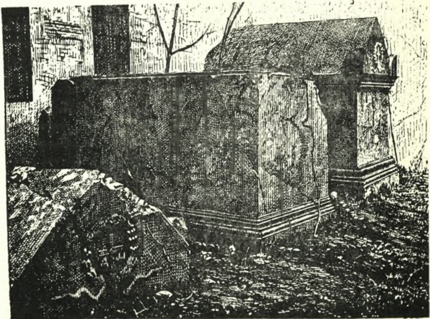
Εἰκ. 6. Βασιλικαὶ σαρκοφάγοι ἐκ πορφυρίτου. (G. Schlumberger, Un empereur byzantin au dixième siècle Nicéphore Phocas, p. 15.)