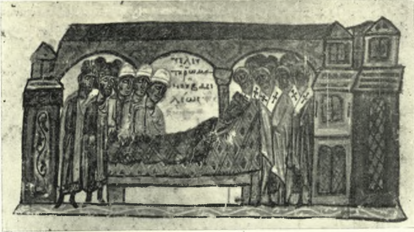
Εἰκ. 3. Ρωμαῖος ὁ Β' ἐπὶ τῆς νεκρικῆς του κλίνης. Ἐκ τοῦ χειρογράφου τοῦ Σκυλλίτου. (Hautes études).

ναῖκες ἐξέλυον 1 καὶ τὰς παρειὰς διὰ τῶν ὀνύχων ἤμυσσον 2 καὶ ἐπὶ τοῦ ἐδάφους ἐρρίπτοντο ἢ ἐκάθηντο 3 πενθικὴν φοροῦντες στολὴν καὶ συνεχῶς τὸν ἀποθανόντα ἀνακαλοῦμενοι 4 .