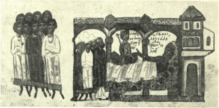
Εἰκ. 1. Ἡ τελευταῖα τοῦ βασιλέως Ἀλεξάνδρου, θεοῦ Κωνσταντίνου τοῦ Πορφυρογεννήτου.

ἀλλὰ καὶ τὰς παλάμας συνέκρουον 1 καὶ τὰς τρίχας τῆς κεφαλῆς αἱ γυ-