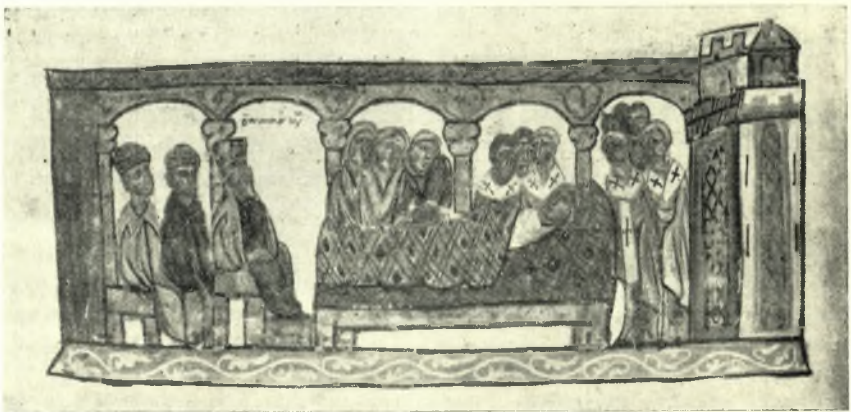
Εἰκ. 2. Ἡ τελευταία τῆς βασιλίσσης Ἑλένης, συζύγου Κωνσταντίνου τοῦ Πορφυρογεννήτου.

Ἐκ τοῦ χειρογράφου τοῦ Σκυλλίτη. (Hautes études C 1054).