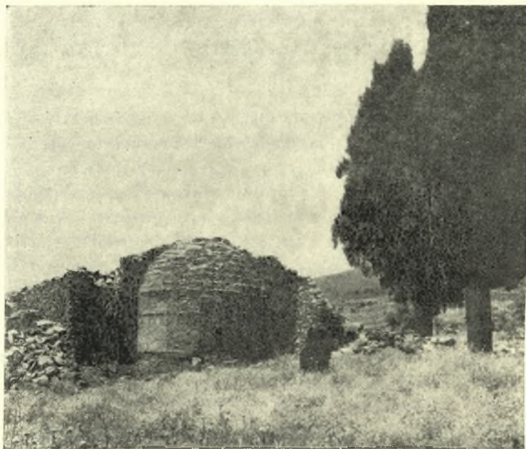
Εἰκ. 6. "Αποψὶς τοῦ ἡρειπωμένου ναοῦ τοῦ ἁγίου Νικολάου Βαθυρρεῖματος.

Ἡ στέγη τοῦ ναοῦ ἔχει καταπέσει πρὸ πολλοῦ, ἡ δὲ ἀψὶς αὐτοῦ ἔξωθεν ἔχει μίαν ζώνην κεραμοπλαστικὴν καὶ ἐν τῇ μέσῳ σταυρὸν διὰ πλίνθων ὀπτῶν.