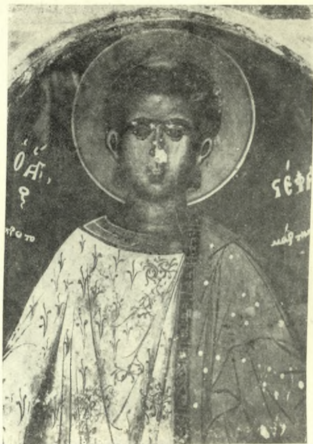
Εἰκ. 10. Εἰκὼν τοῦ ἁγίου Στεφάνου ἐν τῇ προσκομιδῇ τοῦ ἐν Βαθυρρεΐματι ναοῦ τοῦ ἁγίου Νικολάου.

βαιον, ἀπὸ τοῦ δευτέρου ἡμίσεος τοῦ ΙϚ' αἰῶνος, καὶ τῆς ἀβελτηρίας καὶ ἀμαθείας τῶν κατοίκων Ἀγλας δὲν ἐπεσκευάσθη ὁ ναὸς οὗτος, ἀλλ' ἀφέθη νὰ καταστραφῇ, ἀπολεσθεισὼν οὕτω λαμπρῶν τοιχογραφιῶν καὶ τῆς