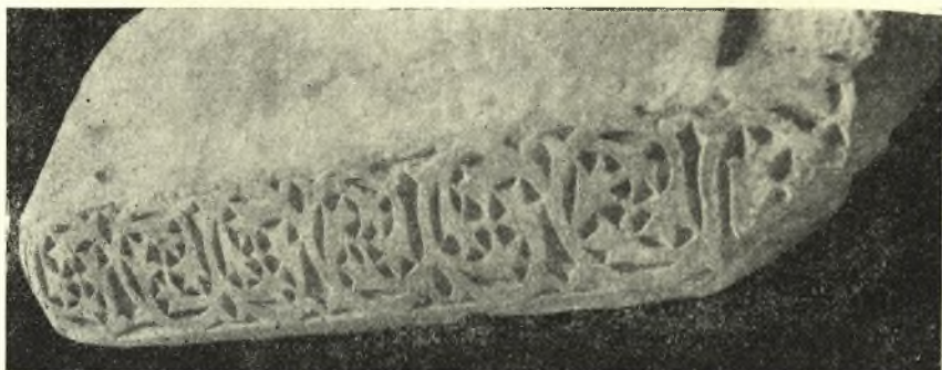
Εἰκ. 2. Κοσμήτης μετ' ἀναγλύπτου διακοσμήσεως.

Ἐκ Δέσιανης μετεφέρομεν εἰς τὴν ἐν τῷ ἡμιγυμνασίῳ Ἀγιᾶς ἀρχαιολογικὴν συλλογὴν κατὰ τὸ 1932 καὶ 1933 διάφορα γλυπτὰ ἀρχιτε-