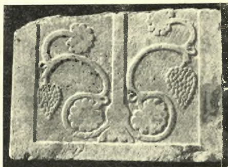
Εἰκ. 3. Παλαιοχριστιανικὸν θωράκιον ἐν τῷ Μουσείῳ Ἀγιᾶς.

1) (Ἀριθ. εὗρετ. Ἀγιᾶς 51) Θωράκιον κατὰ τὸ κάτω ἡμισυ σφζόμενον (ὑψ. 0,42, πλάτ. 0,59, πάχ. 0,09) μετὰ τῆς κάτω κεραίας σταυροῦ καὶ ἐλίκων κλιματίδος μετὰ σταφυλῶν ἀγκυροειδῶς (Εἰκ. 3).