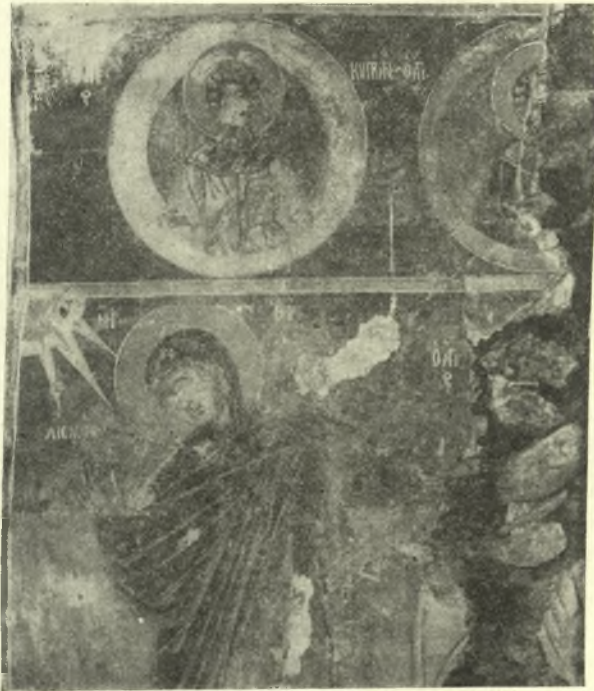
Εἰκ. 8. Δεξιὰ πλευρὰ τῆς κόγχης τοῦ ἐν Βαθυρρεῦματι ναοῦ τοῦ ἁγίου Νικολάου.

Ἐνωθεν δὲ τοῦ πρώτου ὀρθογωνίου (Πέτρου) εἶναι τρία στηθῶτα ἁγίων ἡμιεφθαρμένα καὶ ἄνωθεν τοῦ Τριμόρφου καὶ τῶν στρατιωτικῶν ἁγίων ὀρθογώνια, ἐν οἷς παρίστανται σκηναὶ ἐκ τοῦ βίου καὶ τῶν θαυμάτων τοῦ Ἁγίου Νικολάου.