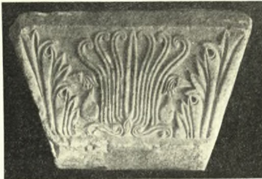
Εἰκ. 5. Παλαιοχριστιανικὸν κιονόκρανον ἐκ Δέσιανης ἀποκείμενον ἐν τῷ Μουσείῳ Ἀγιάς.

δύο ἐλίκων (ῦψ. 0,40, πλάτ. 0,57. πάχ. 0,34). (Εἰκ. 5).