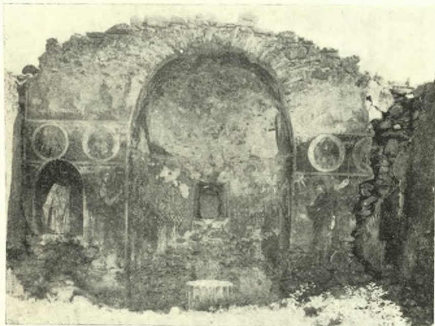
Εἰκ. 7. Ἀπομικ τοῦ ἐσωτερικοῦ τῆς ἀνατολικῆς πλευρᾶς τοῦ ἐν Βαθυρρεῦματι ναοῦ τοῦ ἁγίου Νικολάου.

Ἀριστερὰ εἰς τρεῖς ζώνας, ἔχουσι ζωγραφηθῆ ἄνω μὲν δλόσωμοι ἅγιοι ἡμιεφθαρμένοι, ἐν τῷ μέσῳ δέ, ἐντὸς κύκλων, ὁ Ἅγιος Ἀχίλλειος Λαρίσσης καὶ ὁ Ἅγιος Ἐπιφάνειος Κύπρου καὶ κάτω ὁ Εὐαγγελισμὸς τῆς Θεοτόκου, ὁ Ἀρχάγγελος Γαβριήλ, κρατῶν σκῆπτρον καὶ εὐλογῶν