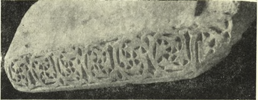
Εἰκ. 2. Κοσμητῆς μετ' ἀναγλύπτου διακοσμῆσεως.

Ἐκ Δέσιανης μετεφέρομεν εἰς τὴν ἐν τῷ ἡμιγυμνασίῳ Ἁγιάς ἀρχαιολογικὴν συλλογὴν κατὰ τὸ 1932 καὶ 1933 διάφορα γλυπτὰ ἀρχιτε-