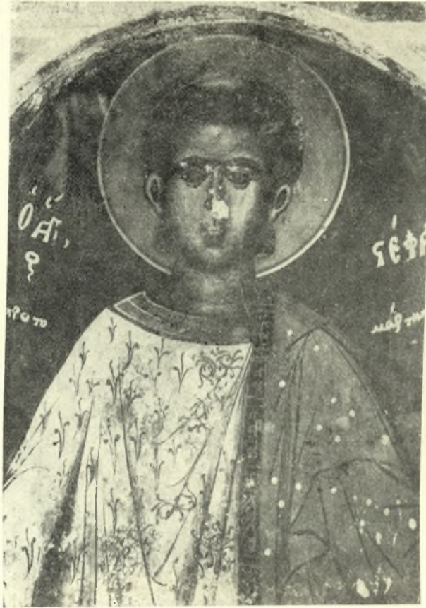
Εἰκ. 10. Εἰκὼν τοῦ ἁγίου Στεφάνου ἐν τῇ προσκομιδῇ τοῦ ἐν Βαθυρρεΐματι ναοῦ τοῦ ἁγίου Νικολάου.

βαιον, ἀπὸ τοῦ δευτέρου ἡμίσεος τοῦ ΙϚ' αἰῶνος, καὶ τῆς ἀβελτηρίας καὶ ἀμαθείας τῶν κατοίκων Ἁγιάς δὲν ἐπεσκευάσθη ὁ ναὸς οὗτος, ἀλλ' ἀφέθη νὰ καταστραφῇ, ἀπολεσθεῖσῶν οὕτω λαμπρῶν τοιχογραφιῶν καὶ τῆς