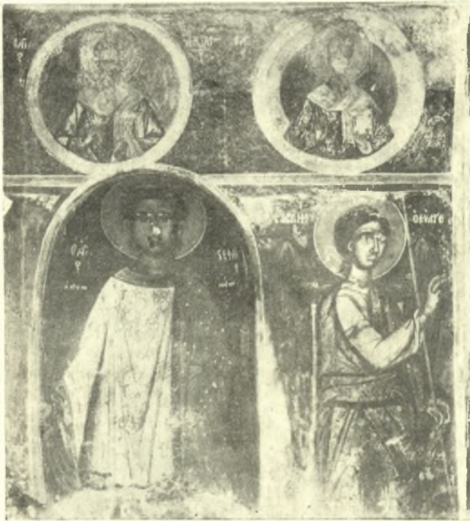
Εἰκ. 9. Εἰκόνες ἐν τῇ ἀριστερᾷ πλευρᾷ τῆς κόγχης τοῦ ἐν Βαθυρρεύματι ναοῦ τοῦ ἁγίου Νικολάου.

Ἐκ τῆς τοιχοδομίας τῶν δύο ναῶν τοῦ Βαθυρρεύματος ἐξάγεται ὅτι οἱ ναοὶ οὗτοι εἶναι Βυζαντινοί, ὑποστάντες βραδύτερον ἐπισκευάς,