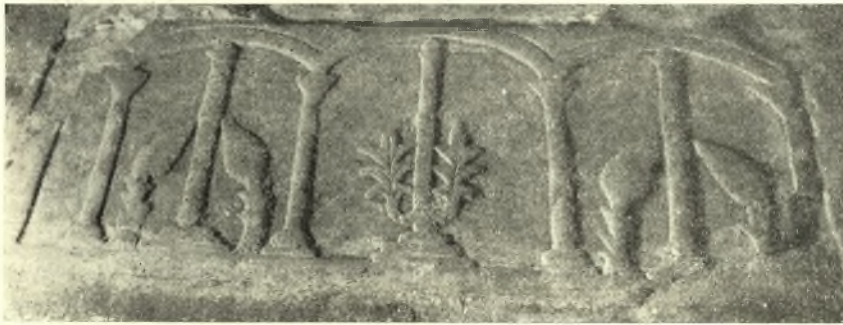
Εἰκ. 1. Ἡ ἑτέρα τῶν μακρῶν πλευρῶν Βυζαντινῆς σαρκοφάγου ἐντοιχισμένη ἐν τῷ δαπέδῳ τῆς ἐκκλησίας τῆς Παναγίας ἐν Δέσιανη.

Ἐπίσης ἐντὸς τοῦ ναοῦ, πρὸς τὸ τέμπλον, κατὰ δεξιὸν κλίτος, κεῖται, ἐρριμμένον τεμάχιον μαριάρινον, ἀποκεκρουμένον κατὰ τὴν μίαν ἄκρην, μήκους 1,40, πλάτους 0,60 περίπου, φέρον ἐπὶ τῆς μακρᾶς λοξοτιμῆ-