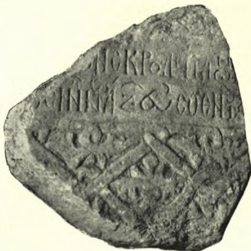
Εἰκ. 1. Τὸ νεοστὶ ἀνευρεθὲν τεμάχιον ἐκ τοῦ καλύμματος τῆς σαρκοφάγου τοῦ Γεωργίου Καπανδρίτου.

Εἰς προηγούμενον τόμον τῆς Ἑπετηρίδος ἐπραγματεύθημεν ἐκτενῶς περὶ τοῦ ἐν τῇ Μονῇ Βλαττάδων τῆς Θεσσαλονίκης φυλασσομένου καλύμματος τῆς σαρκοφάγου τῆς περικλειούσης ἄλλοτε τὸ σῶμα τοῦ νεοροῦ Γεωργίου, υἱοῦ τοῦ Σκουτερίου Καπανδρίτου 1 . Τοῦ ἐν λόγῳ μαρμάρου ἔλειπε τὸ ἀριστερὸν ἄκρον καὶ συνεπῶς δὲν εἶχομεν τὴν ἀρχὴν τῶν στίχων 1 καὶ 5 τοῦ ἐπιγράμματος, ὡς ἐπίσης καὶ μέρος τῆς ἐπιπεδογλύφου διακοσμῆσεως τῆς προσθίας πλευρᾶς. Ἡ κολόβωσις αὕτη τοῦ καλύμ-