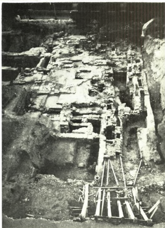
Ρόδος: α. Αί κάθοδοι πρὸς τὸ ἀποκαλυφθὲν ὑδρευτικὸν σύστημα εἰς τὴν πόλιν τῆς Ρόδου, β. Ἀνασκαφή παρὰ τὴν διασταύρωσιν τῶν ὁδῶν Βασιλ. Φρειδερίκης καὶ Ἐλευθερίου Βενιζέλου ΙΩ. ΚΟΝΤΗΣ