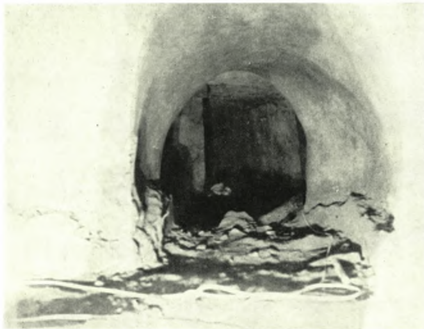
Ρόδος: α. Κάθοδος προς τὸ ἀποκαλυφθὲν ὑπόγειον ὕδρευτ. σύστημα, β. Ἑλληνιστ. κρήνη συνδεομένη πρὸς τὸ ἀποκαλυφθὲν ὕδρευτ. σύστημα, γ. Σηλαιϊώδης κατασκευὴ τοῦ ὑπογείου ὕδρευτ. συστήματος τῆς πόλεως Ρόδου