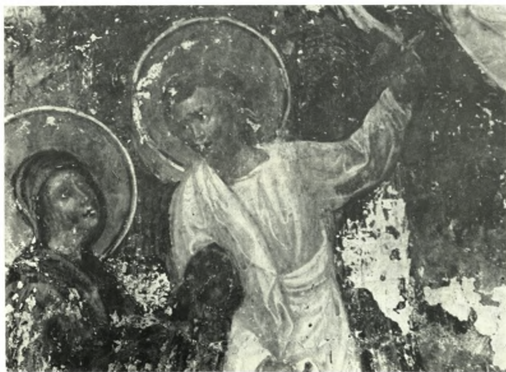
α. Ἐκκλησία Ὁδηγητρίας τῆς Λευκάδος. Νοτιοανατολική ὄψις μετὰ τὰς ἀναστηλωτικὰς ἐργασίας, β. Τοιχογραφία τῆς Ὁδηγητρίας. Λεπτομέρεια τῆς Ἀναλήψεως.