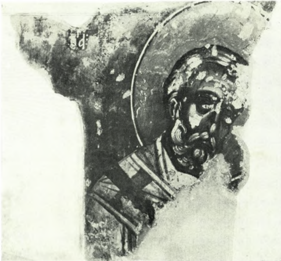
α. Α. πλευρά Ναού Ἁγ. Ἰάσονος καὶ Σωσιπάτρου, β. Προαύλιον τοῦ ἰδίου ναοῦ, γ. Τοιχογραφία ἱεροῦ τοῦ ναοῦ