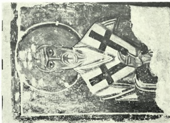
α. Τοιχογραφία ("Άγιος Ἀρσένιος) μετά τόν καθαρισμόν, β. Πρότον στρώμα μέ ἴχνη τοιχογραφίας