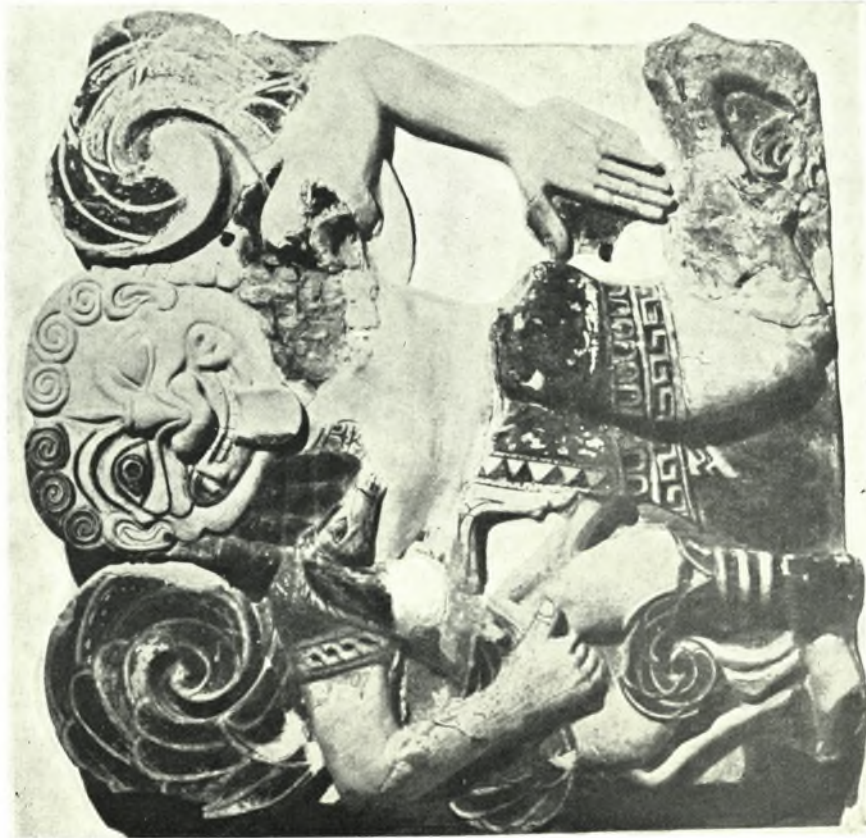
α. ἡ Γοργὴ τῶν Σαρακουσῶν, β. ἡ Γοργὴ τοῦ ἀετώματος τῆς Κερκύρας