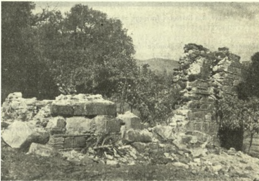
Εἰκ. 1. – Ἐρεῖπια Ἁγίας Μονῆς Δωρίδος.

Ἡ μνεία SPAW 1935, 697 σημ. 2 παρὰ τοῦ Klaffenbach τῆς χριστιανικῆς ἐπιγραφῆς ἐπὶ μαρμαρίνης πλακῶς (0,06 μ. × 0,50 μ., ὕψ. γραμ. 0,015 μ., διάστιχον 0,005 μ.) ἐντετειχισμένης εἰς τὴν ἀψίδα τοῦ Ἱεροῦ ης προ(εσβύτερος) ὑπὲρ σωτηρίας ἑαυτοῦ κα[ὶ τῆς] | [συμβίου]ν αὐτοῦ ἐκαλιέργησεν / μὲ ὠδήγησεν εἰς τὸν τόπον εὐρέσεώς της πρὸς ἐπίσκεψιν τῶν ἐρειπίων τοῦ Βυζαντινοῦ ναοῦ Ἁγία Μονὴ Κοκκίνου Δωρίδος εὐρισκομένης ἐπὶ λοφίσκου 100 μ. περ. ἄνω τῆς ἐθνικῆς ὁδοῦ Λιδωρικίου – Ναυπάκτου καὶ περὶ τὰ 2.600 μ. περ. ἐκεῖθεν τῆς μεγάλης ὁδικῆς γεφύρας τοῦ Κοκκίνου δυτικῶς τοῦ Στενοῦ.