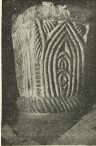
Εἰκ. 3. - Ἐν τῶν κιονοκράνων τῶν μέσων κιόνων.

Β) Ἔκτρα τμήματα. Τὰ πολὺ στενότερα ἄκρα τμήματα τοῦ τέμπλου φέρουσι καὶ αὐτὰ στενὴν πύλην ἐν τῷ μέσῳ (ἄνοιγμα προθέσεως 0,64, διακονικοῦ 0,72 μ.) πλαισιουμένην ἀπὸ δύο σταθμοὺς στεφομένους ἄνω διὰ τοῦ