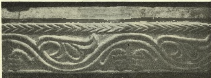
Εἰκ. 4. - Διακόσμησις τοῦ ἐπιστυλίου τοῦ μέσου τμήματος τοῦ τέμπλου.

Γ) Προσκυνητάρια . Ὡς καὶ ἀνωτέρω εἵπομεν οἱ χωρίζοντες τὰ τμήματα τοῦ τέμπλου τοῖχοι ἔφερον κατὰ τὰ μέτωπα αὐτῶν ἀνὰ ἓν προσκυνητάριον,