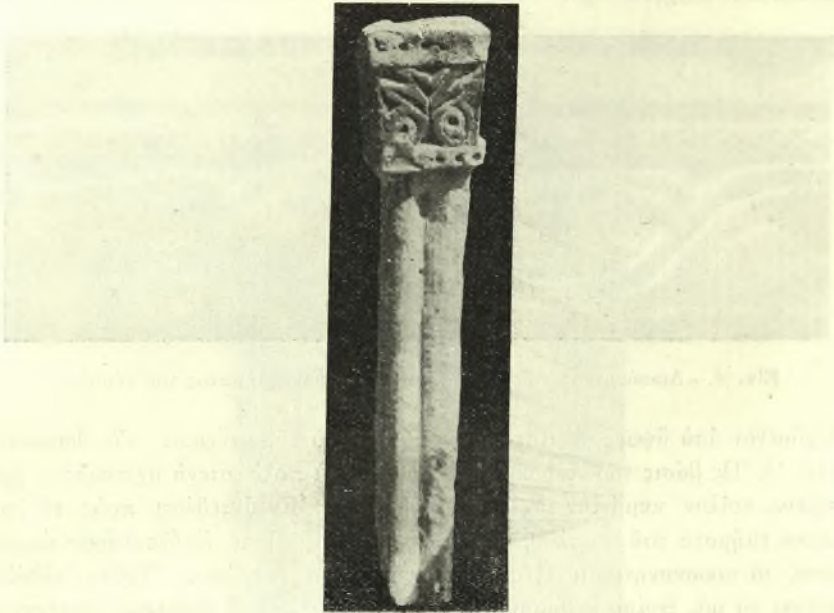
Εἰκ. 5. - Δίδυμος κιονίσκος τοῦ προσκυνηταρίου.

πτομένων κατά τι ὑψηλότερον τοῦ μέσου τοῦ ὕψους των διὰ κόμβου, δίκην ἡνωμένων λαμπάδων καὶ στεφομένων διὰ κιονοκράνου σχήματος ἀντεστραμμένης, ἐλαφρῶς κολούρου πυραμίδος (εἰκ. 5) κοσμουμένης εἴτε διὰ δύο ἀντινώτων τριφύλλων εἴτε διὰ πενταφύλλου ἀνθεμίου (εἰκ. 5). Ἐπὶ τῶν κιονοκράνων τούτων πατεῖ ὑπερυψωμένον τόξον συνολικοῦ ὕψους 0,15 καὶ τομῆς