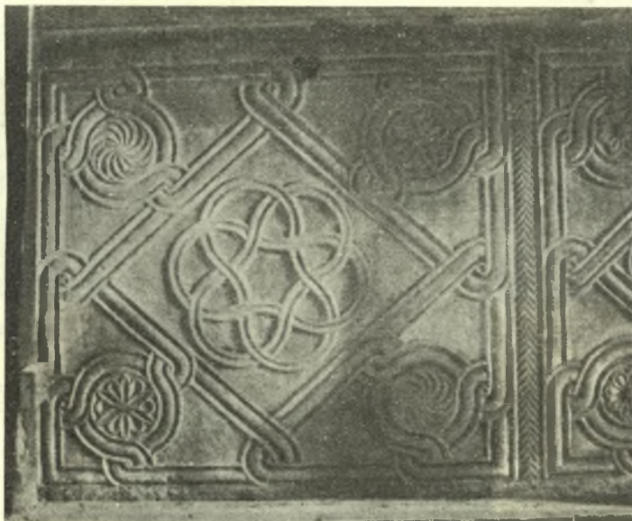
Εἰκ. 2. - Τὸ πρὸς βορρᾶν θωράκιον τοῦ μέσου τμήματος τοῦ τέμπλου.

νικος (;). Ἐξ ἑτέρου τὰ μεγάλα, μονοκόμματα θωράκια κοσμοῦνται ἕκαστον διὰ ρόμβου ἐγγεγραμμένου ἐντὸς ὀρθογωνίου πλαισίου (εἰκ. 1 καὶ 2). Οἱ τε ρόμβοι καὶ τὰ πλαίσια σχηματίζονται διὰ τριμερῶν ταινιῶν, συνάπτονται δὲ διὰ κόμβων πρὸς μικροὺς κύκλους πληροῦντας τὰ τέσσαρα γωνιαῖα τρίγωνα καὶ περιβάλλοντας ἑναλλάξ μικρὸν ρόδακα ἢ πυροστροβίλον (εἰκ. 2). Τέλος