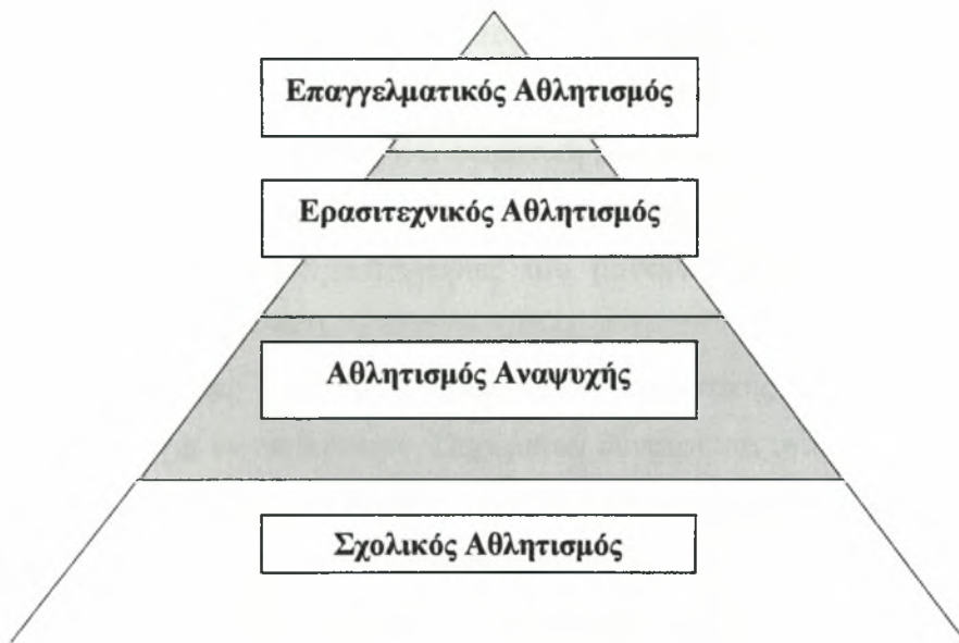
Σχήμα 1: Μοντέλο διοίκησης αθλητικής αναψυχής. (Leisure Sport Management Model: Recreational Sport Management, p.6)

Ο Mull et al. (1997), χωρίζουν τα αθλητικά προγράμματα αναψυχής στον εκπαιδευτικό αθλητισμό, στον αθλητισμό αναψυχής, στον ερασιτεχνικό αθλητισμό και στον επαγγελματικό αθλητισμό. Τα δύο πρώτα κομμάτια στοχεύουν στην διασκέδαση και στη υγεία των συμμετεχόντων ενώ τα δύο τελευταία στην διασκέδαση, στη θέαση, στην ανταγωνιστικότητα. Το μοντέλο αυτό οργανώθηκε σε σχήμα πυραμίδας (Σχήμα 1), με βάση τον αριθμό των αθλουμένων. Στην κορυφή βρίσκεται ο επαγγελματικός αθλητισμός ο οποίος έχει την μικρότερη συμμετοχή ακολουθεί ο ερασιτεχνικός αθλητισμός με περισσότερους αθλητές, ο αθλητισμός για αναψυχή με πλήθος συμμετεχόντων και τέλος, ο σχολικός αθλητισμός με την μερίδα του λέοντος όσον αφορά στη συμμετοχή. Αυτή η δομή αφορά κυρίως τις Ηνωμένες Πολιτείες.