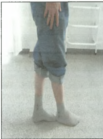
Σχήμα 6: Τοποθέτηση του ενός ποδιού μπροστά από το άλλο και διατήρηση της θέσης