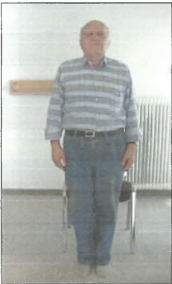
Σχήμα 1 : Ορθοστάτηση και διατήρηση της θέσης

Κατά την διάρκεια των δοκιμασιών αυτών ο εξεταστής παρατηρούσε τον εξεταζόμενο, τον τρόπο δηλαδή με τον οποίο εκτελούσε την δραστηριότητα και σε κάποιες άλλες χρονομετρούσε τον χρόνο και τον τρόπο της εκτέλεσης. Ο εξεταστής αξιολογούσε με μια πενταβάθμια κλίμακα εύρους από 0 έως 4 τα χαρακτηριστικά των δοκιμασιών. Η συνολική ολοκλήρωση της εφαρμογής του τεστ απαιτούσε χρονική διάρκεια 15-20 λεπτών για κάθε εξεταζόμενο.