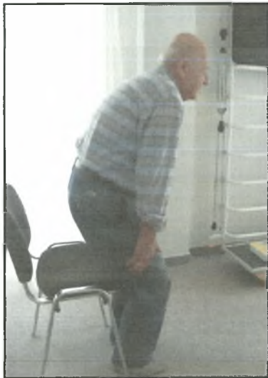
Σχήμα 2: Έγερση