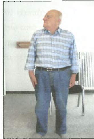
Σχήμα 5 : Όρθια θέση στροφή και κοίταγμα πίσω πάνω από τον αριστερό και δεξιό ώμο