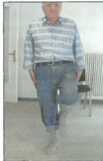
Σχήμα 7: Στάση στο ένα πόδι και διατήρηση της θέσης