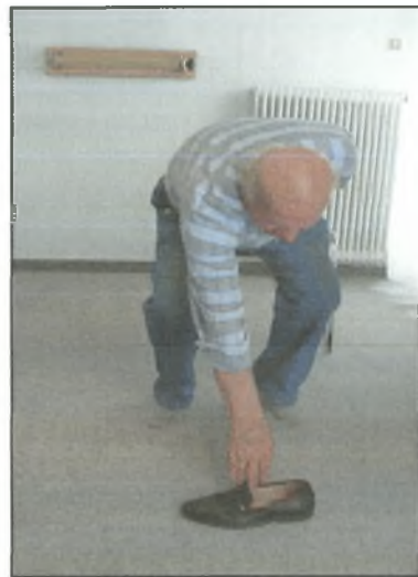
Σχήμα 3: Άρση αντικειμένου από το έδαφος