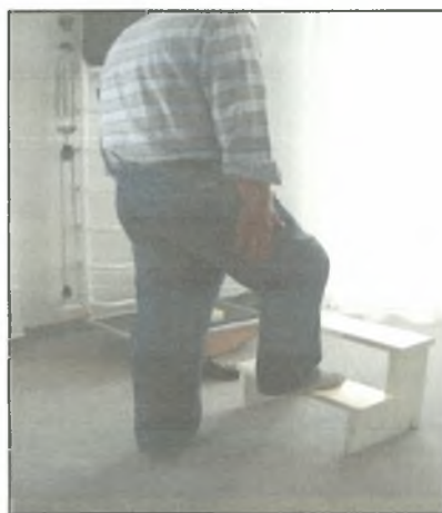
Σχήμα 8: Εναλλάξ τοποθέτηση του ποδιού σε πάγκο ή υποπόδιο