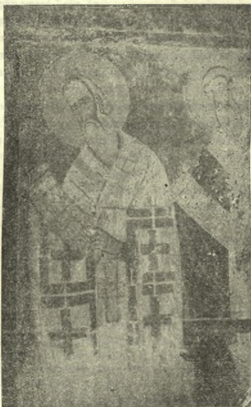
Εἰκ. 1.—Τοιχογραφία τοῦ ναοῦ τῶν Καλυβίων Κουβαρά.

Ὅλιγον ἔξω τοῦ χωρίου τῶν Καλυβίων Κουβαρά τῆς Λαυρεωτικῆς ὑπάρχει μικρὸς βυζαντινὸς ναὸς τοῦ 12ου ἢ 13ου αἰ. τιμώμενος εἰς μνήμην τοῦ Ἁγίου Πέτρου καὶ διασώζων ἀρετὰς τοιχογραφίας. Μεταξὺ τούτων ὑπάρχει