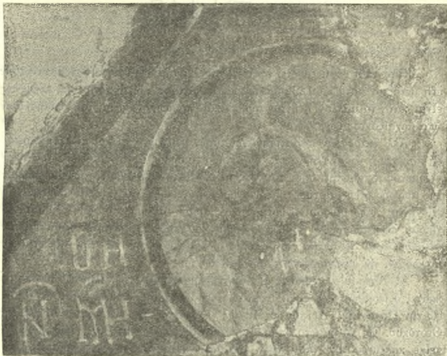
Εἰκ. 2.—Τοιχογραφία τῆς Σπηλιᾶς Πεντέλης.