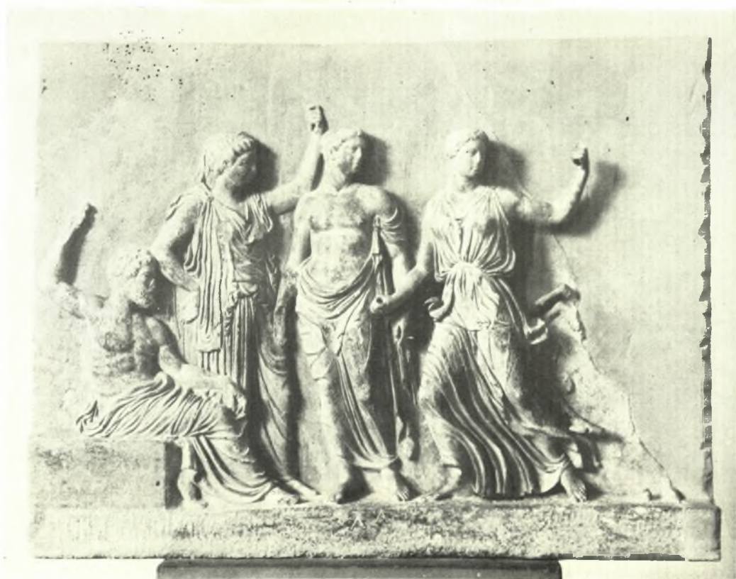
Βραυρών: α. Τμήμα πηλίνου ειδωλίου Ἄρτεμιδος, β. Ἀνάγλυφον με παράστασιν Διός, Λητοῦς, Ἀπόλλωνος καὶ Ἄρτεμιδος