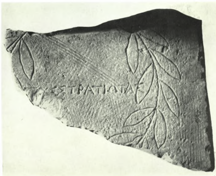
Μουσείον Ραμνουντος: α. Ἐνέπιγραφον θραύσμα ὑπ' ἀριθ. 2, β. Χαλκοῦν νόμισμα τοῦ Πτολεμαίου Β' τοῦ Φιλαδέλφου, περισυλλεγὲν ἐκ τοῦ ἱεροῦ τῆς Νεμέσεως, γ. Ἐνέπιγραφον θραύσμα ὑπ' ἀριθ. 3