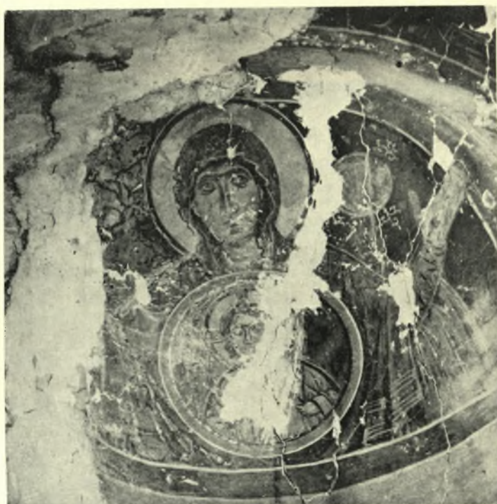
Μεσσηνία. Τριφυλία: α. Έγχάρακτα ὄστρακα Κόκλας, β. Προϊστορικά ὄστρακα Κόκλας, γ. Τοιχογραφία ἀψίδος ἱεροῦ ἐκκλησιᾶς Ἄετοῦ