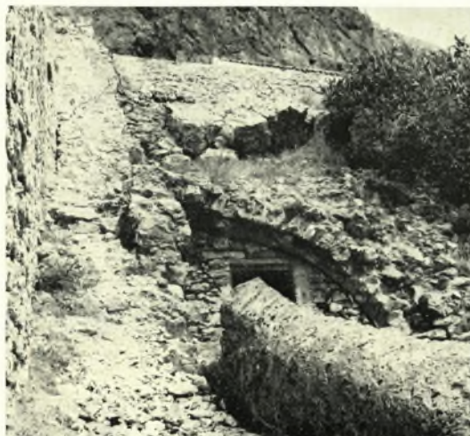
Μονεμβασία: α - β. Τμήμα τῶν τειχῶν εἰς τὴν ἀριστερὰν πλευρὰν τῆς κεντρικῆς πύλης πρὸ καὶ μετὰ τὰς ἐργασίας, γ - δ. Πύργος ἀριστερὰ τῆς κεντρικῆς πύλης πρὸ καὶ μετὰ τὰς ἐργασίας, ε. Τμήμα τοῦ τοίχου στηρίξεως κλίμακος φερούσης εἰς τὴν στέγην τῆς πύλης, ζ. Τοῖχος παρὰ τὴν κλίμακα