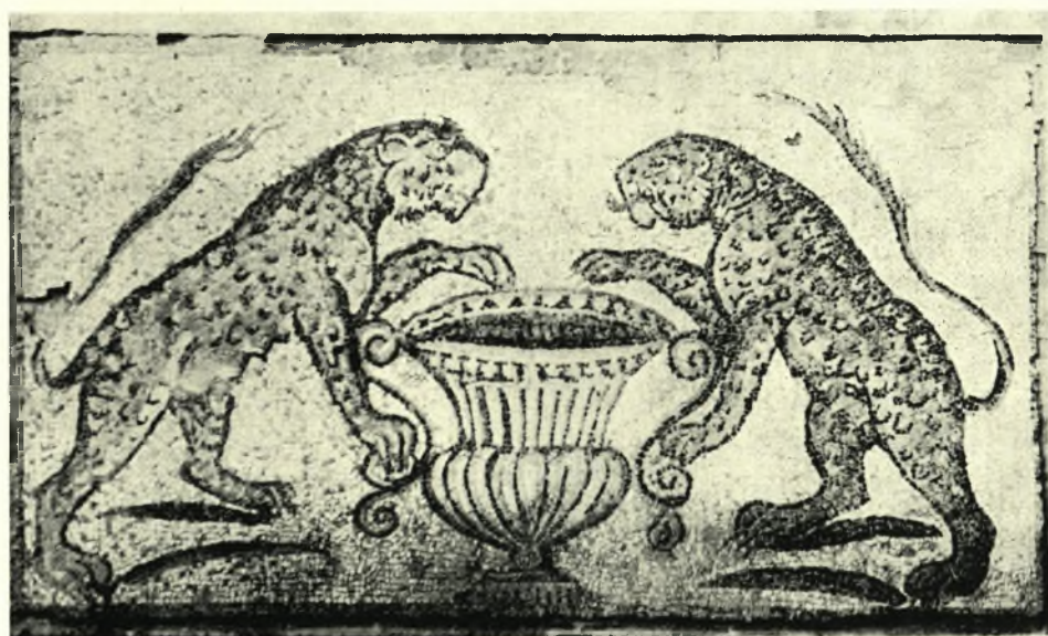
Σπάρτη: α. Μωσαϊκὸν Μεδούσης με ἐμφανὲς τὸ κρασπεδόρειθρον τοῦ πεζοδρομίου, β. Οἱ πάνθηρες ἐκ τῆς περιοχῆς τοῦ ψηφιδωτοῦ τῆς Μεδούσης