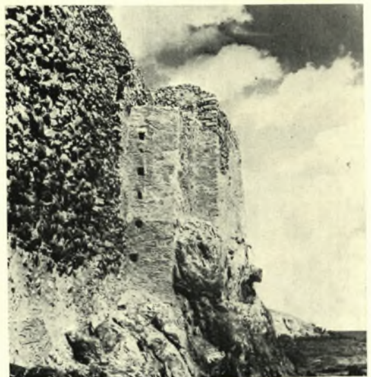
Μονεμβασιά: α - β. Ἡ παρά τὸ «Πορτέλο» θέσις πρὸ καὶ μετὰ τὰς ἐργασίας, γ - δ. Πύργος ὑπὸ τὴν Παναγίαν τὴν Χρυσαφίτισσαν πρὸ τῶν ἐργασιῶν καὶ μετὰ τὴν στερέωσιν