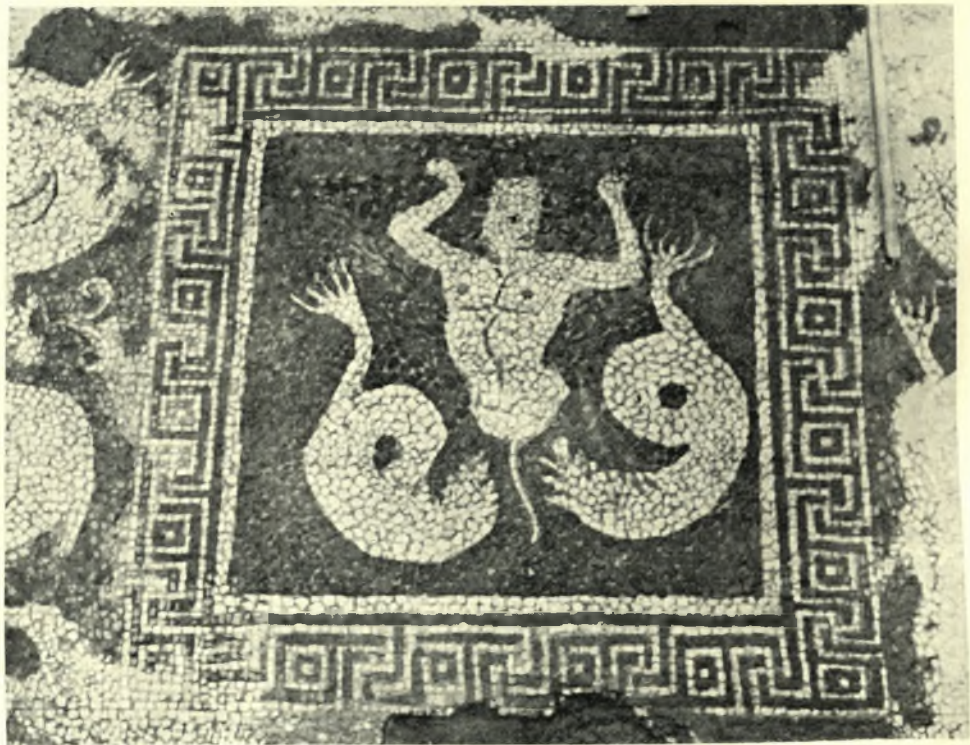
Σπάρτη: α. Γενική άποψις του ψηφιδωτού τής Μαγούλας, με Τρίτωνα καί διάφορα άλλα θέματα, β. Ἡ κεντρική παράστασις του ψηφιδωτού τής Μαγούλας