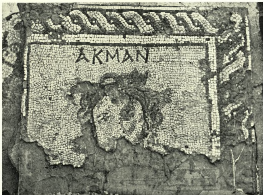
Σπάρτη: α. Ἡ Σαπφώ, β. Ὁ Ἄλκμαν