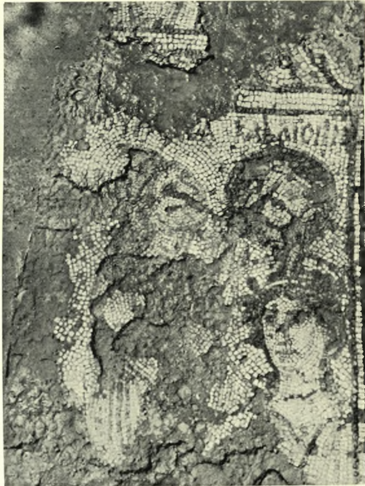
Σπάρτη: α. Μέδουσα· σχέδιον πρόχειρον, β. Σχέδιον πρόχειρον τῆς θέσεως τῶν μωσαϊκῶν Μεδούσης, πανθήρων· παράστασις ἀπὸ τὴν Ἰλιάδα, γ. Τὸ σωζόμενον τμήμα τοῦ ψηφιδωτοῦ τῶν Μουσῶν