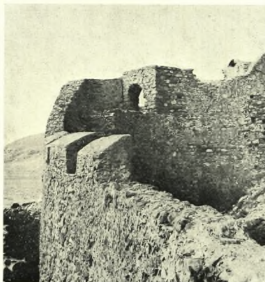
Μονεμβασία: α - β. Τμήμα παρά την μικράν πύλην κατά τήν στερέωσιν καί μετά ταύτην, γ. Τò στερεωθὲν παρά τήν θέσιν «Πορτέλο» τμήμα τῶν τειχῶν μέ τὰς ὀδοντωτάς ἀπολήξεις, δ. Στερέωσις ὀδοντωτῶν ἀπολήξεων τῶν τειχῶν