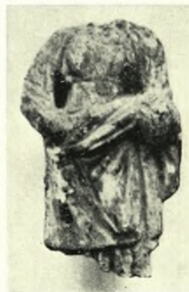
Τυχαῖα εὐρήματα περιοχῆς Κορινθίας: α. Ἐπιτύμβιον ἀνάγλυφον τῶν τελευταίων ἐλληνιστικῶν ἢ τῶν πρωϊμῶν ρωμαϊκῶν χρόνων, β. Ἀναθηματική(;) πηλίνη στήλη τῶν ἀρχῶν τοῦ Ε π.Χ. αἰῶνος, γ. Ἀγαλμάτιον γυναικὸς