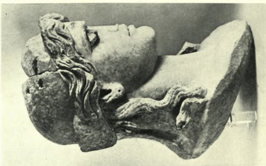
Τυχαία εύρηματα περιοχής Κορινθίας: α. Δεξιά πλευρά της έπομένης κεφαλής, β. Κεφαλή 'Αθηνάς εξ άκρολίθου άγάλματος, γ. 'Οπισθία πλευρά της ίδιας κεφαλής