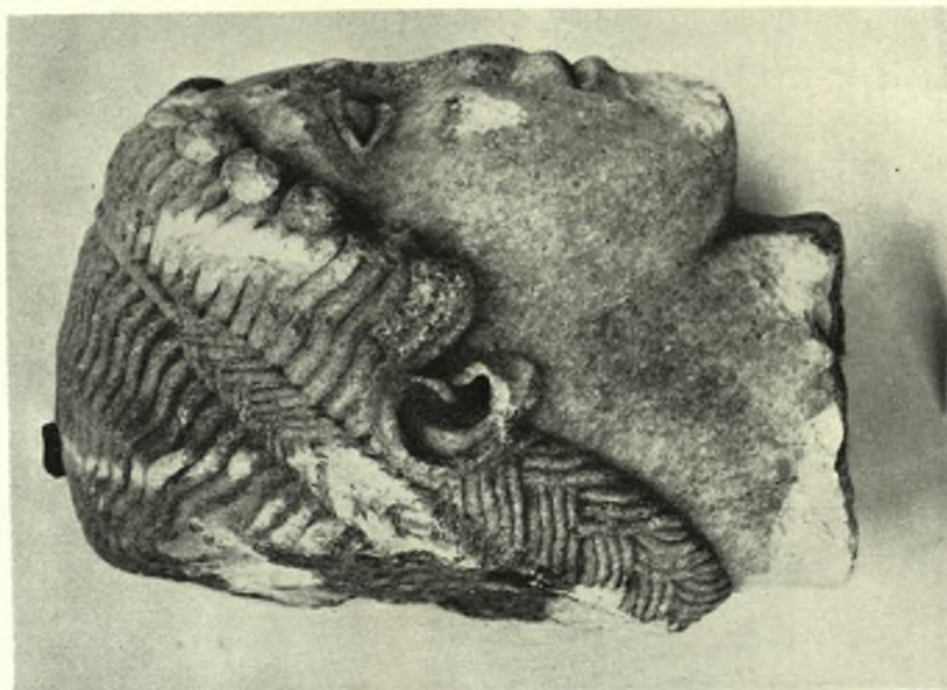
Τυχαία εσρήματα περιοχής Ἀργολιδοκορινθίας: α. Κεφαλή κούρου τῶν ἀρχῶν τοῦ Ε π.Χ. α.ι., β. Ἀρκαδικὸν ἀγαλμάτιον τοῦ τέλους τῆς ἀρχαϊκῆς ἐποχῆς, γ. Νίκη ἐν πτήσσει. Ἑλληνιστικὸν ἔργον ἐπὶ τῇ βάσει παλαιότερων προτύπων