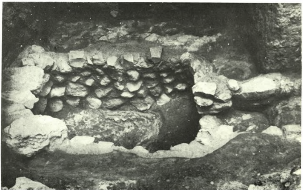
Kerameikos: a. Beigaben aus dem Kindergrab HW 213, b. Früher Grabbau HW 5