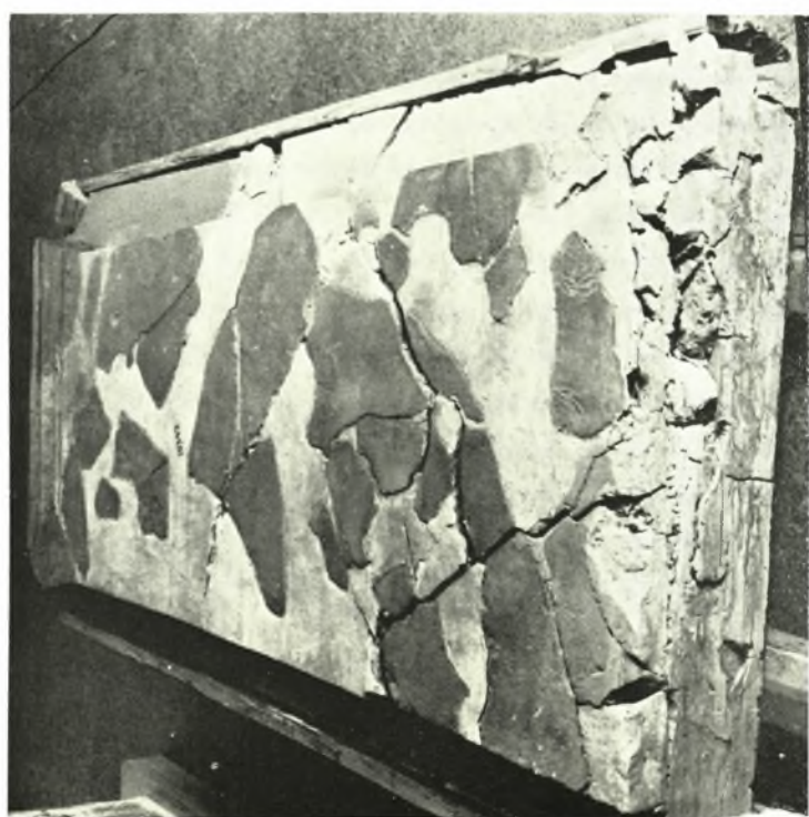
Ἐθνικὸν Ἀρχαιολογικὸν Μουσεῖον. Ἐπιγραφικὴ Συλλογή: α. Ἡ Ε.Μ. 10342 ἐπιγραφὴ ὡς ἦτο πρότερον, β. Τὰ τεμάχια τῆς Ε.Μ. 10342 ἐπιγραφῆς, ὡς ταῦτα συνδέονται μεταξὺ των μὲ ράβδους ὀρειχάλκου, γ. Ἡ Ε.Μ. 10342 ἐπιγραφὴ ὡς αὕτη ἀπεκατεστάθη