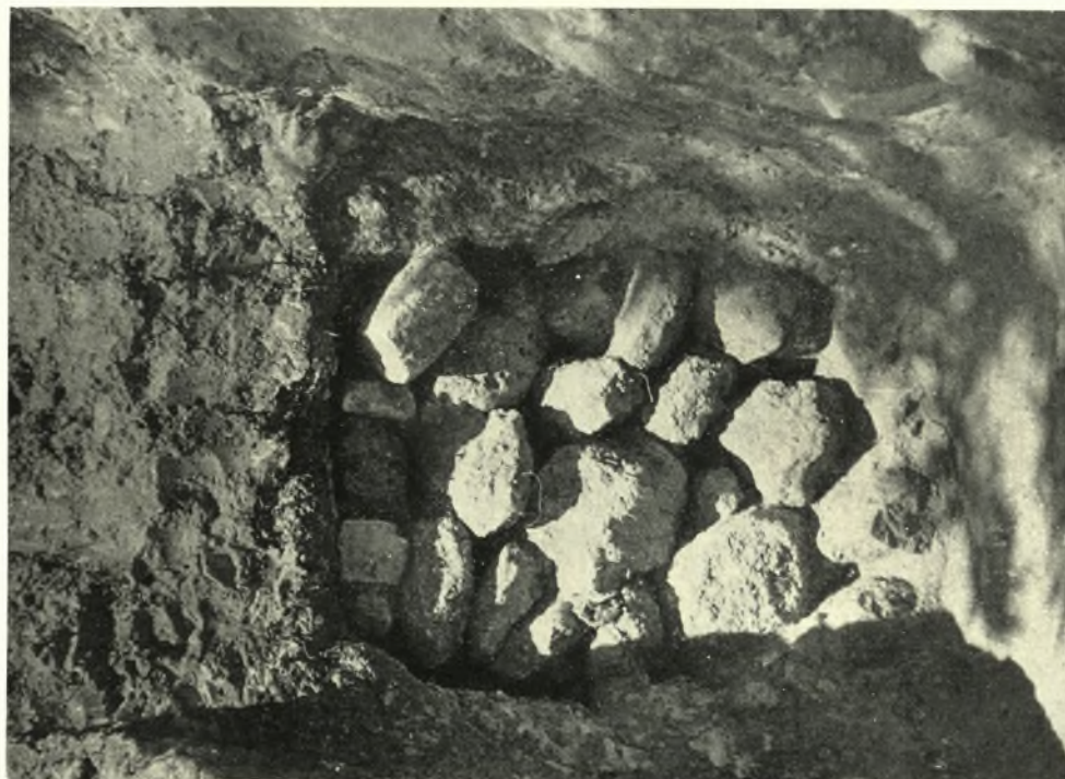
Ἀρχάνες : α-β. Ἡ χτισμένη πόρτα τοῦ τάφου πρὶν καὶ μετὰ τὴν καθάρωσιν τῶν λίθων