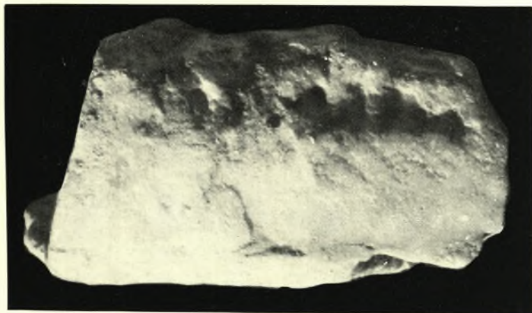
Ἐπιγραφικὸν Μουσεῖον: α. Ἀριστερὸν τοῦ τεμαχίου μαρμάρου Ι τῆς ἐπιγραφῆς ἐν IG II 2 3897, β. Δεξιὸν τοῦ τεμαχίου μαρμάρου VI τῆς ἐπιγραφῆς ἐν IG II 2 3897