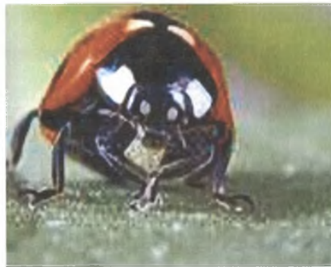
Εικόνα 5. Coccinella septempunctata , φυσικός εχθρός των αφίδων