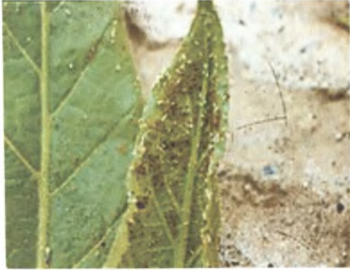
Εικόνα 4. Προσβολή φύλλων καπνού από αφίδες