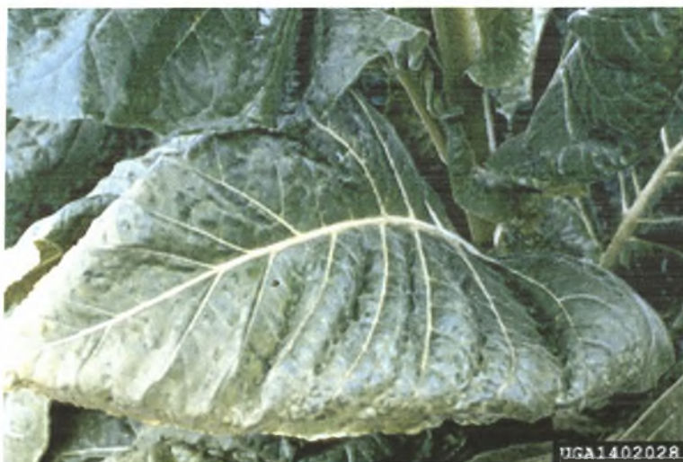
Εικόνα 9. Φυτό καπνού προσβεβλημένο από τον ιό PVY

Συνηθισμένες ανατομικές και φυσιολογικές ανωμαλίες που διαπιστώνονται στα μολυσμένα από τον ιό φυτά, είναι η μείωση της χλωροφύλλης, ο αυξημένος ρυθμός αναπνοής, η εμφάνιση εγκλείστων στα μολυσμένα κύτταρα και κρύσταλλοι στον πυρήνα, που δεν υπάρχουν στα αμόλυντα φυτά. Επίσης, υπάρχουν ιοσώματα στην επιδερμίδα, στο κυτταρόπλασμα και στο κενοτόπιο του κυττάρου και τα μιτοχόνδρια συχνά περιβάλλονται από ίνες με διάμετρο από 9-10nm (Buchen & Osmond 1987).