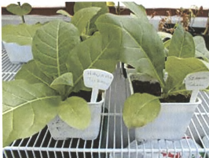
Εικόνα 10. Μεταφτευμένα φυτά καπνού με ταμπελάκι σήμανσης