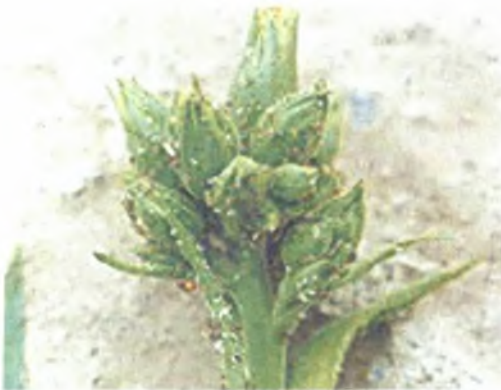
Εικόνα 3. Προσβολή «φούντας» από αφίδες

στασία των φυτών από προσβολές αφιδομεταδιδόμενων ιών που προκαλούν ποσοτική και ποιοτική υποβάθμιση του τελικού προϊόντος (Paradopoulos et.al. 2004). Πειραματική μελέτη των Paradopoulos et.al. (2004), έδειξε ότι τα νέα, φιλικά προς το περιβάλλον εντομοκτόνα (imidacloprid, acetamiprid, py-metrozine, thiamethoxam), προστατεύουν την καλλιέργεια του καπνού για μεγάλο χρονικό διάστημα. Μάλιστα η αποτελεσματικότητά τους βελτιώνεται όταν γίνεται εφαρμογή υπερμικρού όγκου (U.L.V.) με χρήση ηλεκτροστατικού ψεκαστήρα. Επίσης, η χρήση εντομοκτόνων ουσιών (π.χ. imidacloprid, thiamethoxam) ταυτόχρονα με το νερό εγκατάστασης της φυτείας μετά τη μεταφύτευση, αποδείχθηκε ικανοποιητική εναντίον των αφίδων για μεγάλα χρονικά διαστήματα. Τα βιοεντομοκτόνα (π.χ. Verticillium lecanii ) είναι πολλές φορές αποτελεσματικά στην καταπολέμηση των αφίδων, αλλά μόνο σε ιδιαίτερες συνθήκες, όπως όταν επικρατούν υψηλά επίπεδα σχετικής υγρασίας. Άλλες πρακτικές, που μπορούν να χρησιμοποιηθούν στα πλαίσια της ολοκληρωμένης αντιμετώπισης, παρέχοντας μάλιστα ικανοποιητική προστασία από τις αφίδες, είναι η εφαρμογή του συστήματος επίπλευσης (floating system) με καλυμμένα ανοίγματα στα σπορεία και η κάλυψή τους με ειδικά δίκτυα εντομοστεγανότητας.