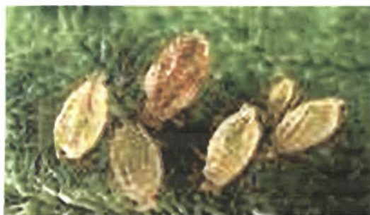
Εικόνα 4. Αποικία ρόδινου κλώνου αφίδας