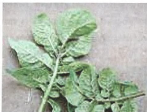
Εικόνα 6. Φύλλα πατάτας προσβεβλημένα από τον ιό PVY

Ο κύκλος των ξενιστών περιορίζεται κυρίως στην οικογένεια Solanaceae, παρόλο που κάποια είδη των οικογενειών Amaranthaceae, Chenopodiaceae, Compositae και Leguminosae είναι επίσης ευπαθή (Perez et al. 1995). Ο PVY μολύνει κυρίως τα φυτά της οικογένειας Solanaceae, όπως καπνός, ντομάτα, πιπεριά και πατάτα και έχει σημαντική επίδραση στην πατάτα και σε άλλα φυτά της οικογένειας, προκαλώντας ποιοτικές αλλά και ποσοτικές ζημιές. Έχουν αναφερθεί απώλειες σοδειάς της τάξεως του 10-80% στην πατάτα και μαζί με τον ιό του καρουλιάσματος των φύλλων της πατάτας και με τον ιό X της πατάτας λογοδοτούν για ολοκληρωτική απώλεια της παραγωγής. Τέλος, ζιζάνια όπως το Solanum atropurpureum και άλλα είδη Solanum μπορούν επίσης να μολυνθούν από τον ιό και να ενεργούν ως σημαντικές πηγές διατήρησης και μετάδοσής του (Walsh et al. 2000).