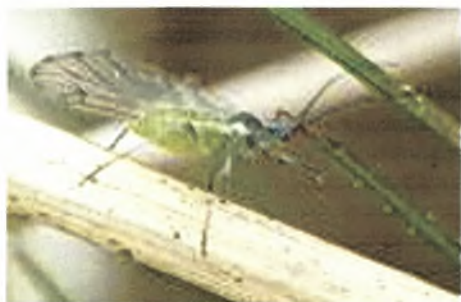
Εικόνα 2. Πτερωτό άτομο αφίδας

Με την ποικιλία μορφών (όπως παρθενογενετικά θυληκά, ωτόκα κ.α.), τρόπου διαχείμασης, εναλλαγή ξενιστή και τροφική εξειδίκευση που παρουσιάζουν, οι αφίδες μπορούν να αποφεύγουν τις δυσμενείς για την επιβίωσή τους συνθήκες και να διαιωνίζονται (Sharoshnikov 1985).