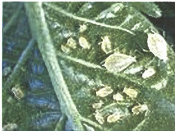
Εικόνα 1. Αποικία αφίδων

Η αφίδα M. persicae είναι εξαιρετικά πολυφάγο είδος και προσβάλλει περισσότερα από 400 είδη φυτών σε όλες τις ηπείρους. Από τα καλλιεργούμενα φυτά προσβάλλει είδη των οικογενειών Rosaceae, Solanaceae, Malvaceae, Compositae, Chenopodiaceae, Umbelliferae, Papilionaceae, Cruciferae. Προσβάλλει αρκετές καλλιέργειες όπως: καπνός, πατάτα, ντομάτα, μαρούλι, καρότο, κουκιά, τεύτλα, σπανάκι, λάχανο κ.α. Γεννά τα χειμερινά αυγά κυρίως στη ροδακινιά ( Prunus persica L.) καθώς και σε άλλα πυρηνόκαρπα όπως P. nigra , P. tanella , P. serotina όπως επίσης και σε υβρίδια της ροδακινιάς και της αμυγδαλιάς (Τσανακάκης και Κατσόγιαννος 2003).