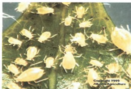
Εικόνα 3. Αποικία πράσινου κλώνου αφίδας