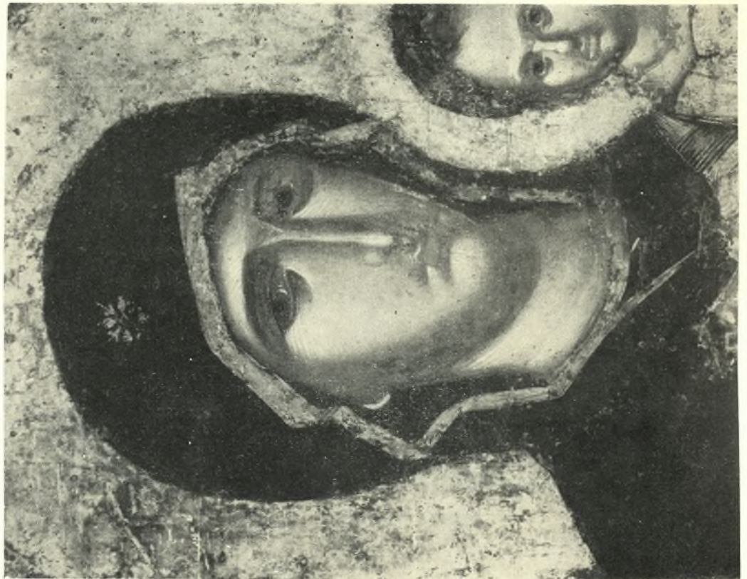
Ἀμφιπρόσωπη εἰκόνα Ρόδου. Λεπτομέρειες Πίνακος 31: α. Ἡ Παναγία, β. Ὁ Χριστός