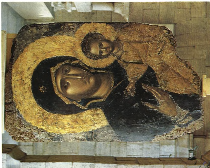
Ἄμμετροσόπη εἰκόνα Ρόδου : α - β. Ἡ Ὀδηγήτρια καὶ λεπτομέρεια αὐτῆς