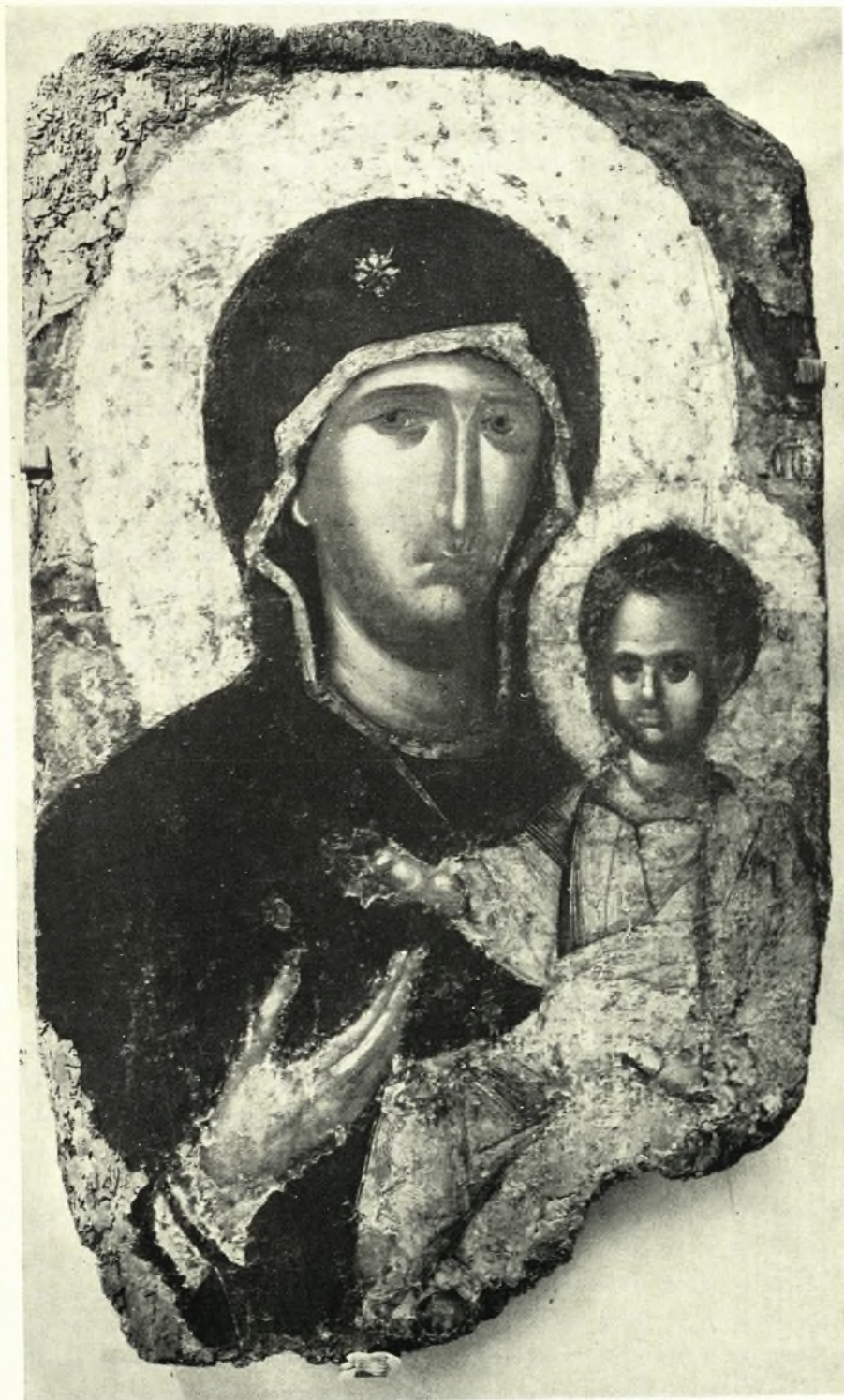
Ἀμφιπρόσωπη εἰκόνα Ρόδου: Ὁδηγήτρια