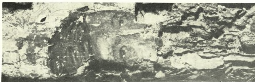
Ἀμφιπρόσωπη εἰκόνα Ρόδου. Λεπτομέρειες τῆς παραστάσεως τοῦ Πι ν. 34: α. Τὸ κεφάλι τοῦ Χριστοῦ, β. Τὸ κεφάλι τοῦ Ἁγ. Νικολάου, γ. Ἡ Παναγία