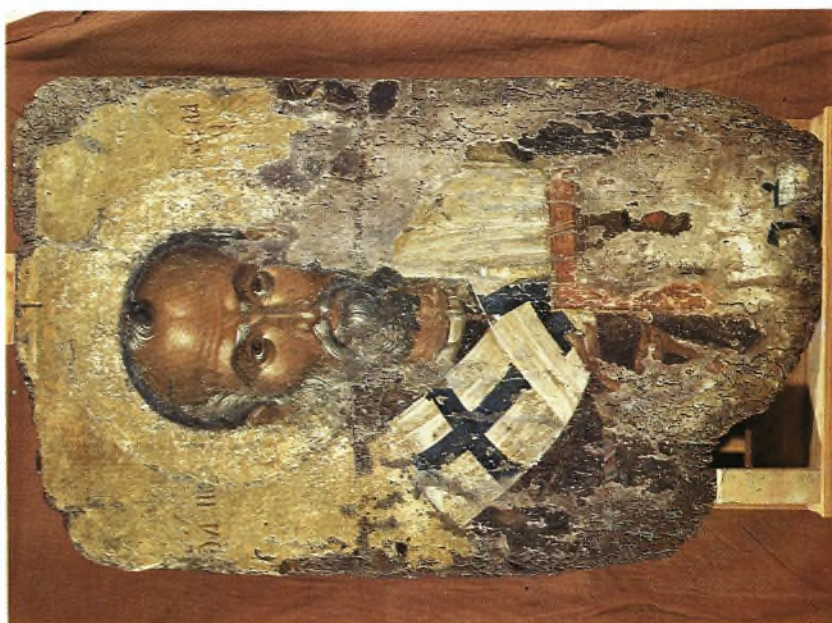
Ἀμφιπρόσωπη εἰκόνα Ρόδου : α - β. Ὁ Ἅγιος Νικόλαος καὶ λεπτομέρεια αὐτοῦ