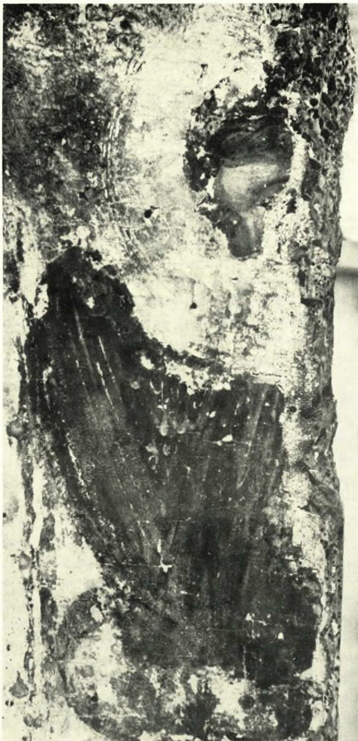
Ἀμφιπρόσωπη εἰκόνα Ρόδου. Λεπτομέρεια τῆς Ὁδηγήτριας: Ὁ Ἄγγελος