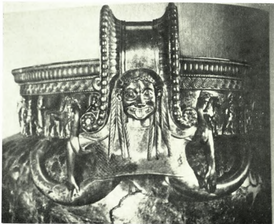
Λακωνικά γοργόνεια: α. Λαβή κρατήρος Βρετανικού Μουσείου (άρ. κατ. 36), β. Λαβή του κρατήρος του Vix (άρ. κατ. 37)