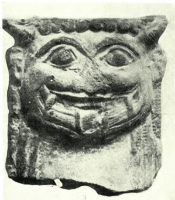
Λακωνικά γοργόνηα: α. Ἀγαμάτιον Λούβρου (ἀρ. κατ. 29), β. Πήλινον γοργόνηιον ἐκ Κύμης (ἀρ. κατ. 33)