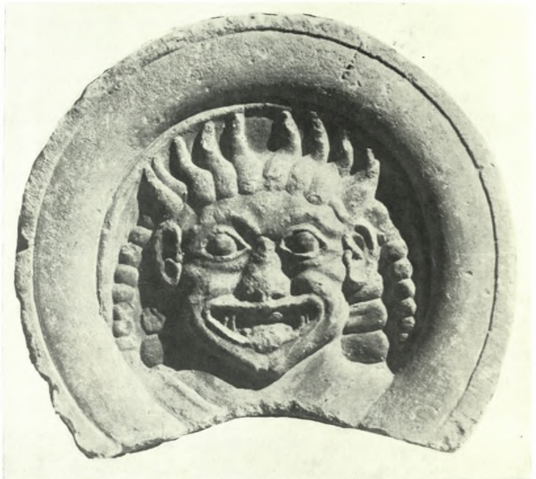
Λακωνικά γοργόνεια: α. Ἐλεφάντινον γοργόνειον ἐκ τοῦ ἱεροῦ τῆς Ὀρθίας (ἀρ. κατ. 9), β. Λαβὴ κρατήρος Μονάχου (ἀρ. κατ. 39), γ. Μαρμάρινον ἀκρωτήριον Μουσείου Σπάρτης (ἀρ. κατ. 41)