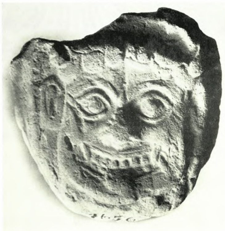
Λακωνικά γοργόνια: α. Τεμάχιον πινακίου ἐξ Ἁγ. Παρασκευῆς Ἄμυκλῶν (ἀρ. κατ. 3), β. Πήλινον πλαστικόν ἔμβλημα Μουσείου Ἡρακλείου (ἀρ. κατ. 32)