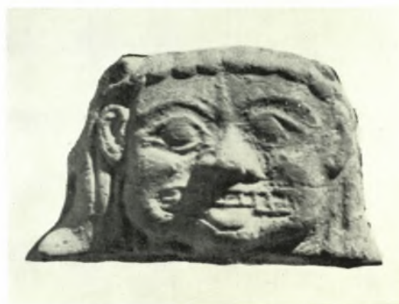
Λακωνικά γοργόνια: α. Ἐλεφάντινον πλακίδιον ἐκ τοῦ ἱεροῦ τῆς Ὀρθίας (ἀρ. κατ. 7), β. Ὀστεῖνη σφραγίς ἐκ τοῦ ἱεροῦ τῆς Ὀρθίας (ἀρ. κατ. 4), γ. Μαρμάρινον γοργόνιον Μουσείου Τεγέας (ἀρ. κατ. 14), δ. Πήλινον ἔμβλημα Μουσείου Σπάρτης (ἀρ. κατ. 17)