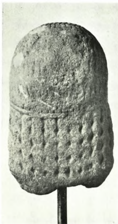
Ἐθνικὸν Ἀρχαιολογικὸν Μουσεῖον: α-γ. Ἀρχαϊκὴ κεφαλὴ ἐκ Μεγαρίδος (Ἀρ. Εὐρ. 4509)