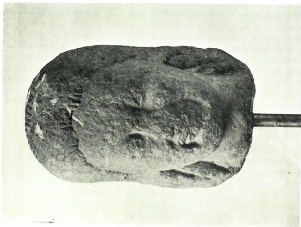
Ἐθνικὸν Ἀρχαιολογικὸν Μουσεῖον: α-β. Ἀρχαϊκὴ κεφαλὴ ἐκ Μεγαρίδος (Ἀρ. Εὐρ. 4509)