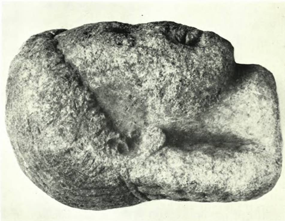
Ἐθνικὸν Ἀρχαιολογικὸν Μουσεῖον: α-β. Ἀρχαϊκὴ κεφαλὴ ἐκ Μεγαρίδος (Ἄρ. Εὐρ. 4509)