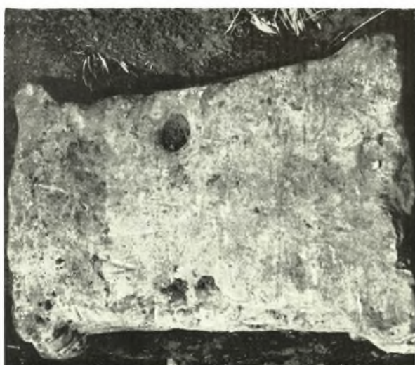
Θράκη: α-β. Στρόμη. *Ανετίγραφοι κώρινος βοιμός, γ. Μεσημβρία. *Ενετίγραφοι βασις «σήματος»