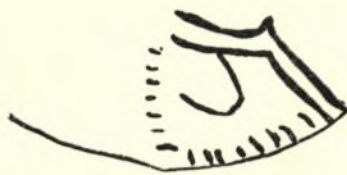
Σχεδ. 3. Σχηματικὸν ἄνθος ἐπὶ τῶν ὀμων τοῦ ἀμφορίσκου ἀρ. 5

Ὑψος 0.177-0.183 (διαφορὰ λόγῳ κλίσεως κατὰ τὸν ἄξονα τῶν λαβῶν) εἰς τὰς λαβὰς 0.184-0.189 ἀντιστοίχως, διάμ. βάσ. 0.092 χεῖλ. 0.154-0.156.