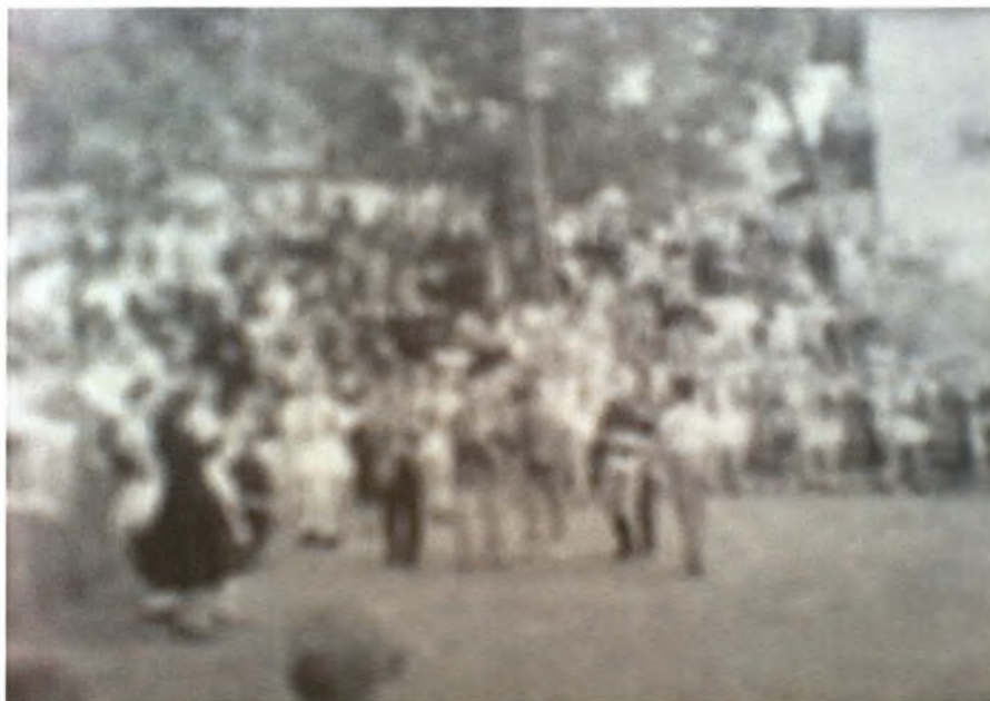
Εικόνα 14-Χορός στη Λόντζια

δείγμα της περιοχής και οι υπόλοιποι χορευτές κρατούσαν-συνόδευαν. Το Αρχοντόπουλο συνήθως ακούγονταν κοντά στην αυγή τότε που το γλέντι καταλάγιαζε. Οι εναπομείναντες μερακλήδες χόρευαν και το κλαρίνο έπαιζε στη μέση. Οι τσέπες άδειαζαν οι καημοί και τα ντέρτια έβγαιναν και με ένα γύρισμα του κλαρίνου το γλέντι τις περισσότερες φορές άναβε.