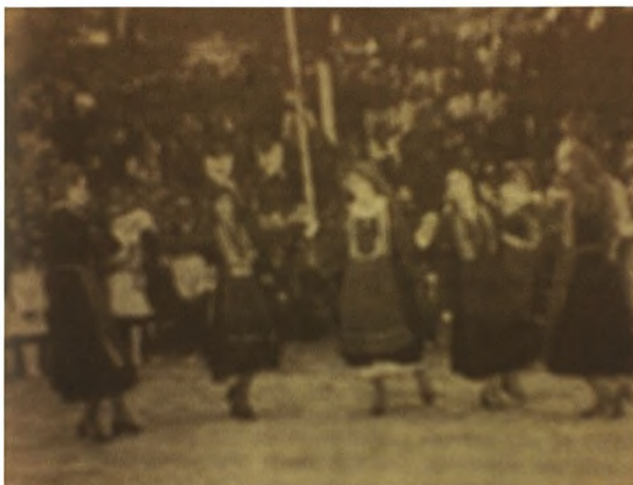
Εικόνα 15-Οι μαθητές και οι μαθήτριες του Καρούτειου Γυμνασίου και Λυκείου στους πατρογονικούς χορούς.

Η μελωδία <<Σαν πας πουλί μου>> ήταν νουμπέτ, αργός σκοπός με τον οποίο ξεκινούσαν πολλές φορές τα γλέντια. Σαν πας πουλί μου στη Φραγκιά, σαν πας