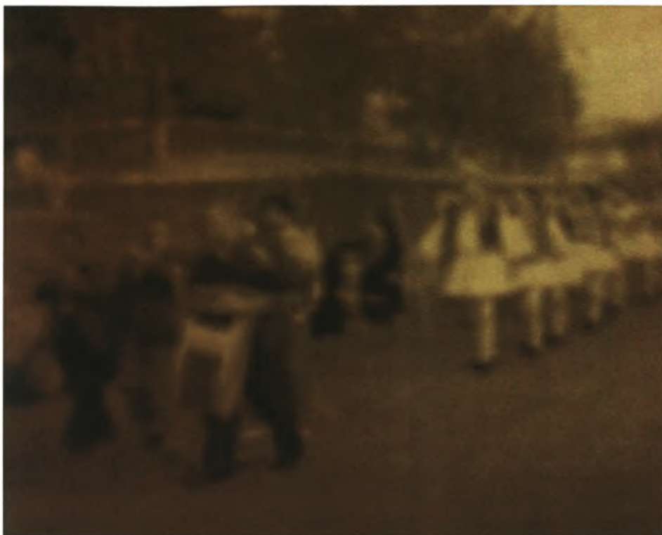
Εικόνα 9-Μέλη του συλλόγου με τις παραδοσιακές στολές και τα Λαϊκά όργανα στις εκδηλώσεις του πανηγυριού της 8ης Σεπτεμβρίου 1988