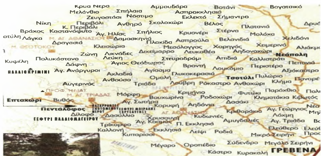
Εικόνα 1: Χάρτης της περιοχής του Βοΐου