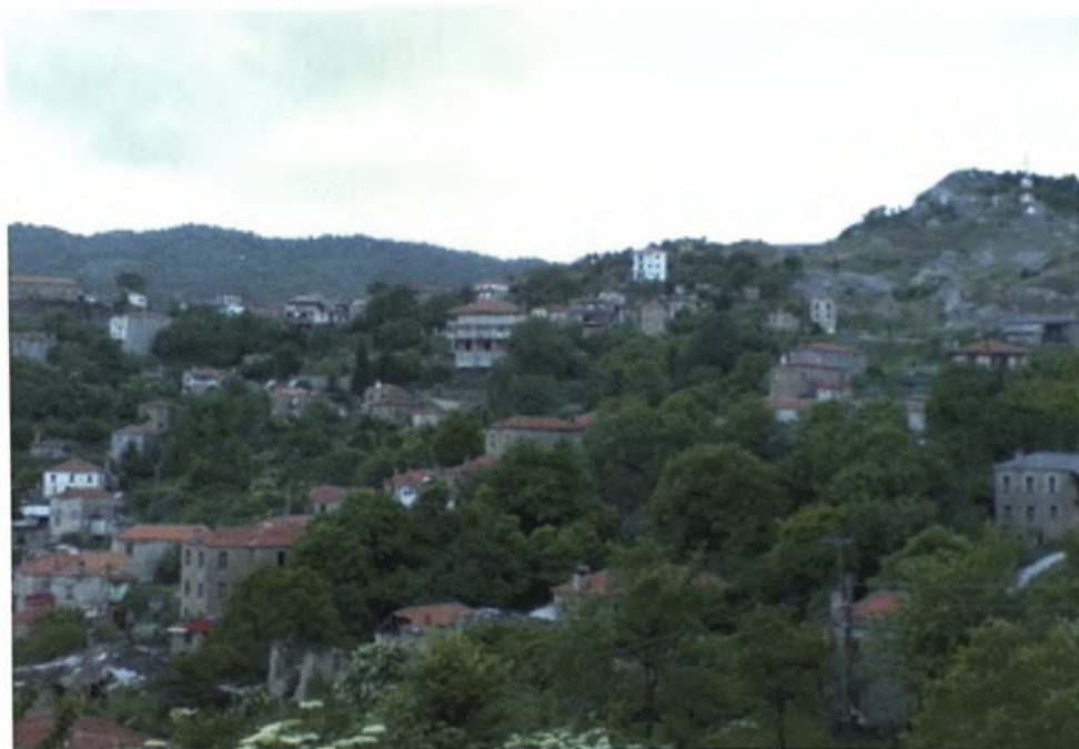
Εικόνα 3: Άποψη του κάτω μαχαλά