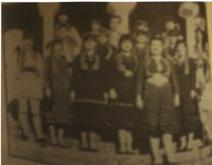
Εικόνα 11-Πενταλοφίτες και Πενταλοφίτισσες με την παραδοσιακή τοπική ενδυμασία στα σκαλοπάτια του Αγίου Αθανασίου στο πανηγύρι της 8ης Σεπτεμβρίου 1989