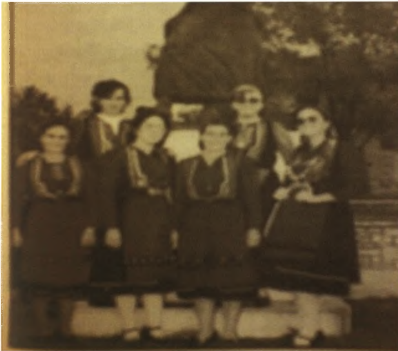
Εικόνα 13-Η ασημοκεντημένη κοντούσα, η γυναικεία φορεσιά του Πενταλόφου

Η γυναικεία στολή ήταν πιο φανταχτερή φυσικά από την ανδρική. Έτσι στην αρχή έμπαινε ένα μακρύ πουκάμισο, το αδίμιτο και μετά το μάλλινο ή βαμβακερό φόρεμα. Από επάνω η γυναικεία κοντούσα που ήταν πιο μακριά από την αντρική και στολισμένη με σιρίτια και κορδόνια επίχρυσα ή επάργυρα. Πάνω από την κοντούσα φορούσαν μεταλλική ασημένια ζώνη και στο κεφάλι βαμβακερό ή μάλλινο μαντήλι. Οι κάλτσες ήταν άσπρες(εκτός από τις χήρες) κεντημένες και φορούσαν χοντρά παπούτσια. Το χειμώνα φορούσαν στολισμένες κάπες. Όλα τα παραπάνω υφάσματα υφαίνονται στον αργαλειό από τους ίδιους τους κατοίκους. Η βαφή των υφασμάτων γινόταν με φλούδια από καρύδια όπου ήθελαν να δώσουν καφέ απόχρωση ή από φύλλα λυσιάς, τοπικού δέντρου καθώς και με αγοραστές μπογιές. Ράβονταν από τους τερζήδες, ράφτες που πήγαιναν στα σπίτια για τα μάλλινα. Επίσης υπήρχαν και οι φραγκοράφτες όπως τους αποκαλούσαν που έραβαν με ευρωπαϊκά πρότυπα. Τα παπούτσια γίνονταν κι αυτά στο χωριό από τσαγκαράδες με ειδικά μηχανήματα.