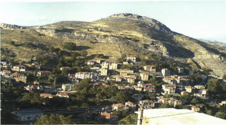
Εικόνα 7: Το όρος Δόντι (Γκραντίσκα)