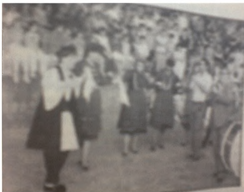
Εικόνα 20-Το απόγευμα της ημέρας του Πάσχα στην πλατεία του χωριού γίνονταν υπαίθριος χορός.