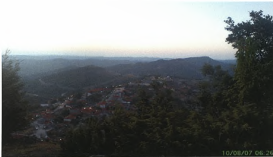
Εικόνα 6: Άποψη του κέντρου του χωριού