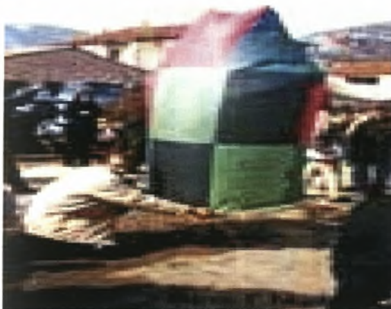
Εικόνα 19-Το πέταγμα των αερόστατων στον Πεντάλοφο Κοζάνης

Το έθιμο αυτό έχει ζωή πάνω από 200 χρόνια και είναι από τα λίγα που συνεχίζονται μέχρι και σήμερα στο χωριό.