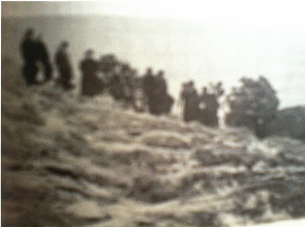
Εικόνα 21-Ο κλαψόδεντρος

Και της μανούλας σου η ευχή να` ναι για φυλαχτό σου! Να μη σε πιάνει βάσκαμα και το κακό το μάτι, Θυμήσου με, παιδάκι μου, και με και τα παιδιά μου Μη σε πλανέψει η ξενιτιά και μας αλησμονήσεις! Κάλιο, μανούλα μου γλυκειά, κάλιο να σκάσω πρώτα Παρά να μη σας θυμηθώ στα έρημα τα ξένα!