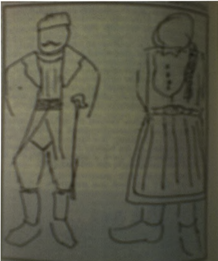
Εικόνα 12-Σκίτσο που απεικονίζει την αντρική(δεξιά) και την γυναικεία(αριστερά) στολή του Πενταλόφου

Οι άνδρες φορούσαν χοντρό μάλλινο πουκάμισο αφήνοντάς το να κρέμεται μακρύ κάτω από τη λεκάνη σαν φουστανέλα. Πάνω από το πουκάμισο έμπαινε η αντρική κοντούσα, ένα μάλλινο ένδυμα μαύρου χρώματος που έφτανε στο ύψος του πουκαμίσου. Στα πόδια φορούσαν χωλεύβια, μάλλινο άσπρο ή μαύρο συνήθως ύφασμα με μορφή περικνημίδας που κάλυπτε τα πόδια ως τη λεκάνη. Αργότερα αντικαταστάθηκε από το παντελόνι. Τα παπούτσια ήταν χοντρά, χωρίς κορδόνια και με πρόκες για να μη γλιστρούν το χειμώνα. Πάνω από την κοντούσα είχαν μία δερμάτινη ζώνη ή μάλλινο ζωνάρι, τη ζούνα όπως έλεγαν. Από επάνω φορούσαν μάλλινο παλτό και σκούρο στο κεφάλι ενώ στην τουρκοκρατία φέσι.