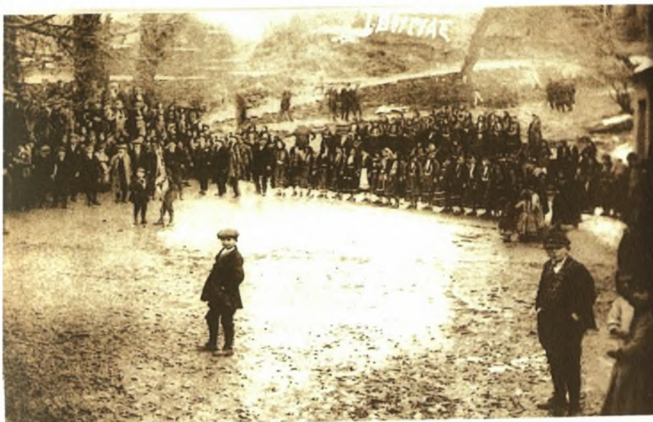
Η παλιότερη φωτογραφία της Λόντζιας (πιθανόν αρχές της δεκαετίας του 1920)