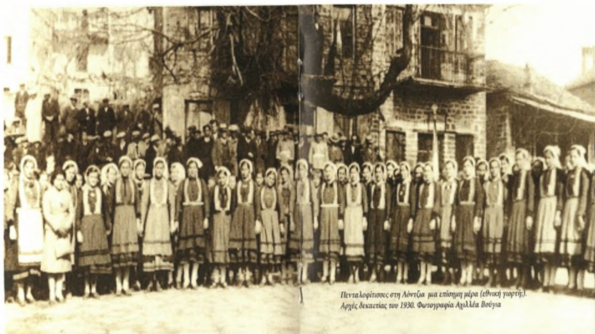
Πενταλοφίτισσες στη Λόντζα μια επίσημη μέρα (εθνική γιορτή). Αρχές δεκαετίας του 1930.

Τα λάθη αυτά των δισκογραφικών καταγραφών οφείλουμε να τα αποκαταστήσουμε, γιατί ο Κατσαντώνης δεν πήγε ποτέ ούτε στο Μωριά ούτε στην Άγια Λαύρα. Αντίθετα κατέφυγε κυνηγημένος από τους Τούρκους όπως και πολλοί άλλοι αγωνιστές μας, στα νησιά του Ιονίου (Φραγκιά) και συγκεκριμένα στη Λευκάδα (Άγια Μαύρα). Μετά τον αργό αυτό σκοπό ακολουθούσαν τα γυρίσματα <<τα πήρανε τα πρόβατα>> και <<μπεράτι>>.