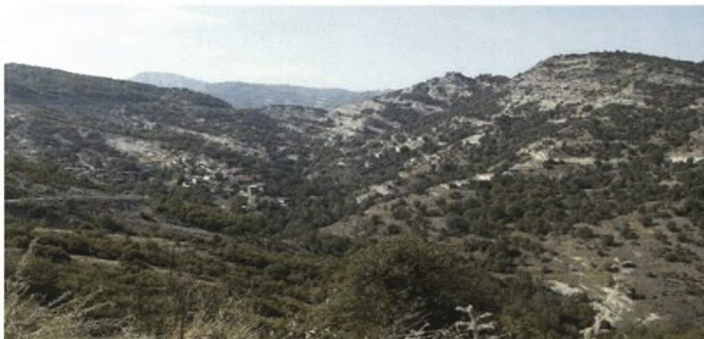
Εικόνα 2: Άποψη του χωριού Βυθός (Δίπλα στον Πεντάλοφο)