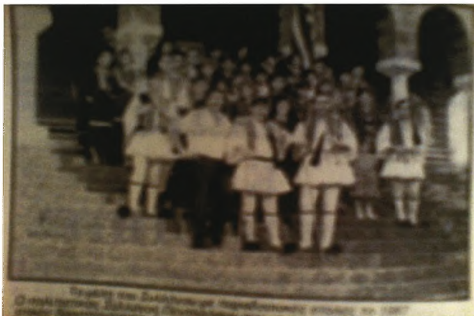
Εικόνα 8-Μέλη του πολιτιστικού συλλόγου ντυμένα με τοπικές φορεσιές

Τα παλαιότερα χρόνια οι διάφορες πολιτιστικές εκδηλώσεις γίνονταν κατά την ημέρα του πανηγυριού την 8 η Σεπτεμβρίου, τις ημέρες του Πάσχα, των Χριστουγέννων, των αποκριών και τις ημέρες του καλοκαιριού. Οι εκδηλώσεις περιλάμβαναν χορούς και λαϊκά όργανα στην Λόντζια(κεντρική πλατεία),στον προαύλιο χώρο της εκκλησίας της Αγίας Βαρβάρας και σε διάφορα κέντρα από άτομα που είχαν μεράκι στους χορούς και στα τραγούδια. Τα τελευταία χρόνια όμως οι εκδηλώσεις αυτές είναι οργανωμένες με πρόγραμμα. Τη φροντίδα της συμμετοχής των αγοριών και των κοριτσιών, της εξεύρεσης τοπικών σχολών, γυναικείων και ανδρικών, της εκλογής των οργανοπαιχτών, ντόπιων και ξένων, της πρόσκλησης πολιτιστικών Συλλόγων άλλων χωριών και γενικά όλης της οργάνωσης της εκδήλωσης την αναλαμβάνει ο πολιτιστικός σύλλογος του Πενταλόφου. Οι εκδηλώσεις αυτές σημειώνουν κάθε χρόνο μεγάλη επιτυχία και οι χωριανοί συμμετέχουν σε αυτές με μεγάλη διάθεση.