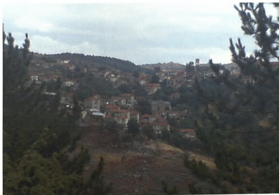
Εικόνα 4: Άποψη του πάνω μαχαλά