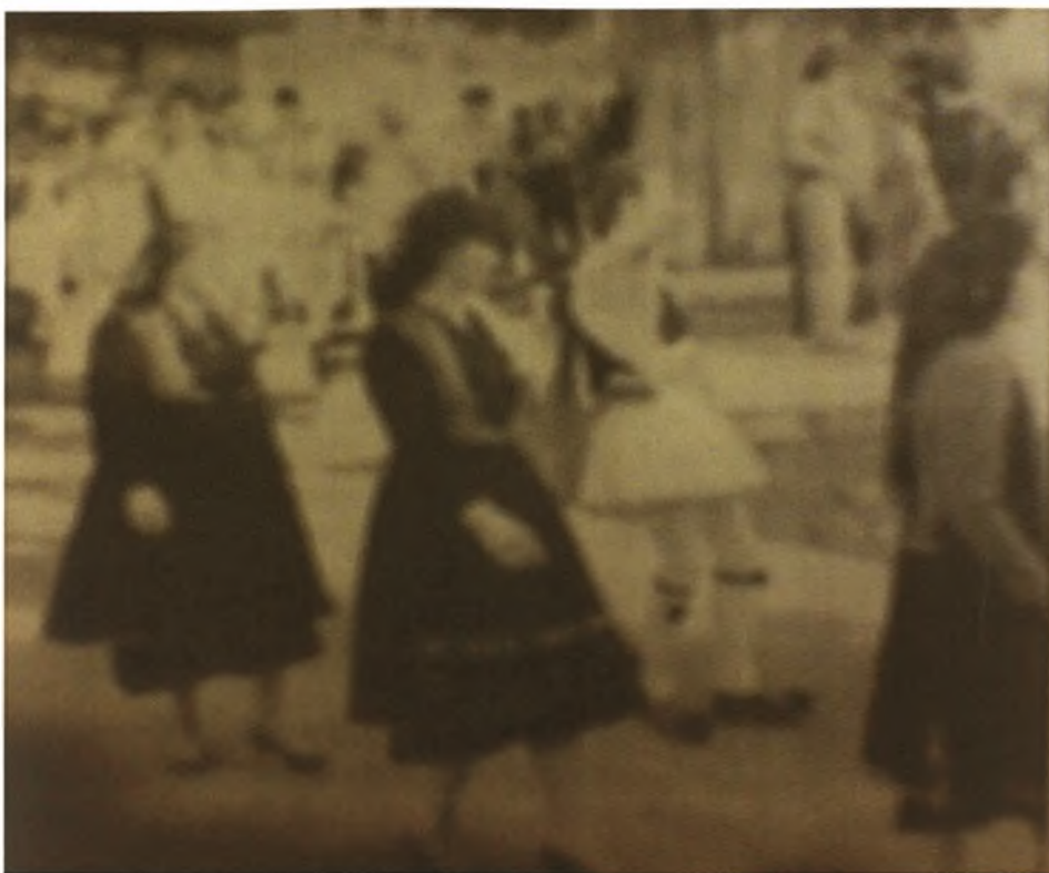
Εικόνα 10- Μέλη του συλλόγου με τις παραδοσιακές στολές και τα Λαϊκά όργανα στις εκδηλώσεις του πανηγυριού της 8ης Σεπτεμβρίου 1988