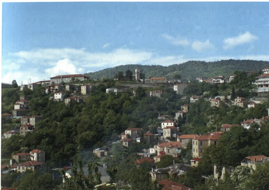
Εικόνα 22-Άποψη του χωριού

την οποία θέλω να την ευχαριστήσω ιδιαίτερα γιατί η βοήθειά της ήταν πολύτιμη.