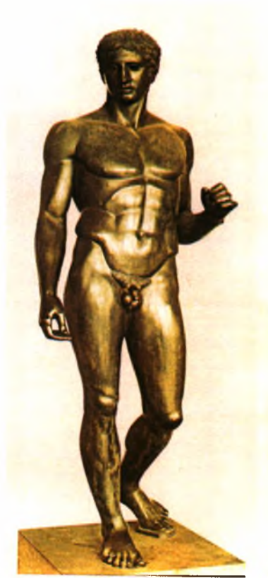
Ο Κανών, Πολύκλειτος

Απόσπασμα από την «Ιστορία της ομορφιάς», Umb. Eco, Καστανιώτης, 2004.