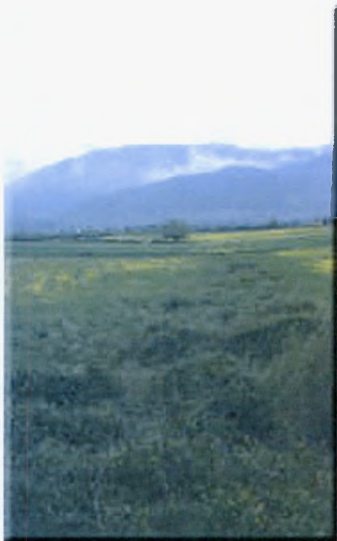
Εικόνα 12: Το Παναιτωλικό