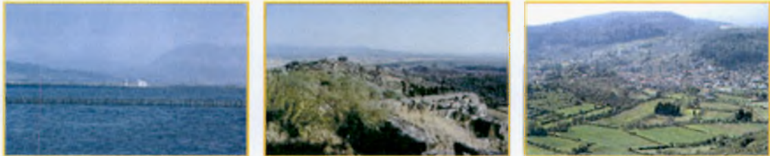
Εικόνα 4.1: Φυσικό περιβάλλον Δυτικής Ελλάδος

Η Περιφέρεια Δυτικής Ελλάδος είναι προνομιούχος από την άποψη του φυσικού περιβάλλοντος. Φιλοξενεί πολλά, σημαντικά και ποικίλα ευαίσθητα οικοσυστήματα. Είναι χαρακτηριστικό ότι από τους έντεκα υγροβιότοπους διεθνούς σημασίας της Ελλάδος, που έχουν ενταχθεί στη συνθήκη Ramsar, οι τρεις ευρίσκονται στην Περιφέρεια Δυτικής Ελλάδος.