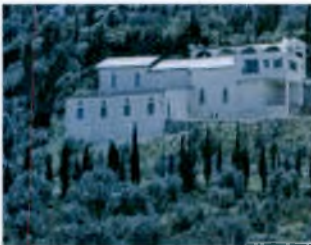
Εικόνα 4.7. Φολόη