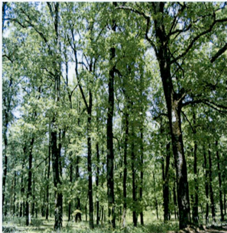
Εικόνα 16: περιοχή Ζαχάρω