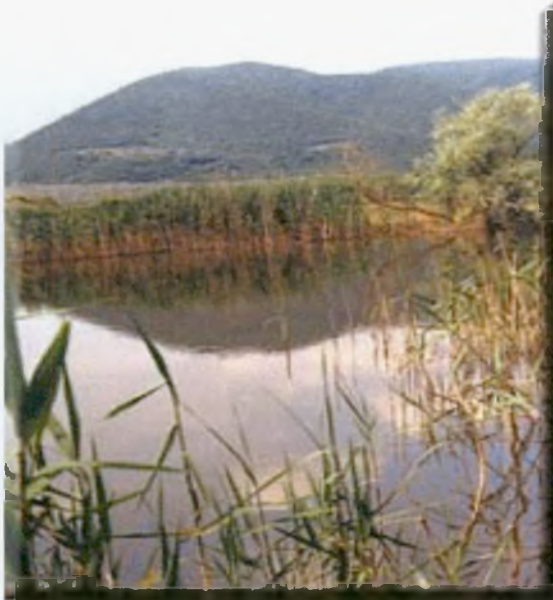
Εικόνα 10: Αμβρακικός Κόλπος