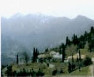
Εικόνα 4.6. Ορεινή Αιγιάλεια