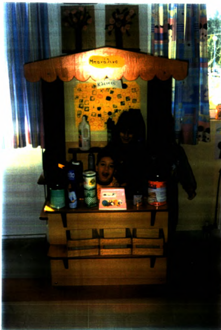
Φωτογραφία (5). Η «γωνιά» του μπακάλικου