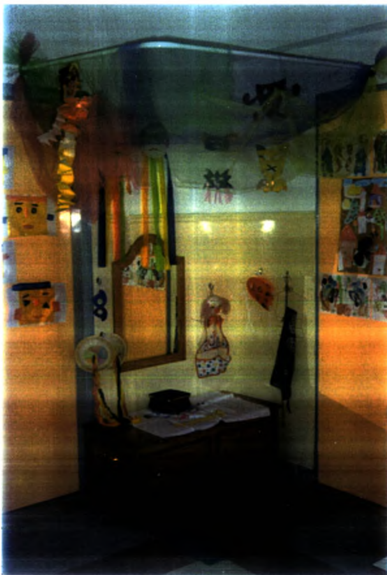
Φωτογραφία (6). Η «γωνιά» της ομορφιάς