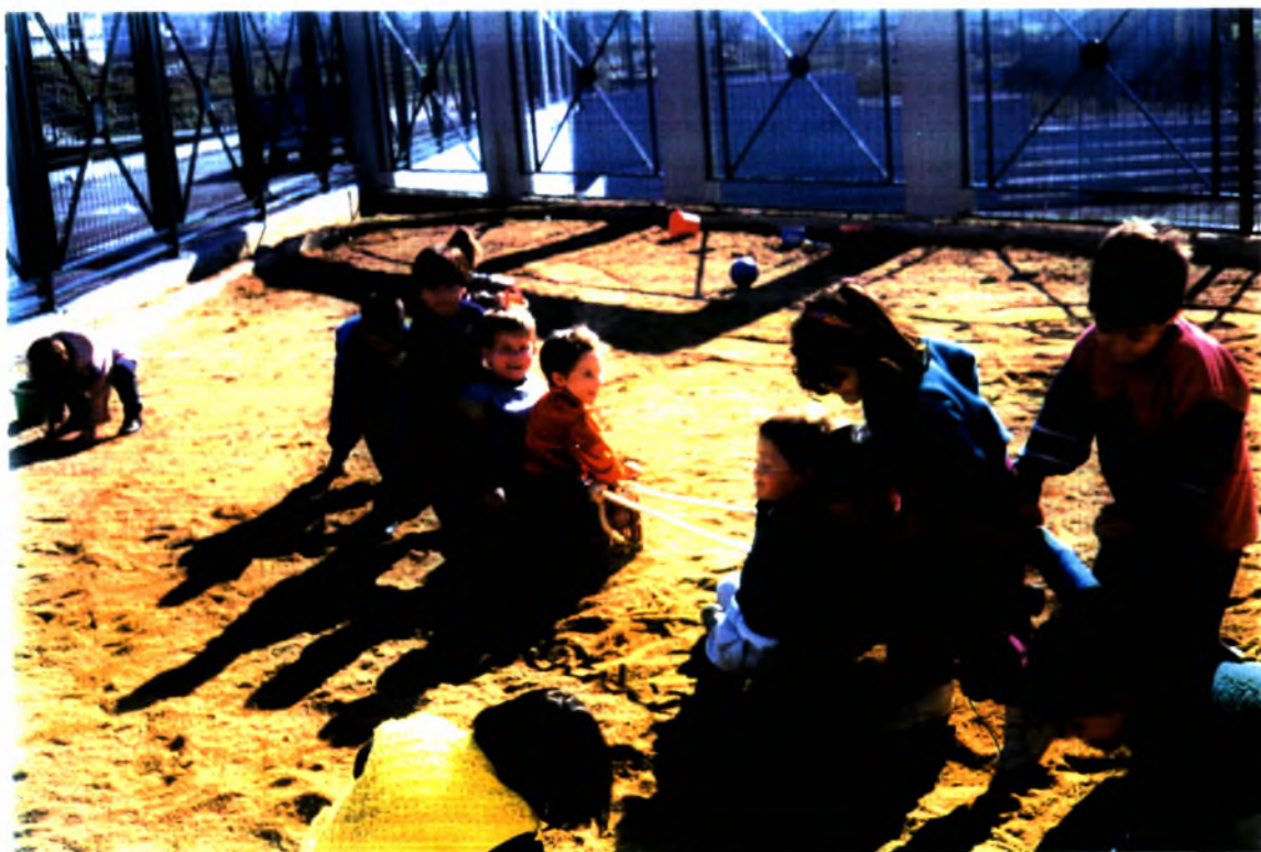
Φωτογραφία (10). Το παιχνίδι στην άμμο