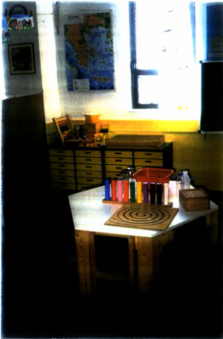
Φωτογραφία (8) Το «Παιδαγωγικό υλικό»