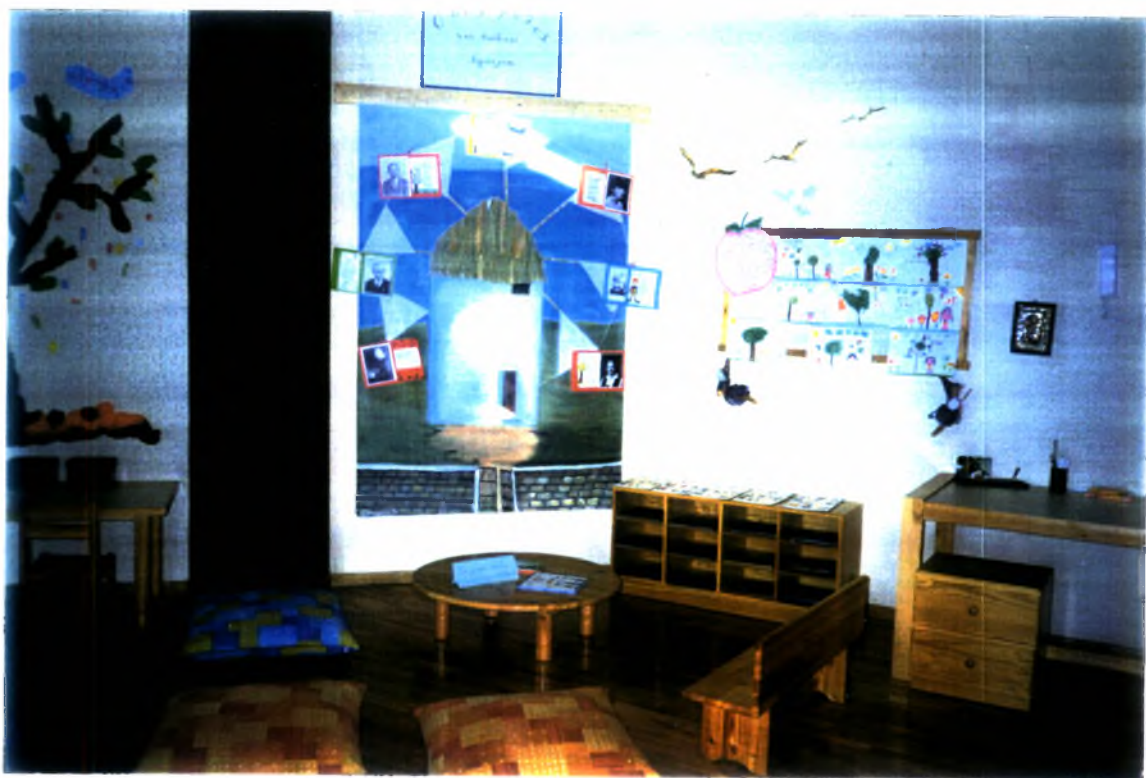
Φωτογραφία (3). Η «γωνιά» της βιβλιοθήκης