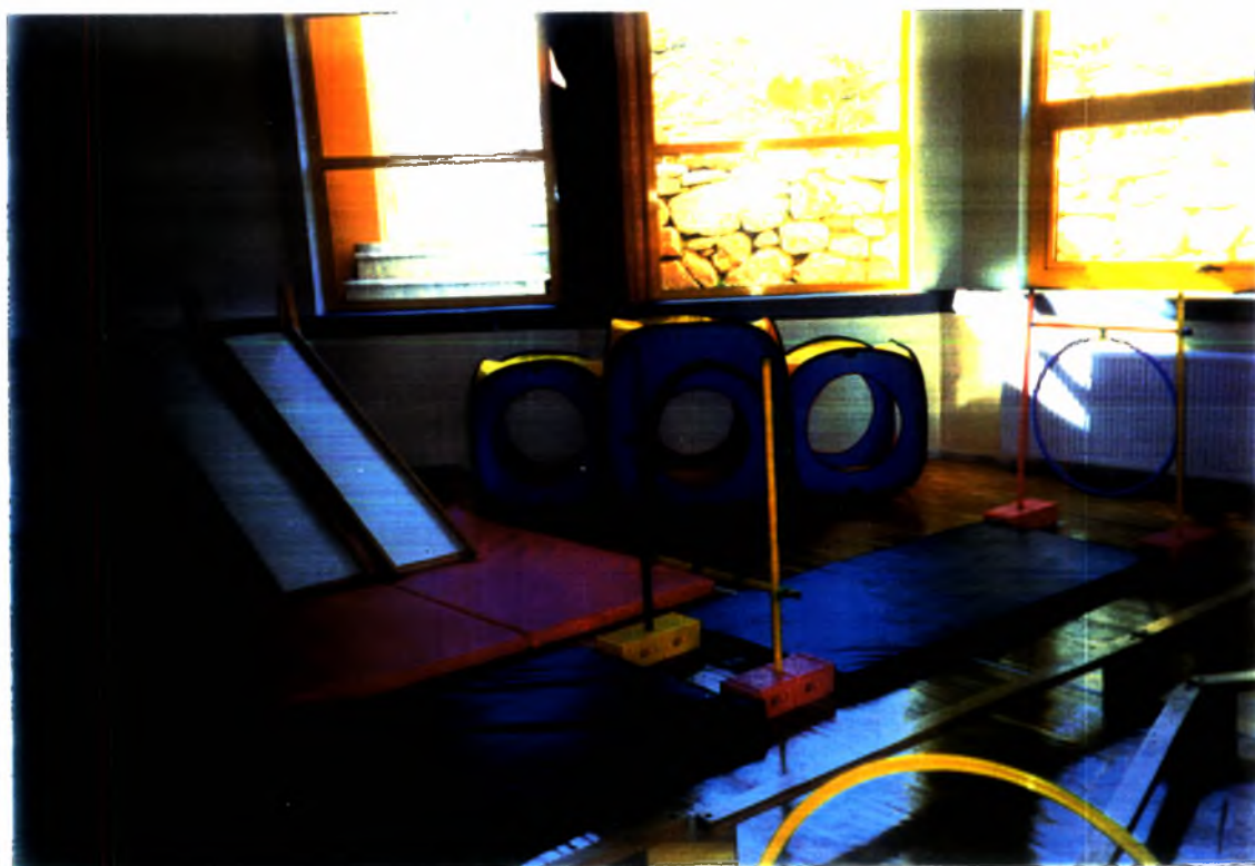
Φωτογραφία (12). «Χώρος ψυχοκινητικών δραστηριοτήτων»