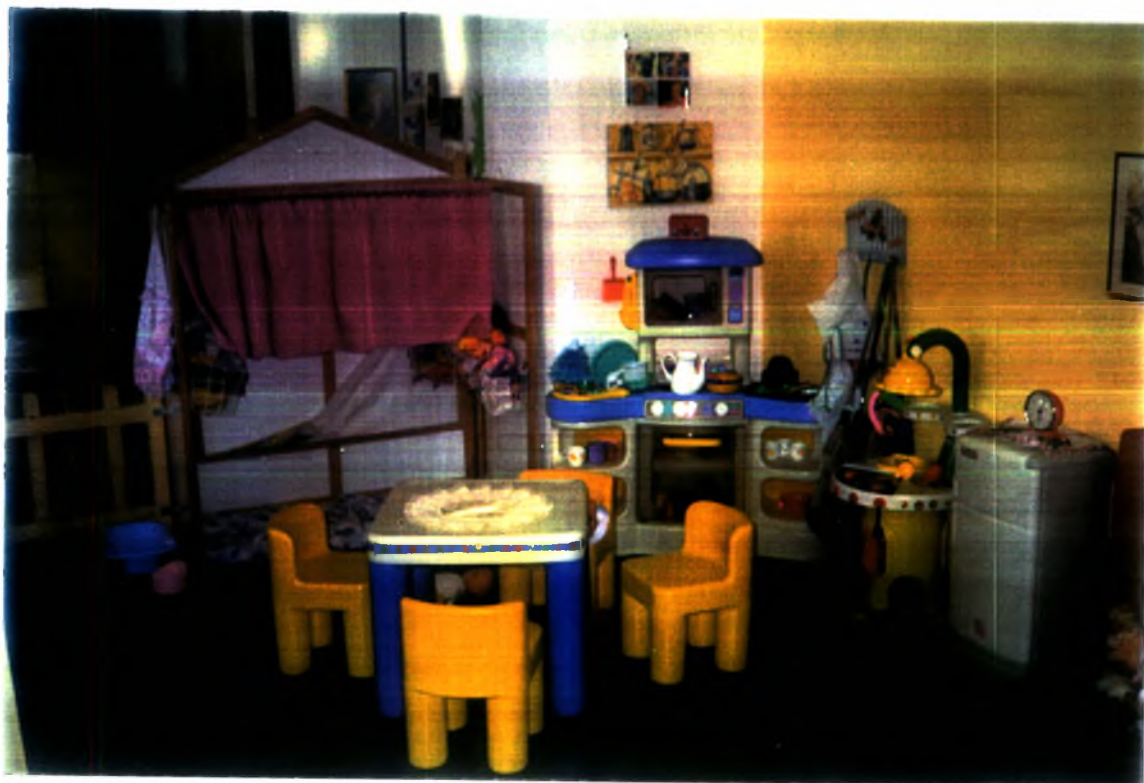
Φωτογραφία (4). Η «γωνιά» του κουκλόπιου