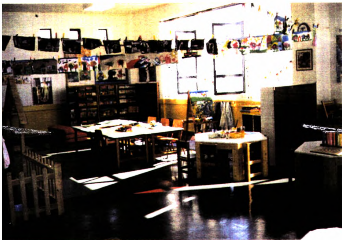
Φωτογραφία (1). Εσωτερικός χώρος του 50ου Νηπιαγωγείου

Το νηπιαγωγείο για να λειτουργήσει άμεσα και θετικά, στα παιδιά θα πρέπει πρώτα απ' όλα να είναι καλά οργανωμένο και εξοπλισμένο ως χώρος, τόσο εσωτερικά όσο και εξωτερικά.