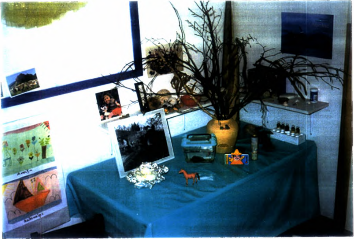
Φωτογραφία (1). Η «γωνιά» της φύσης