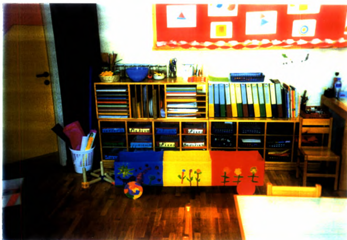
Φωτογραφία (11). Η «γωνιά των εργασιών»