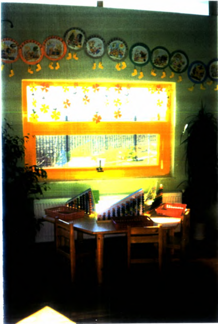
Φωτογραφία (7). Το «παιδαγωγικό υλικό»