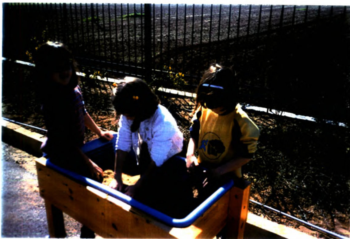
Φωτογραφία (9). Η αμμοδόχος στο εξωτερικό περιβάλλον