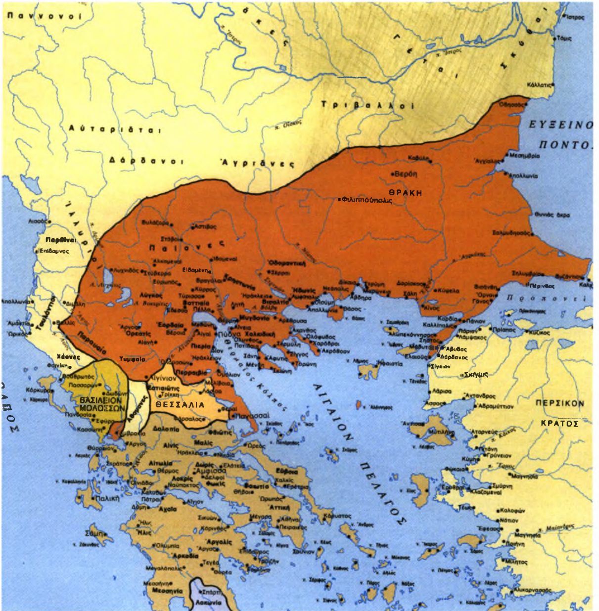
Το μακεδονικό βασίλειο το 336 π.Χ. (ΙΕΕ Γ1)