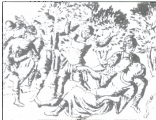
10. Ερωτόκριτος (1710)

Μετά τον Αγώνα η πνευματική ζωή νοσταλγεί τη περασμένη ακμή, τη μνήμη της αρχαίας δόξας. Η εξασθένιση και η παρακμή οδηγούν προς τη τάση για φυγή από τη πραγματικότητα. Η περίοδος αυτή των πνευματικών ζυμώσεων, που ονομάζεται περίοδος του ρομαντισμού, χωρίζεται σε δύο πόλους, πρώτον στους Φαναριώτες και το νεοκλασικισμό και δεύτερον στην Επτανησιακή σχολή, που στρέφεται προς τη Δύση, και τον ιδανισμό. Παράλληλα η λογισσύνη και ολόκληρη σχεδόν η πνευματική δραστηριότητα εγκαθίσταται στην Αθήνα. Μετά τη περίοδο του ρομαντισμού και την άνοδο της γενιάς του '80, με κύριο εκπρόσωπο τον Κ. Παλαμά, μορφοποιούνται τα στοιχεία του λόγου και του πνεύματος. Ο Παλαμάς δένει το έργο του με τη παράδοση, την οποία και ανανεώνει. Χαρακτηριστικό παράδειγμα της