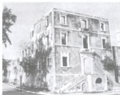
3. Τα ερείπια της Ιόνιου Ακαδημίας (1967)

Ενετοκρατίας. Η δημιουργία της Επτανησιακής Σχολής, μιας μερίδας ατόμων που διατηρεί τη κοινή της καταγωγή και αναπτύσσει μια πλούσια και αξιομνημόνευτη λογοτεχνική παραγωγή. Ο κοινός τόπος εδώ αποτελεί κριτήριο χαρακτηρισμού του νέου πνευματικού κόσμου, ως γέφυρα του νεοελληνικού διαφωτισμού με τον ευρωπαϊκό, του ελληνικού στοιχείου με τη Δύση. Αυτή η αφομοίωση του δυτικού τρόπου ζωής και σκέψης δεν ήταν δυνατό να γίνεται με γοργούς ρυθμούς και πλήρως, γιατί όπως υποστηρίζει ο