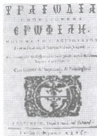
2. Προμετωπίδα της Ερωφίλης (1637)

Όσο ο ελληνισμός πλησιάζει στην ώρα του μεγάλου Αγώνα διαχωρίζεται από το παρελθόν του, αυτό της Ανατολής και του πολιτισμού του Βυζαντίου και καθιστά τους δεσμούς του με τη Δύση ισχυρότερους. Ο αιώνας των Φαναριωτών που παρουσίασε μια μεγάλη πνευματική κίνηση και προσφορά στη