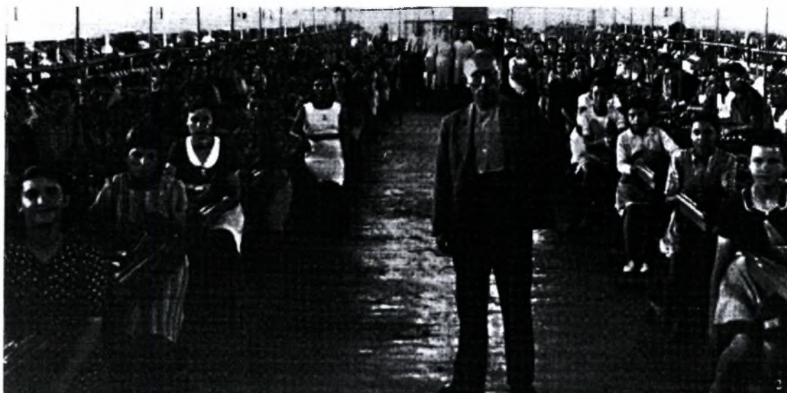
Εικόνα 3 :Εργάτριες πρόσφυγες στο Μεταξουργείο Ετμεκτζόγλου (από το βιβλίο «Βόλος, ένας αιώνας από την ένταξη στο ελληνικό κράτος(1881) έως τους σεισμούς (1955), επιμ. Αίγλη Δημόγλου, σελ. 149)