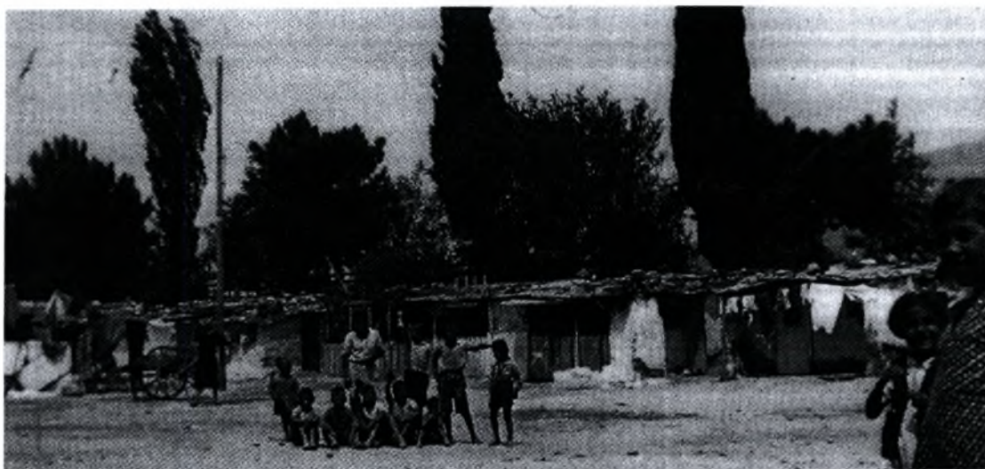
Εικόνα 1 : Προσφυγικός συνοικισμός της οδού Ιωλκού