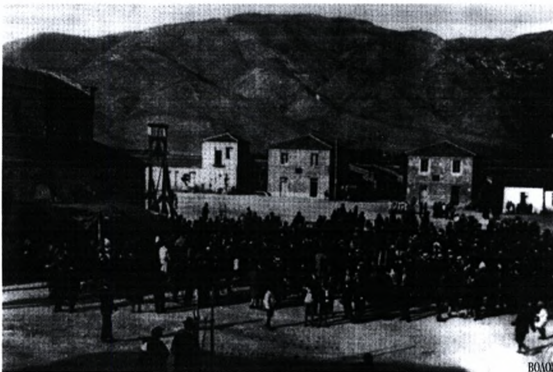
Εικόνα 4 :Πάσχα στον προσφυγικό συνοικισμό της Νέας Ιωνίας, 1927 (από το βιβλίο «Βόλος ...ό.π», σελ. 47)