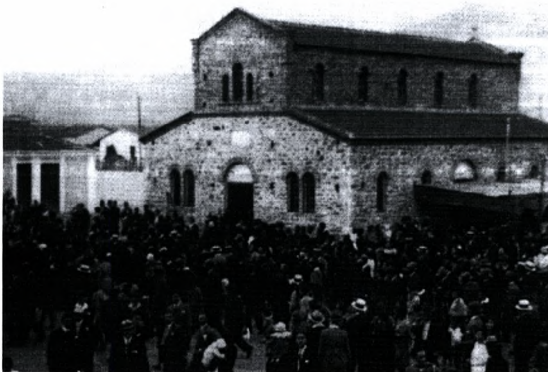
Εικόνα 2 : Η εκκλησία Ευαγγελίστρια στην Νέα Ιωνία (από το βιβλίο « Βόλος ένας αιώνας από την ένταξη στο ελληνικό κράτος(1881) έως τους σεισμούς (1955) επιμ. Αίγλη Δημόγλου, σελ. 266)