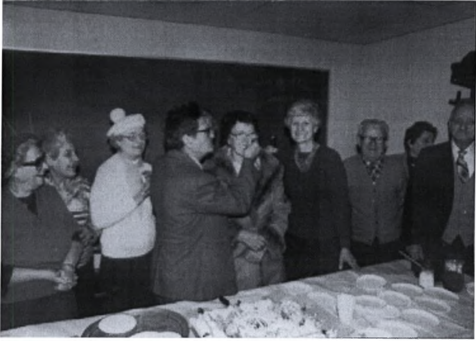
Φωτογραφία (11). Επέτειος μεταναστών στις ΗΠΑ. (1970)