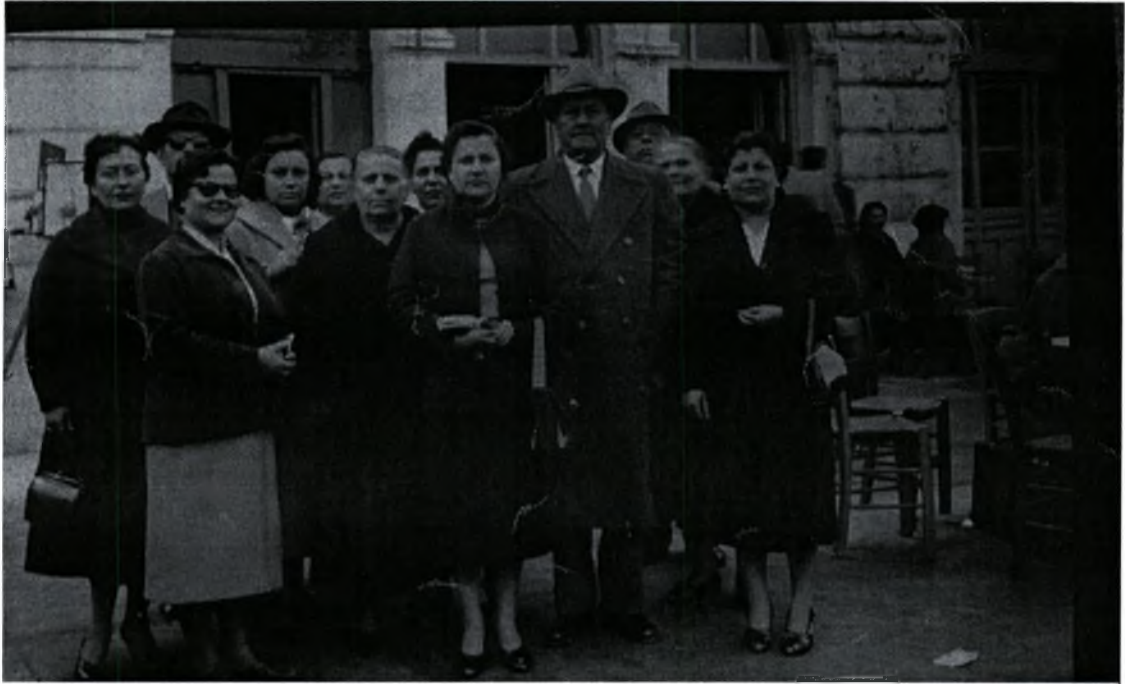
Φωτογραφία (6). Αναχώρηση μετανάστριας από Πειραιά. (1958)