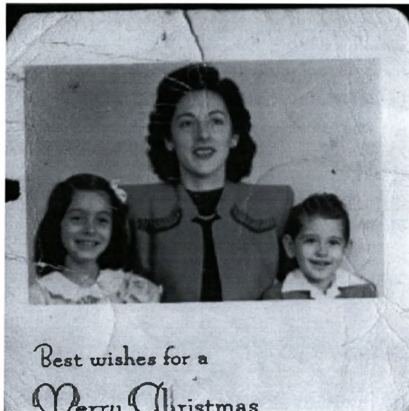
Φωτογραφία (10)- Οικογένεια μεταναστών στις ΗΠΑ (δεκαετία 1950)