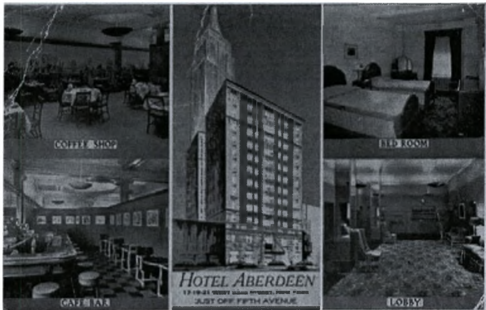
Καρτ-ποστάλ. Ξενοδοχείο της Νέας Υόρκης (λίγο μετά τον Β' Παγκόσμιο Πόλεμο)