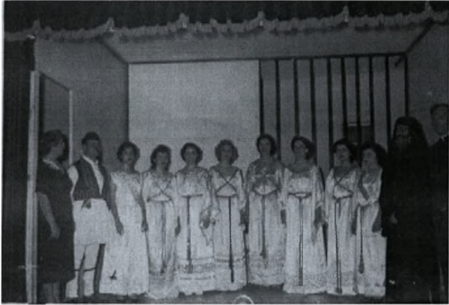
Φωτογραφία (8) Εθνική γιορτή μεταναστών στο Τέξας των ΗΠΑ (δεκαετία 1950)