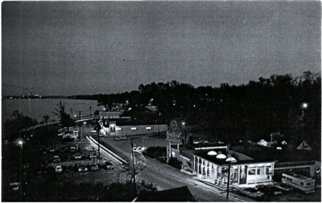
Καρτ-Ποστάλ Εστιατόριο μεταναστών στη Βιρτζίνια των ΗΠΑ (δεκαετία 1970)