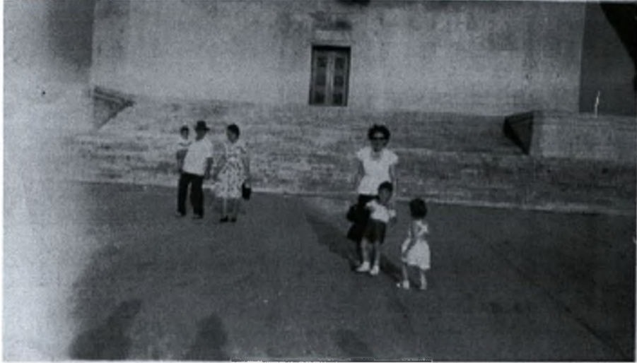
Φωτογραφία (7) Οικογένεια μεταναστών στο Τέξας (δεκαετία 1950)