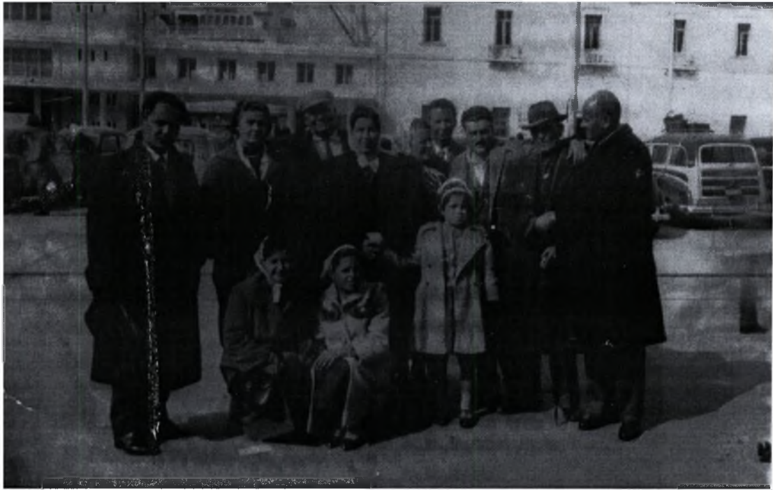
Φωτογραφία (5)- Μετανάστες λίγο πριν την αναχώρηση στο λιμάνι του Πειραιά. (1956)