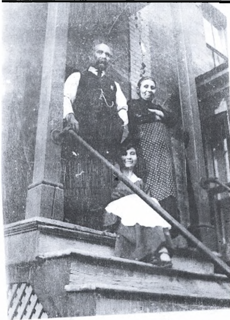
Φωτογραφία (2) Οικογένεια μεταναστών στη είσοδο του σπιτιού τους στις ΗΠΑ (αρχές του 20 ου αιώνα