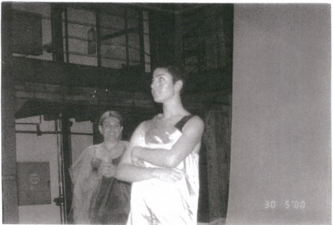
2. Φεγγαράκι μου, πιές το γαλατάκι σου