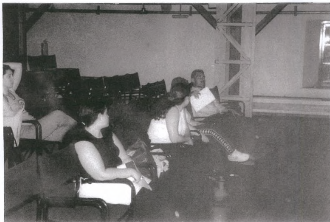
2. ... κι άλλα φώτα