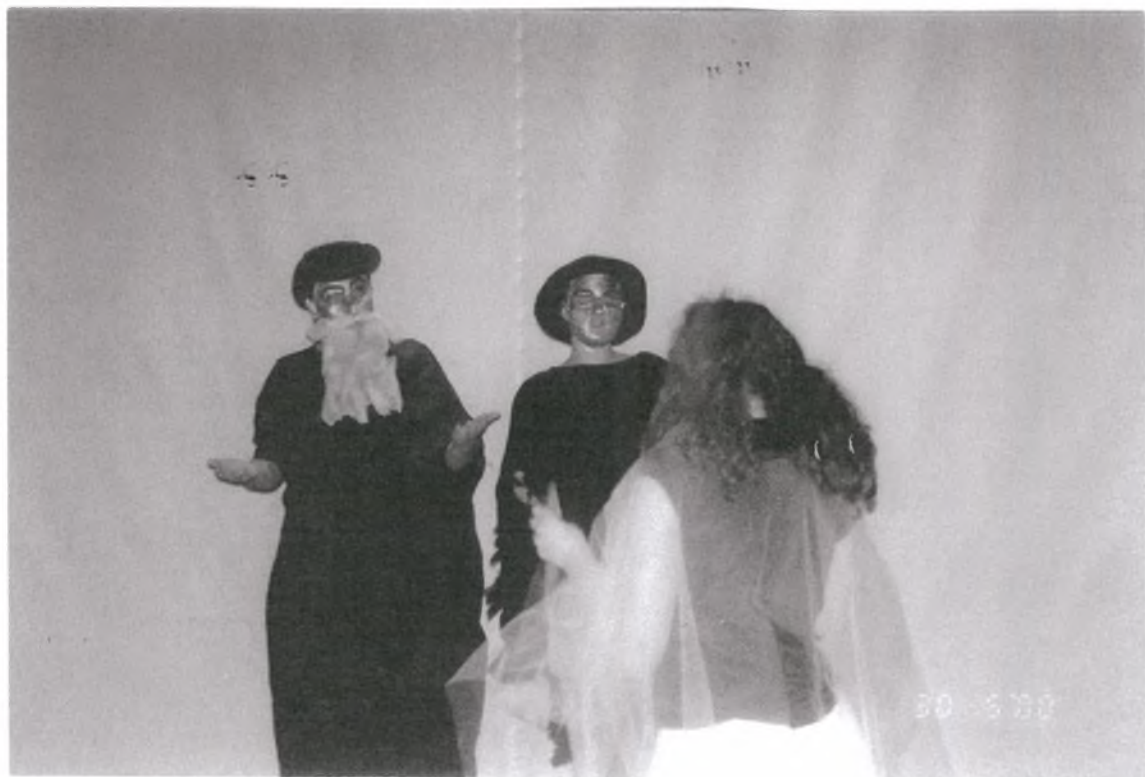
1. Ποιανού είναι η θάλασσα νεαρά;