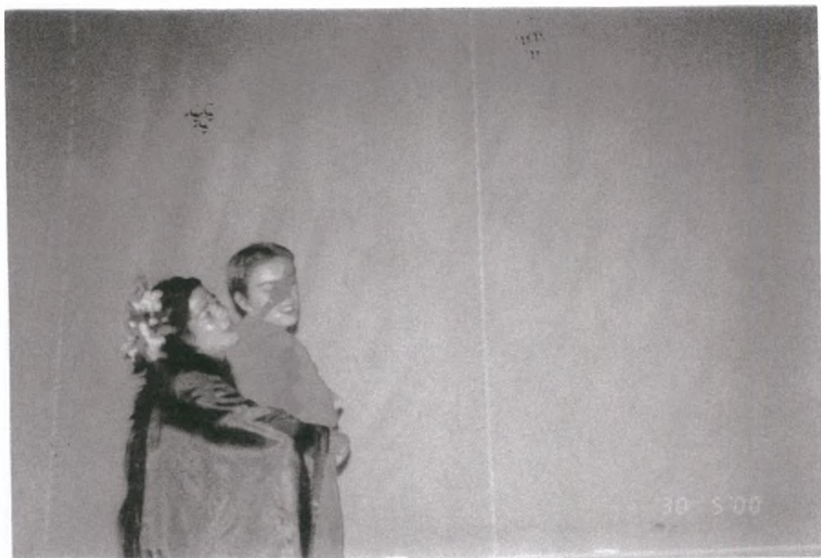
1. Πέτα μαντήλι μου, μήνυμα της αγάπης μου