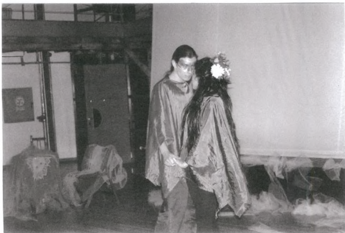
2. Έρωτας να πλανιέται...