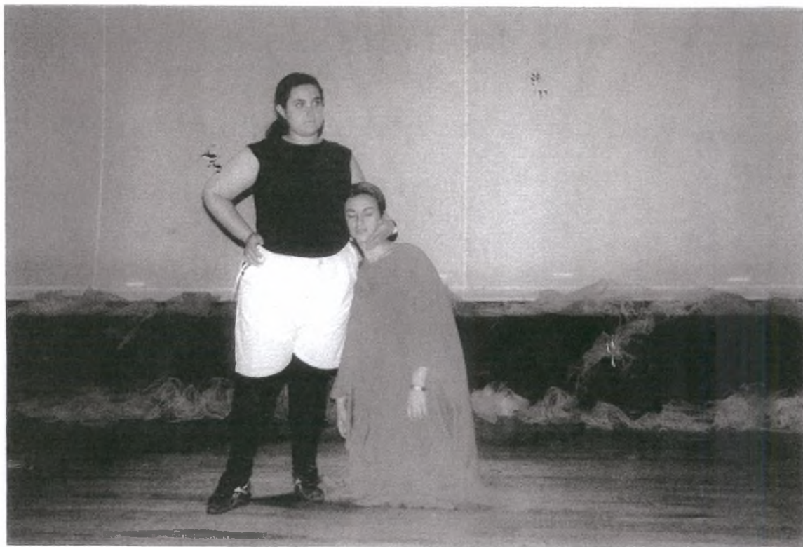
1. Μαζί θα γυρίσουμε τον κόσμο όλο