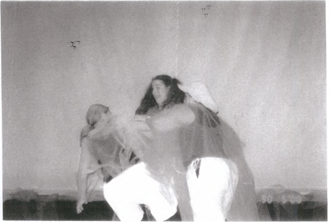
1. Θα φας τόσο ξύλο...