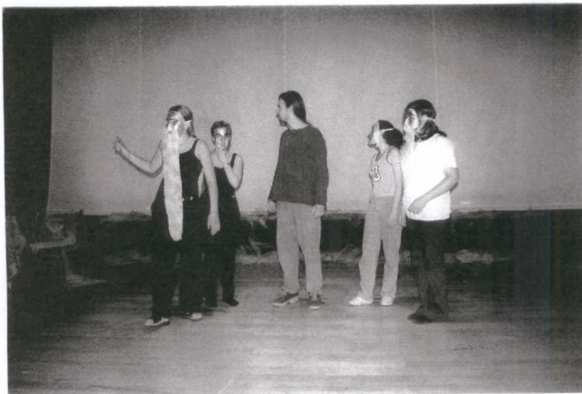
2. Α, να... η πριγκίπισσα έρχεται