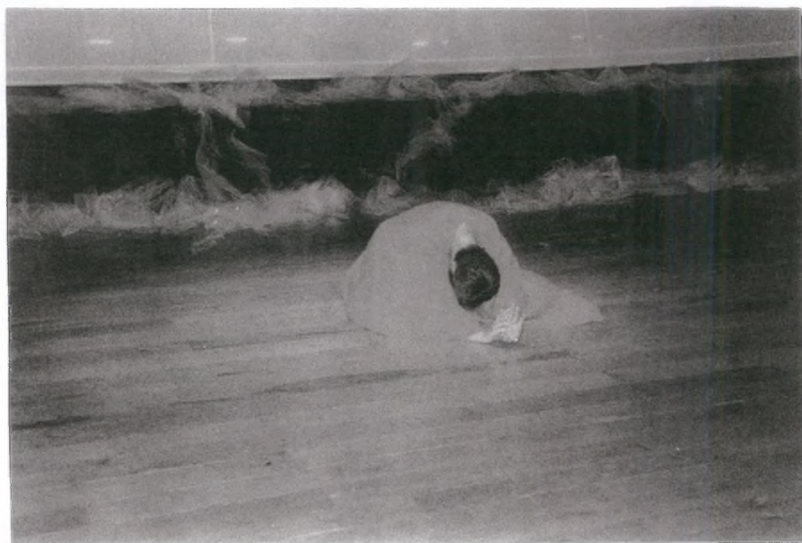
2. ... και προσγειώθηκε στο μπαλκόνι της Σελήνης