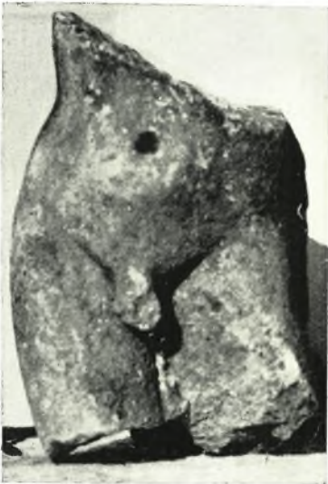
β. Ἀνδρικός μαρμαρίνος κορμός.