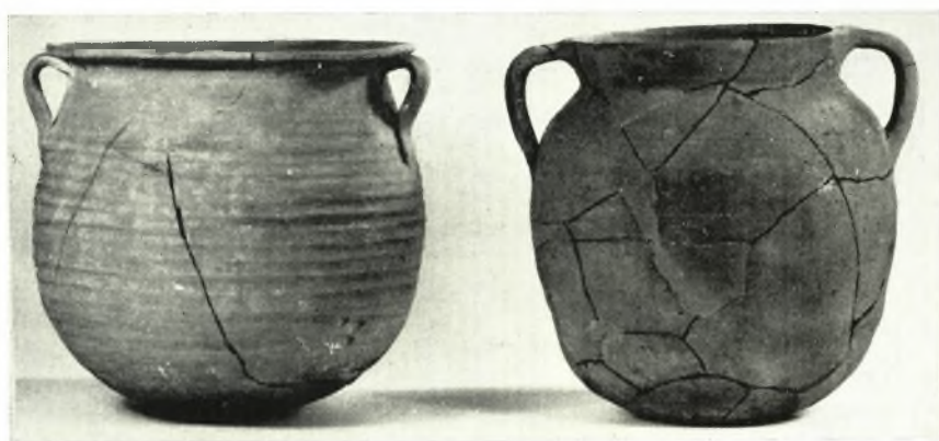
γ. Πήλινα άγγεϊα οικιακής χρήσεως.