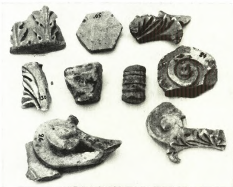
α. Θραύσματα κορινθιακῶν κιονοκράνων.