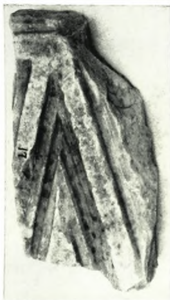
β. Τεμάχιον θωρακίου τέμπλου.