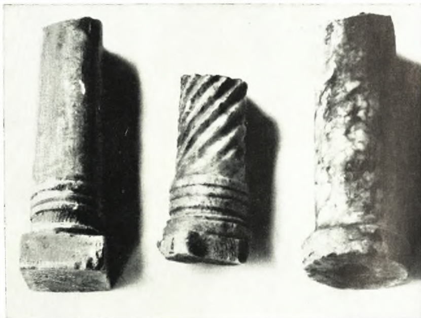
α. Τεμάγια κιονίσκων ἐκ μαρμάρου.