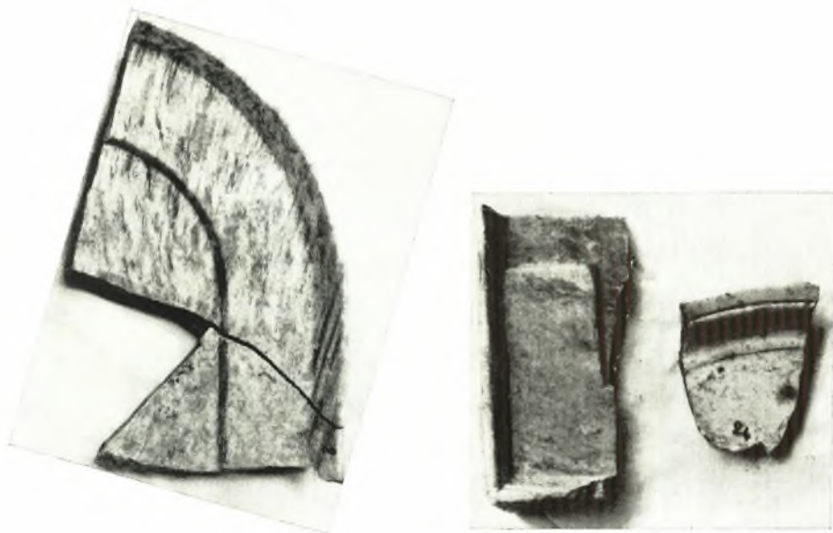
α - β. Τεμάχια ήμικυκλικής τραπέζης προθέσεως.