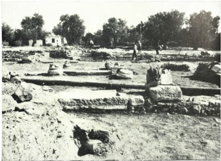
β. Ὁ νάρθηξ μετὰ τοῦ τριβήλου καὶ τοῦ ἱεροῦ εἰς τὸ βάθος.