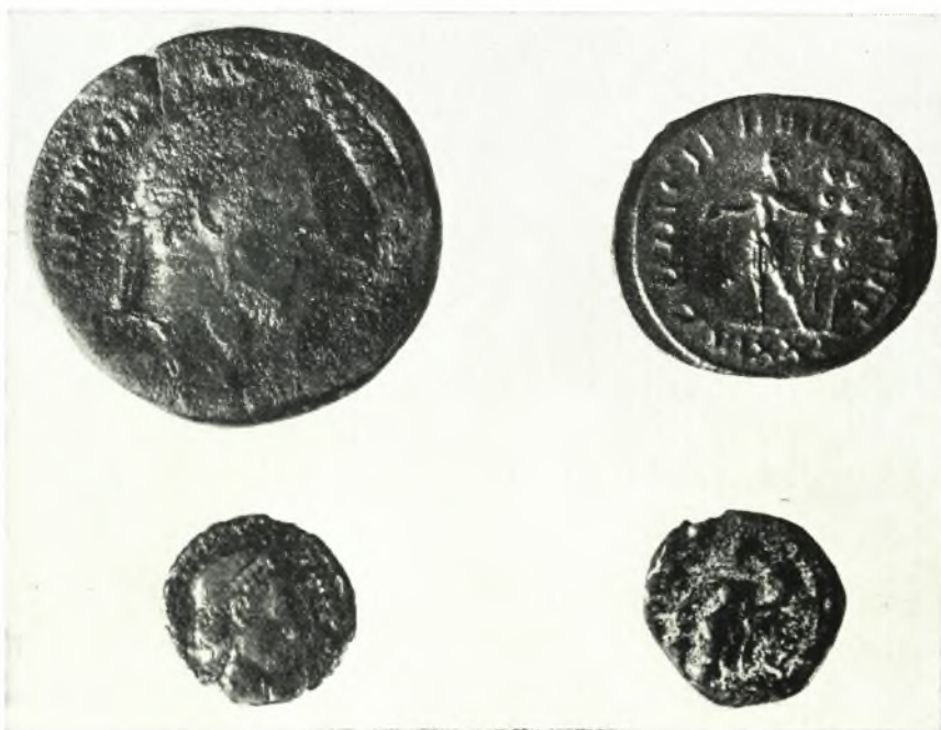
β. Ρωμαϊκά νομίσματα.