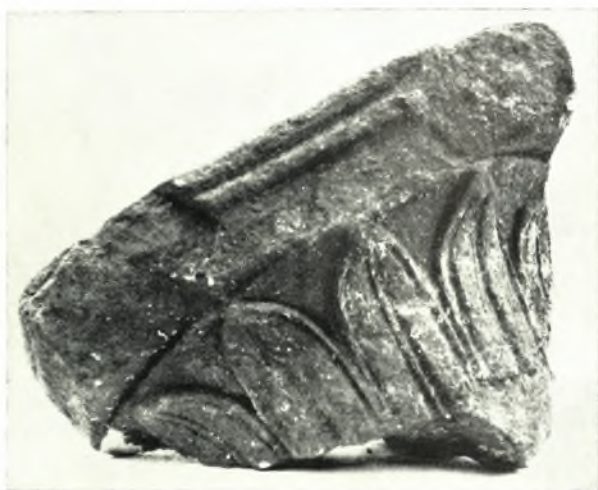
γ. Ἄνω τεμάχιον βάσεως περιρραντηρίου.