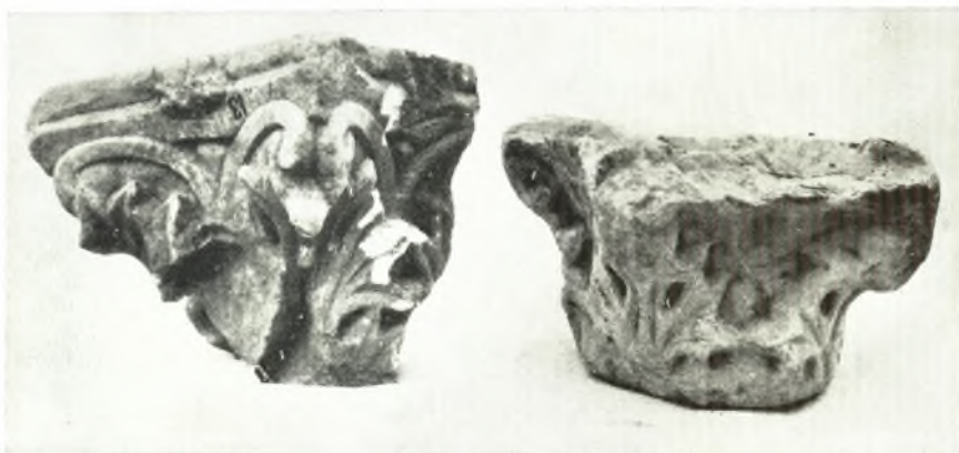
α. Κορινθιακά κιονόκρανα.