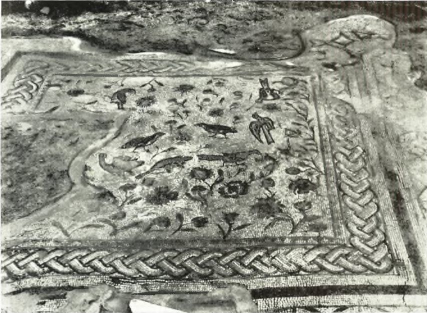
α. Τμήμα τοῦ μωσαϊκοῦ δαπέδου τῆς νοτίας ἀψίδος μετὰ τὰς ἐργασίας στερεώσεως.