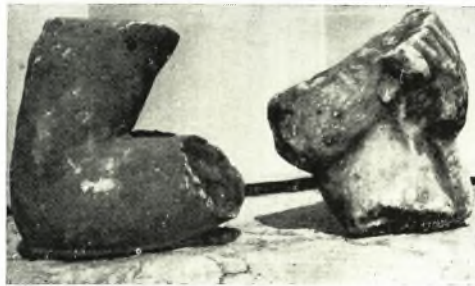
γ. Τμήματα χειρός καὶ γυναικείας κεφαλῆς ἐκ δύο διαφόρων ἔργων.