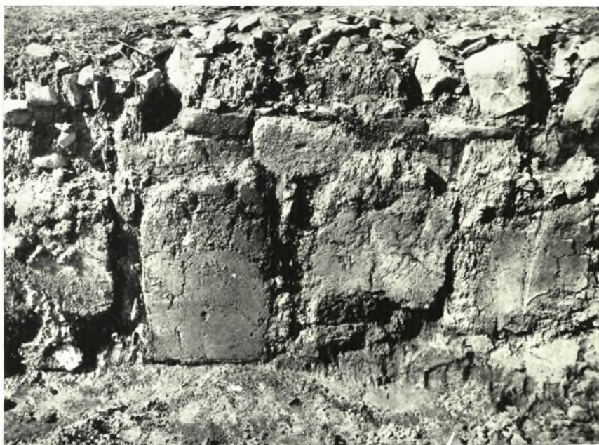
β. Ὑδραυλικὸν κονίαμα ἐπὶ τοῦ τοίχου τοῦ βάθους τῆς βορείας ἀψίδος.