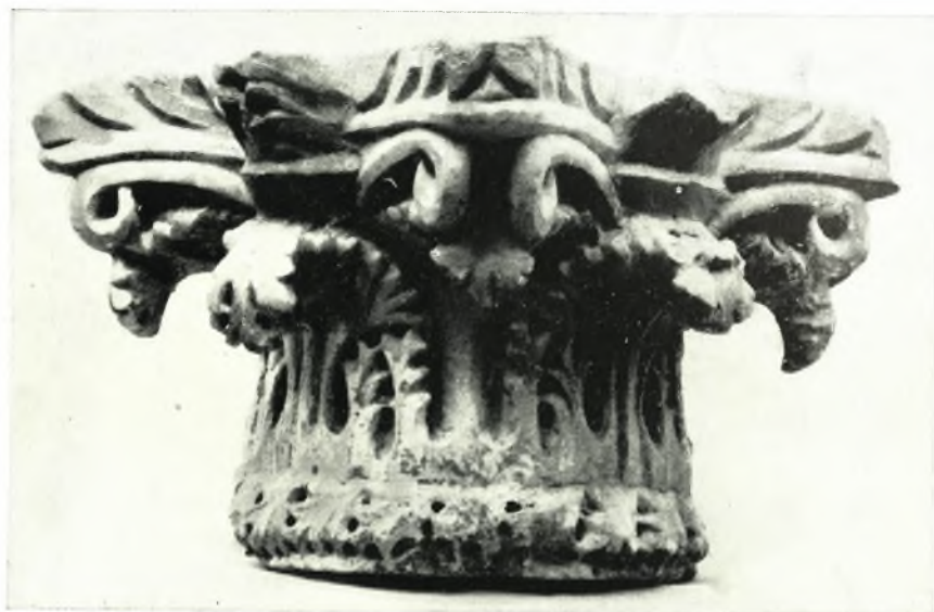
α - β. Κορινθιακά κιονόκρανα.