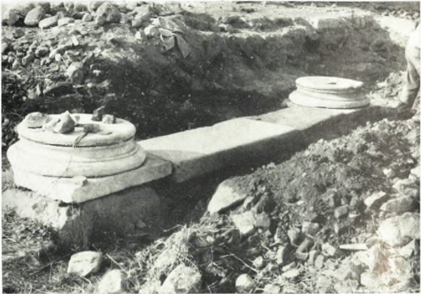
α. Τὸ τριβήλον.