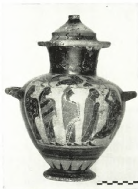
α. Μελανόμορφος ὕδρεια.