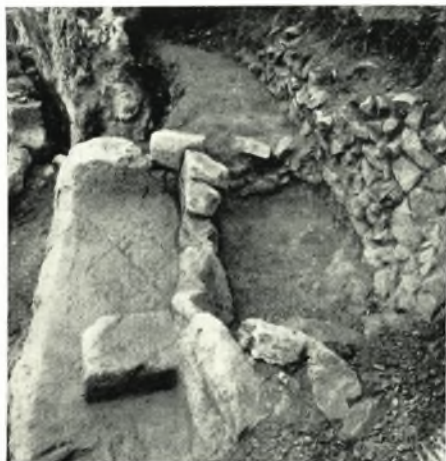
γ. Ταφή παρὰ τὴν στροφὴν τῆς ὁδοῦ.