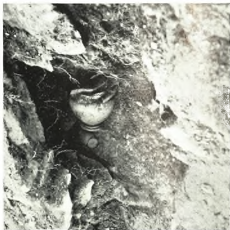
α - β. Ἀγγεῖα εἰς τὴν θολοειδῇ κατασκευὴν.