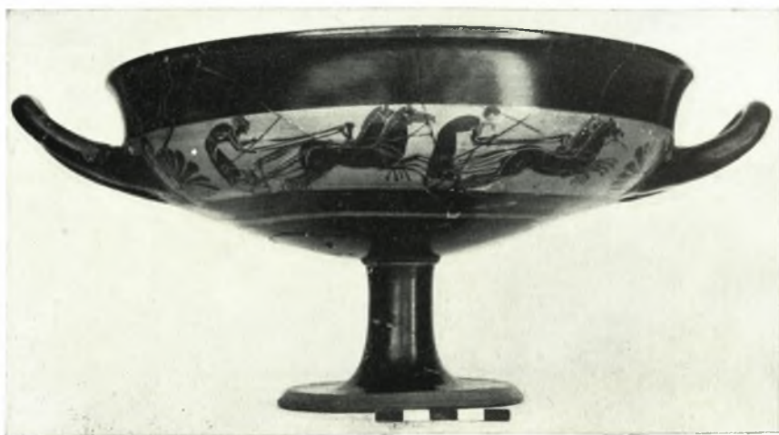
β. Ταινιωτή κύλιξ.