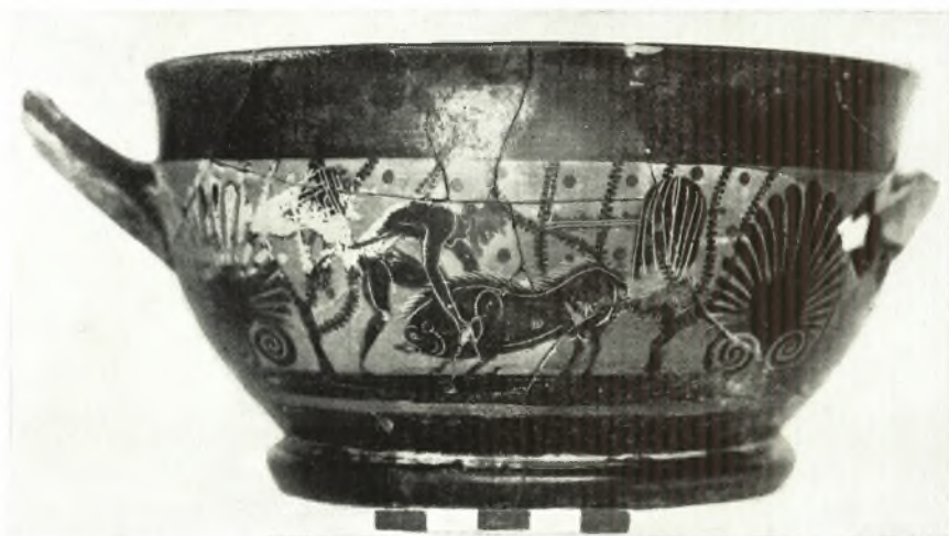
α. Μελανόμορφος άττικὸς σκύφος.