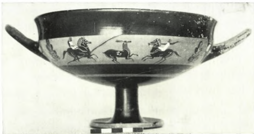
γ. Ταινιωτὴ κύλιξ.