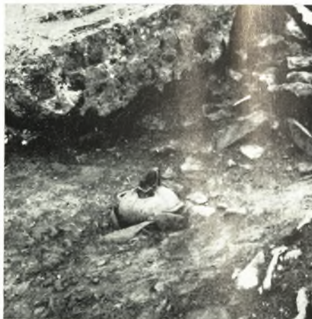
β. Ταφή παρὰ τὴν κλιμακωτὴν ἀτραπὸν.