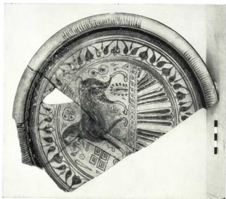
α - β. Γοδιακά πινάκια.