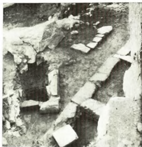
α - β. Συστάς αρχαίων τάφων.