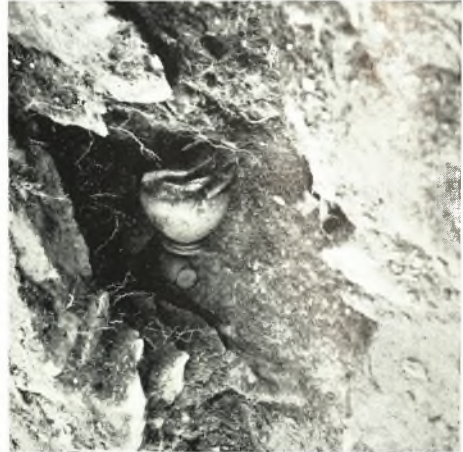
α - β. Ἀγγεῖα εἰς τὴν θολοειδῆ κατασκευὴν.