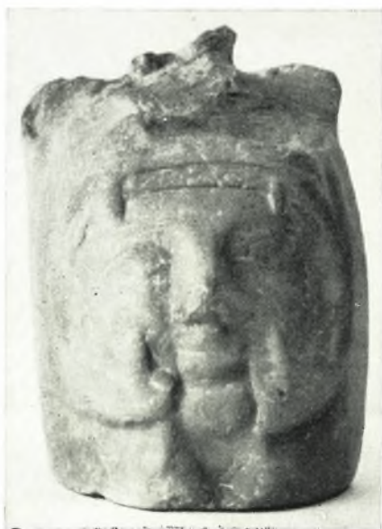
α. Πλαστικόν ἀγγεῖον.