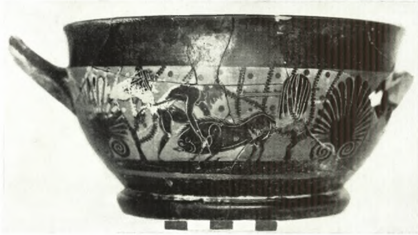
α. Μελανόμορφος άττικὸς σκύφος.