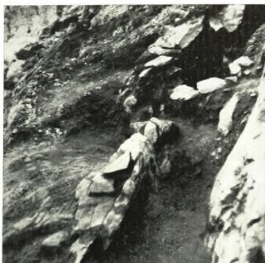
γ. Θολοειδής κατασκευή.