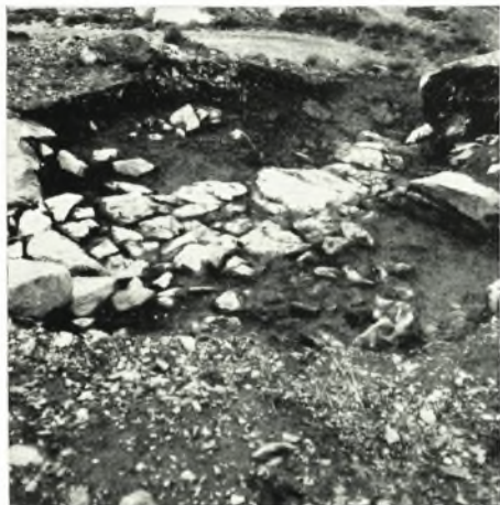
α. Ἡ κλιμακωτὴ ἀτραπός.