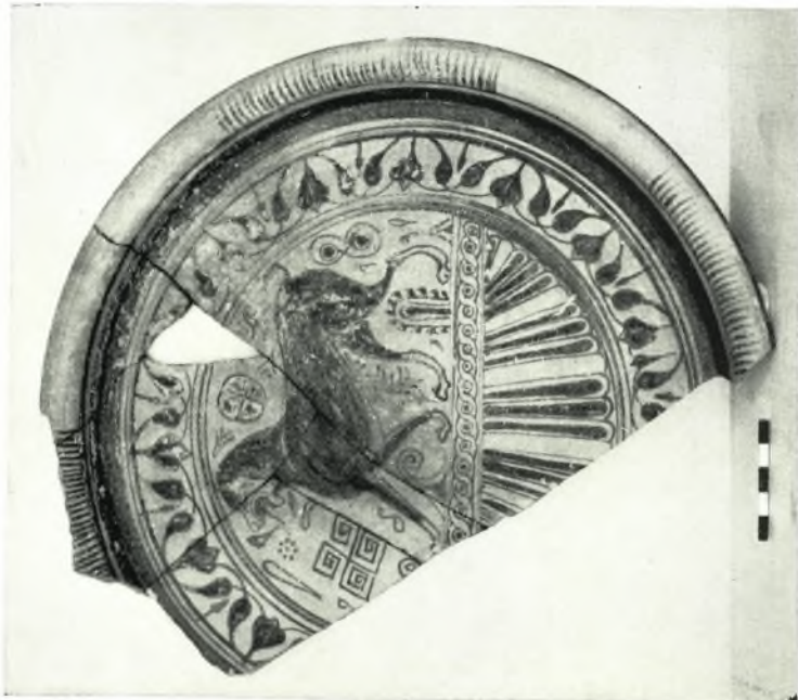
α - β. Ροδιακά πηνύκια.