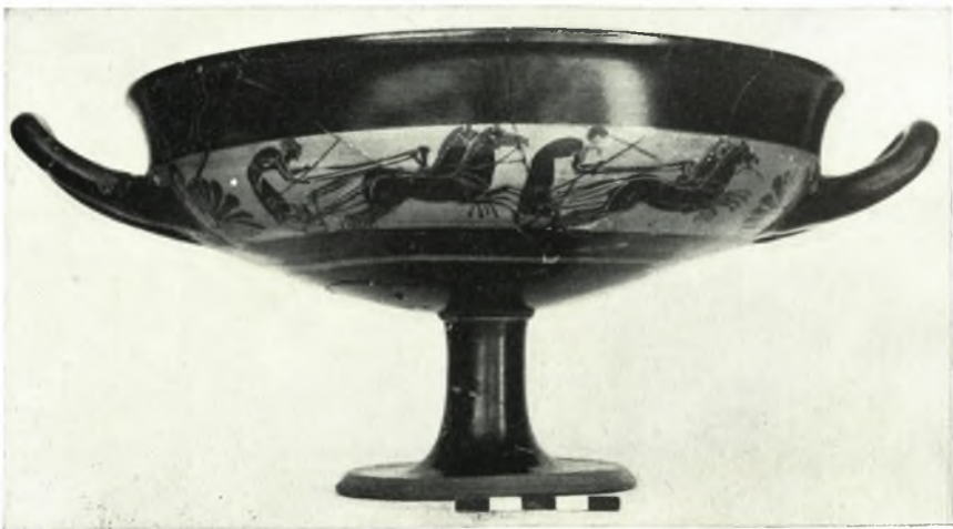
β. Ταινιωτή κύλιξ.