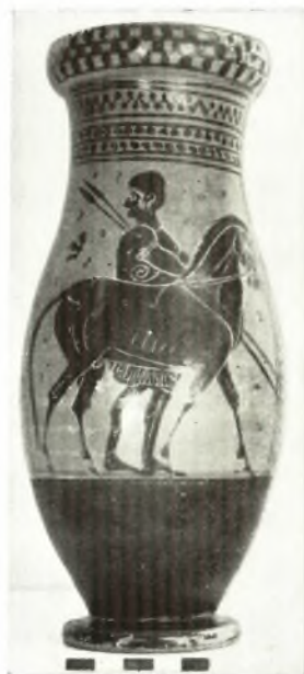
β. Μελανόμορφος ὄλπη.