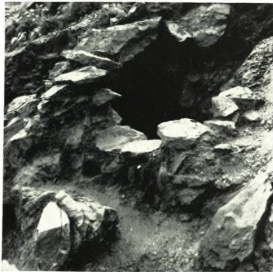
γ. Θολοειδῆς κατασκευή.