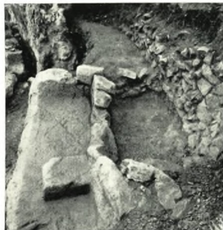
γ. Ταφή παρὰ τὴν στροφὴν τῆς ὁδοῦ.