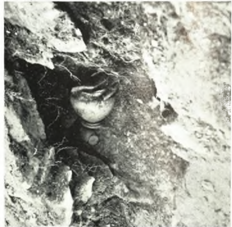
α - β. Ἀγγεῖα εἰς τὴν θολοειδῆ κατασκευὴν.