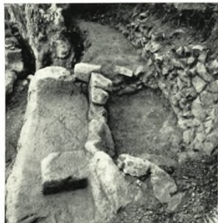
γ. Ταφή παρὰ τὴν στροφὴν τῆς ὁδοῦ.