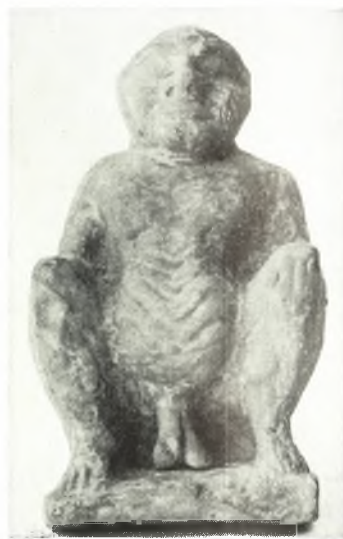
β. Ειδώλιον δαιμονικῆς μορφῆς.