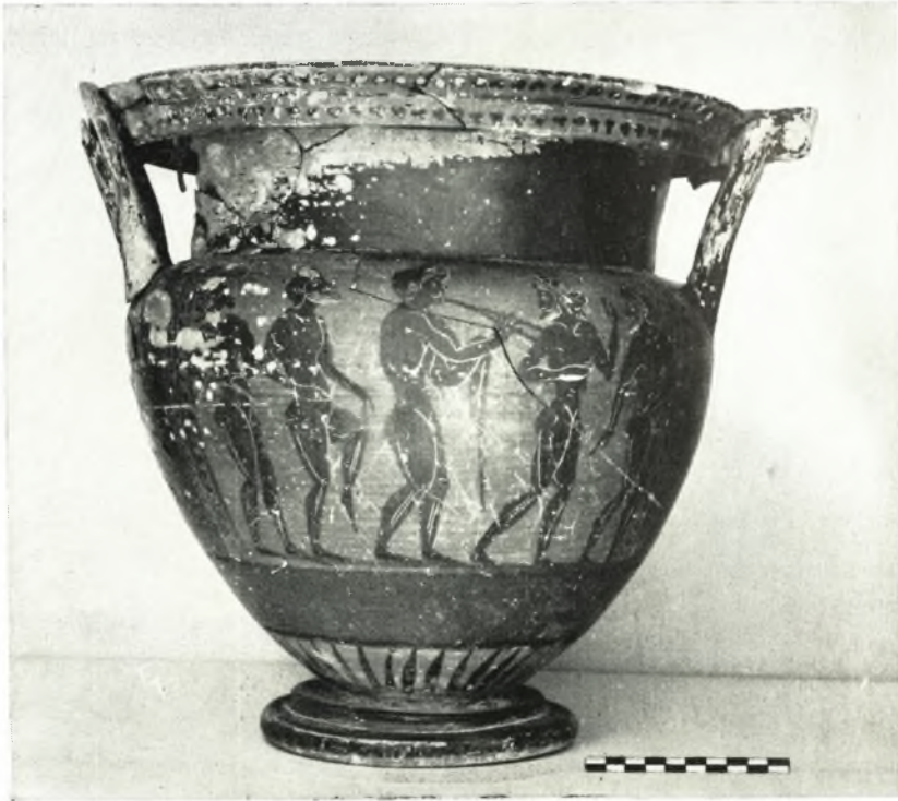
α. Μελανόμορφος κρατήρ.