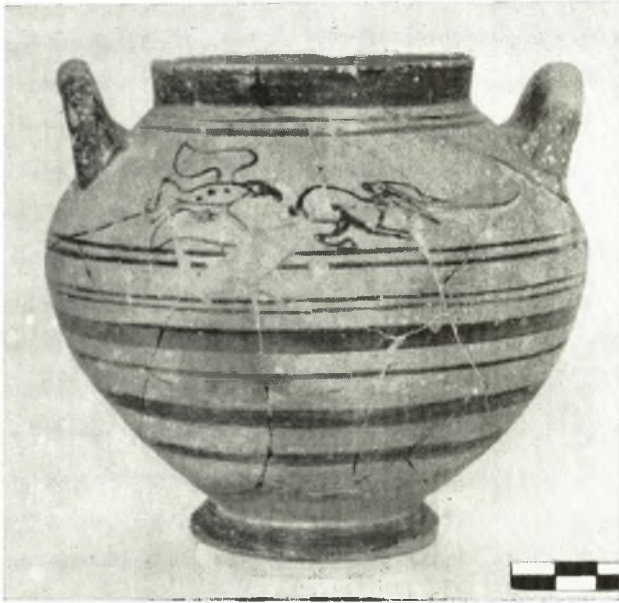
α. Ἀρχαϊκὴ θηραϊκὴ πυξίς.