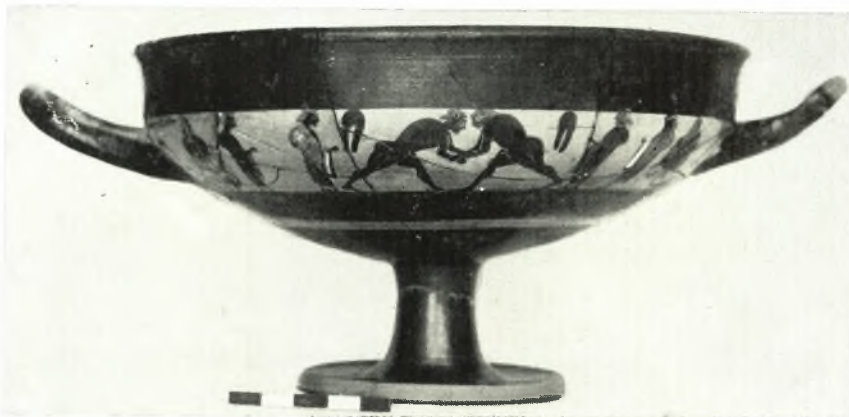
β. Ταινιωτὴ κύλιξ.