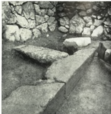
δ. Ὑστεροαρχαϊκὰ ταφικὰ κατασκευαί.