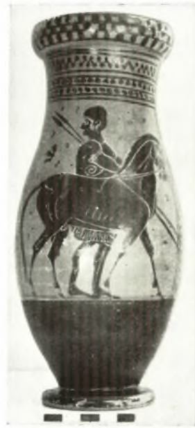
β. Μελανόμορφος ὄλπη.