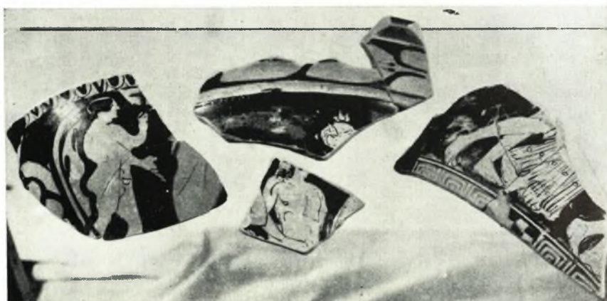
β. *Οστρακα ἐρυθρομόρφων ἀγγείων.