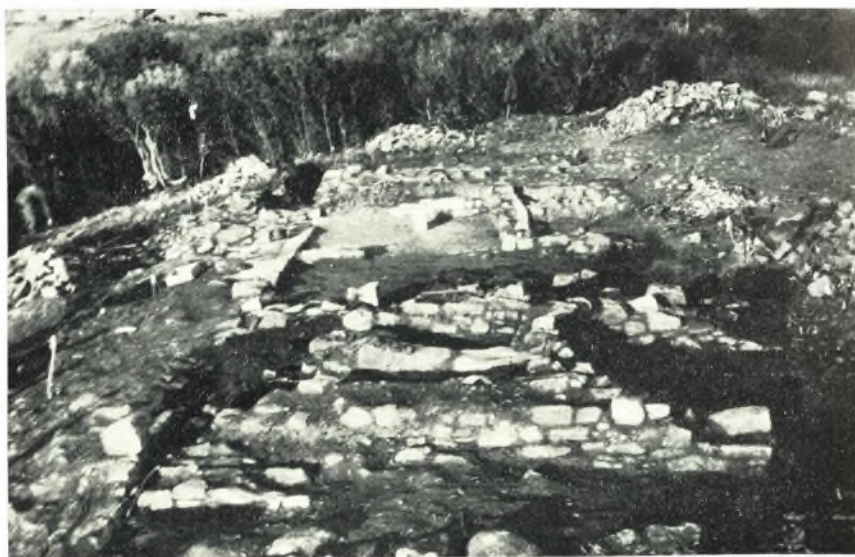
β. ΒΔ. γωνία εσωτερικώς.