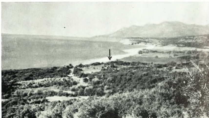
α. Γενική άποψς τοῦ χώρου τῆς ἀρχαίας Μεσημβρίας.