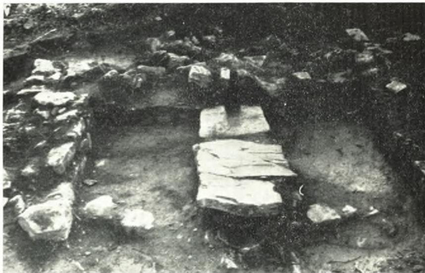
β. Τὸ χῶρισμα καὶ ὁ εἰς τὸ μέσον αὐτοῦ ληνός.