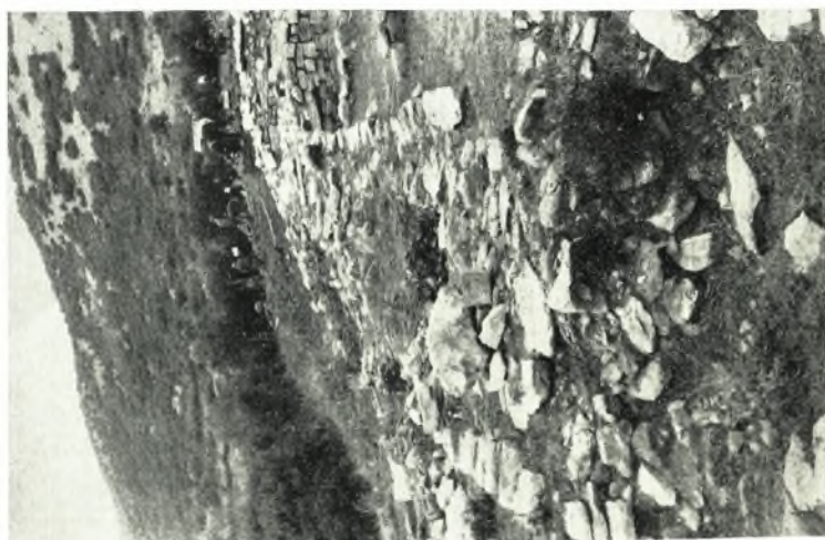
α - β. Βόρειος τοίχος μήκους 50 μ.