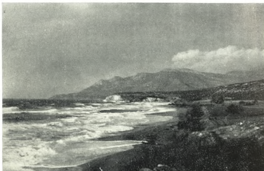
β. Παραλία Θρακικοῦ Πελάγους.