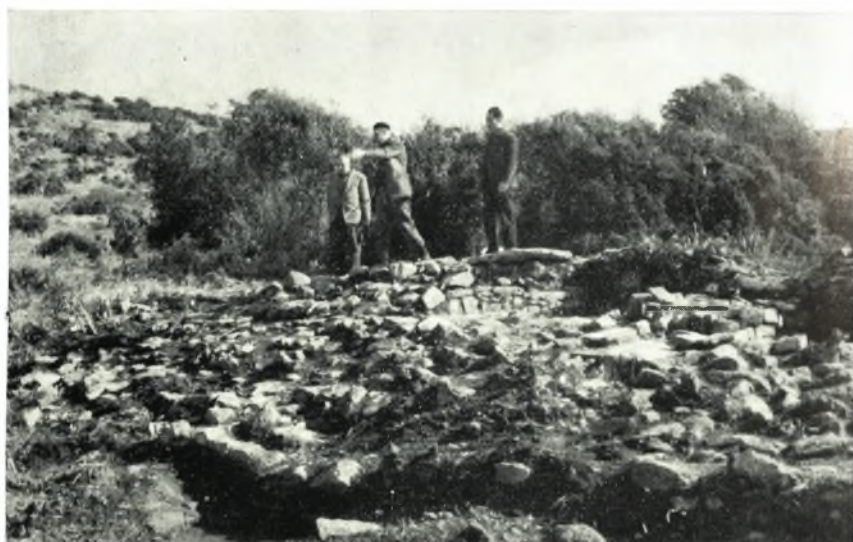
β. Μερική άποψς τοῦ χώρου τῆς ἀρχαίας Μεσημβρίας.