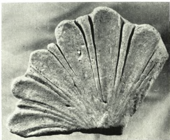
α - β. Ἀρχοζέραμοι.