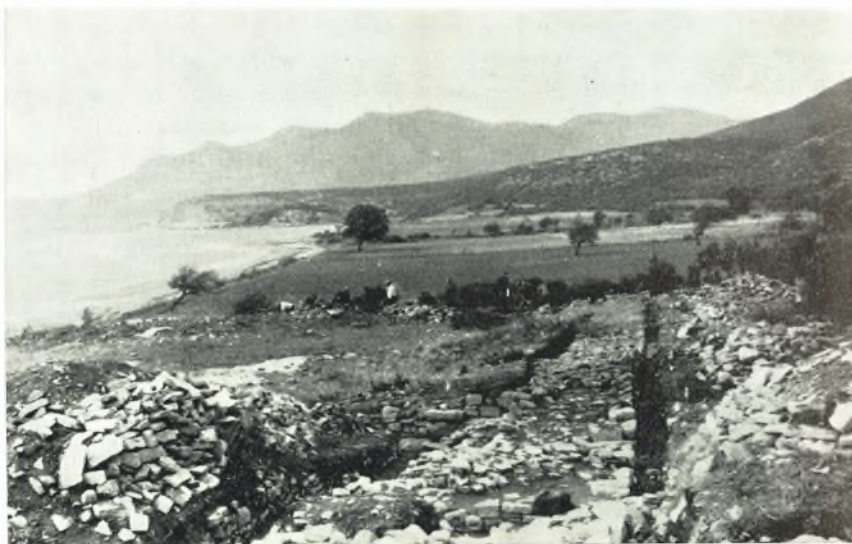
α. ΒΔ. γωνία - πύργος (;).