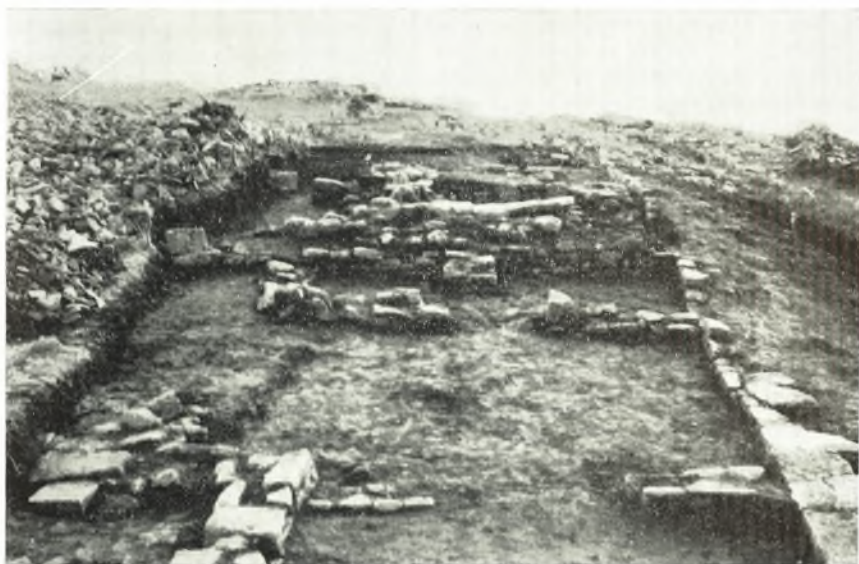
α. Ἀποψις τοῦ δυτικοῦ τοίχου ἀπὸ Βορρά.