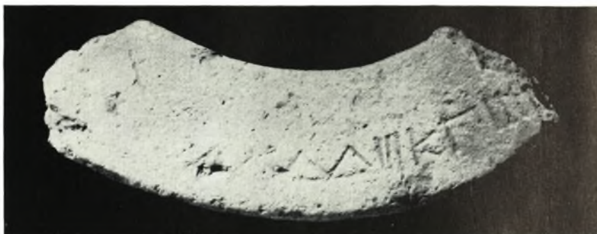
α. Τμήμα χείλους πίθου με ἐγγράφατα στοιχεία.