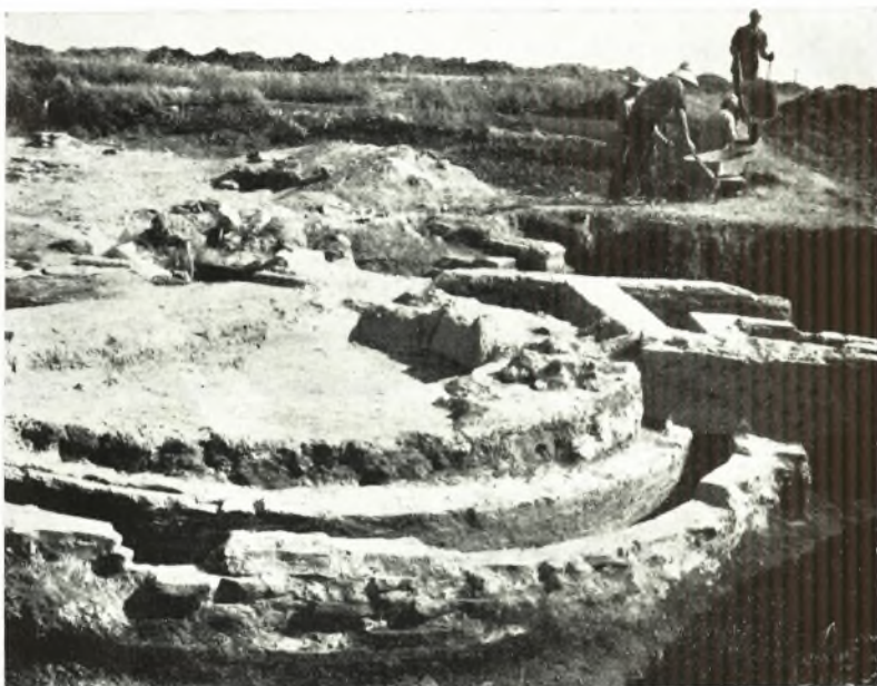
α. Ἡ πύελος μετὰ τοῦ ἡμικυκλικοῦ ἀγωγοῦ, ὁρῶμενα ἀπὸ ΒΔ.