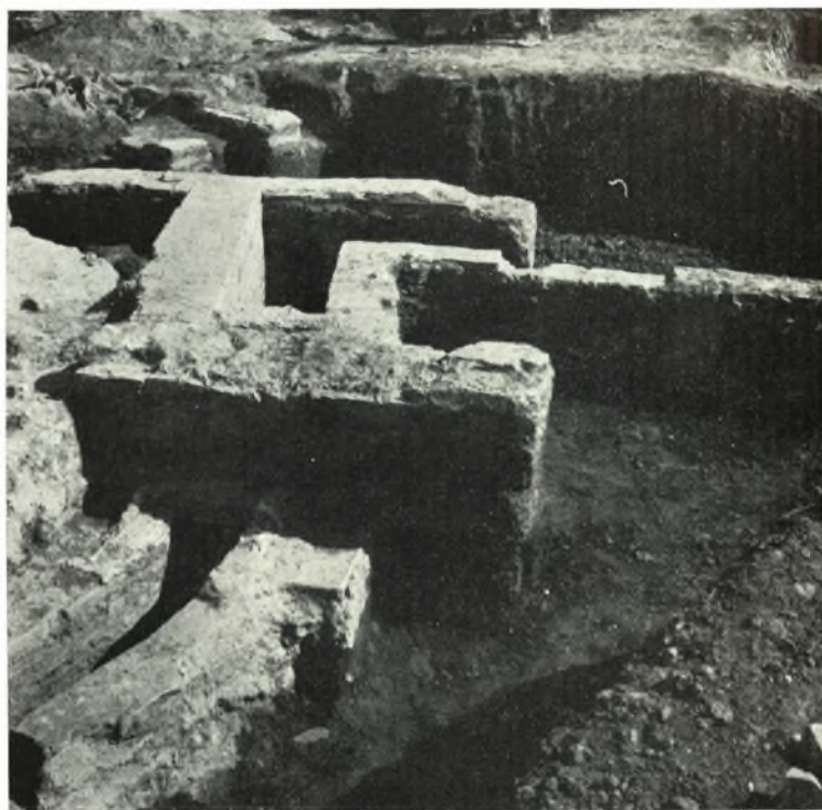
β. Ὁ ἀγωγὸς κατὰ τὸ σημεῖον τῆς πρὸς τὰ ΝΑ. γάμψεώς του.