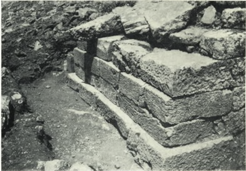
α. Ν. πλευρά θεμελιώσεως (βάθρου) τοῦ ναοῦ.