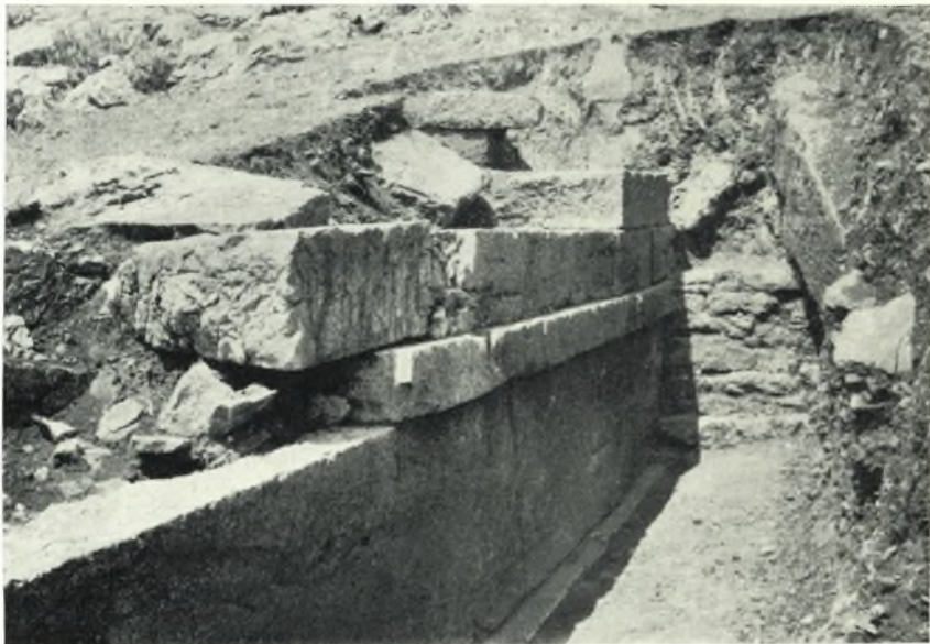
β. Τελεστήριον Β. πλευρά.