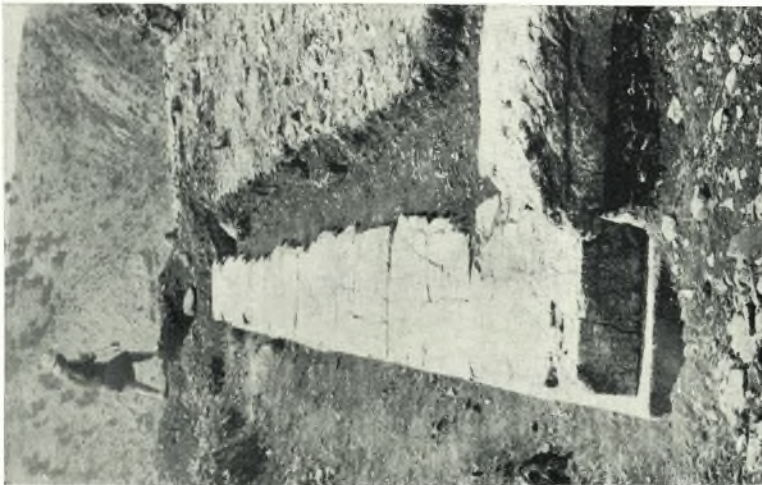
α. Τελεστήριον Α. πλευρά.