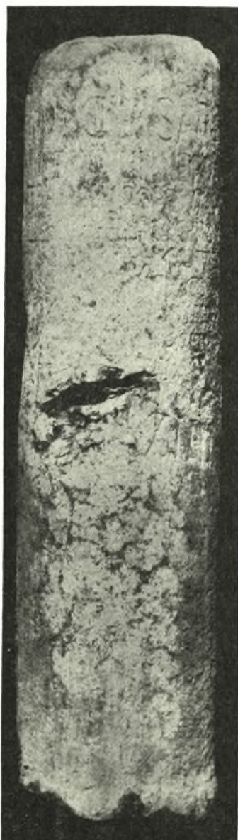
Εἰκ. 1. Τὸ μιλιάριον τοῦ Ἐπιταλίου.

Εἰς τὸ Ἀρχαιολογικὸν Δελτίον (23, 1968, Χρονικά, σ. 168) ἐδημοσιεύθη λατινικὴ ἐπιγραφὴ ρωμαϊκοῦ ὁδοσήμου (μιλιαρίου) 1 , εὑρεθεῖσα κατὰ τὰς ἀνασκαφὰς ἐν Ἐπιταλίῳ τὸν Ὀκτώβριον τοῦ 1967. Ἀναδημοσιεύομεν ἐνταῦθα τὸ κείμενον τῆς ἐπιγραφῆς (πίν. IB), ἀπηλλαγμένον σφαλμάτων τινῶν, ἅτινα διέφυγον τῆς προσοχῆς κατὰ τὴν πρώτην παρουσίαν :